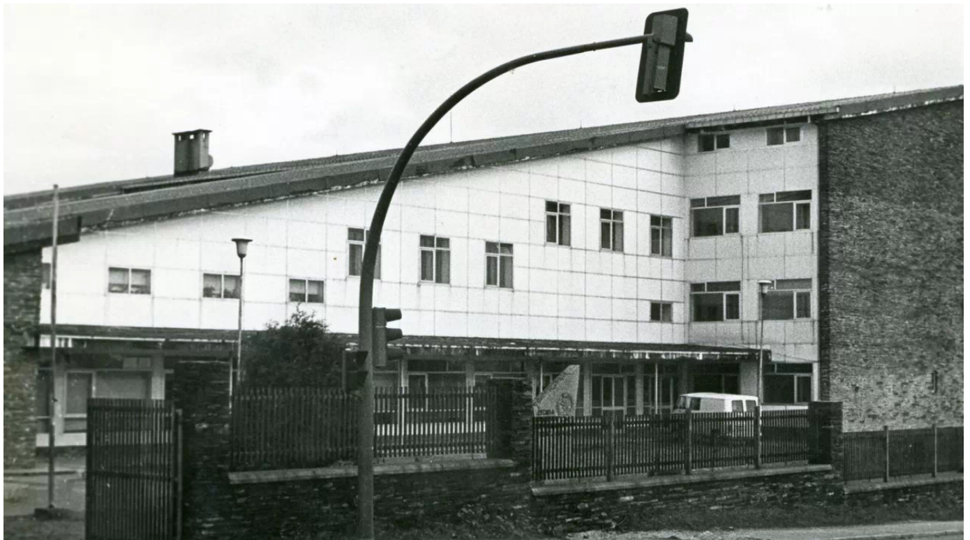
Fachada principal de la vieja escuela de peritos agrícolas, en la avenida de Madrid .

Lugo celebra los 50 años de la primera promoción de la escuela de peritos agrícolas