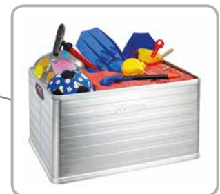
Viel Platz für diverse Gegenstände

Die Alukiste hat im Laufe der Jahre immer mehr Liebhaber gewonnen, da Aluminium leicht, stabil, temperaturbeständig, robust, rostfrei und hygienisch sowie lebensmittelgeeignet ist. Für eine Kiste, egal für welchen Zweck, ob als Transportkiste oder als Stapelkiste für die persönliche Aufbewahrung, gibt es keine bessere Alternative als die Alukiste – von Ottawa S mit 30 Litern Inhalt bis zu Ottawa XXL mit 120 Litern Inhalt.