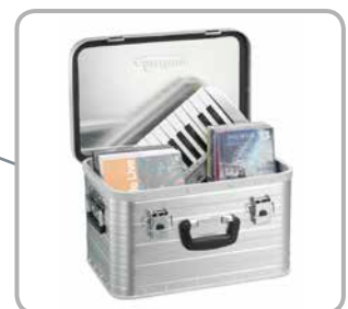
Viel Platz für diverse Gegenstände