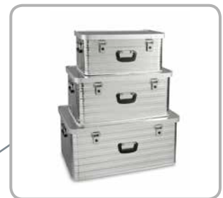
Aufeinander und ineinander stapelbar