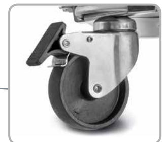
Zubehör: Einsetzbare Rollen für den noch leichteren Transport