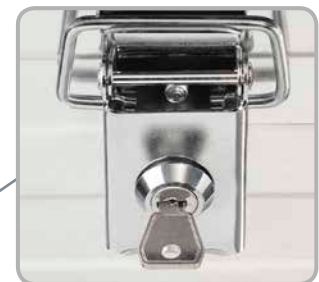
Zubehör: Einsetzbares Steckschloss