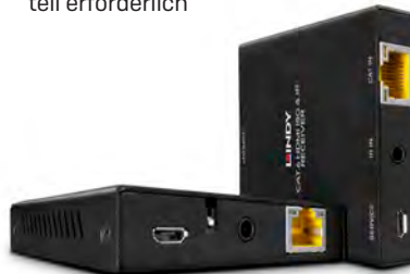
▶ No. 38205