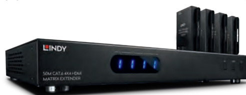
▶ No. 38154