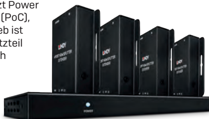
▶ No. 38155