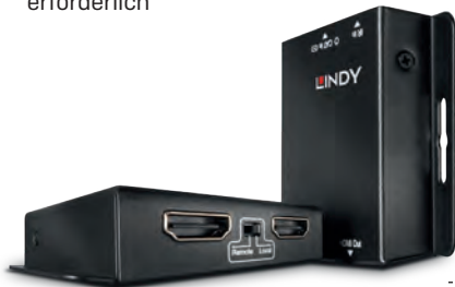
▶ No. 38144