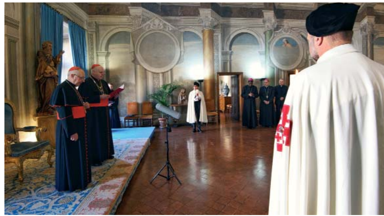
Accueil officiel du cardinal Fernando Filoni au Palazzo della Rovere, le 16 janvier 2020.