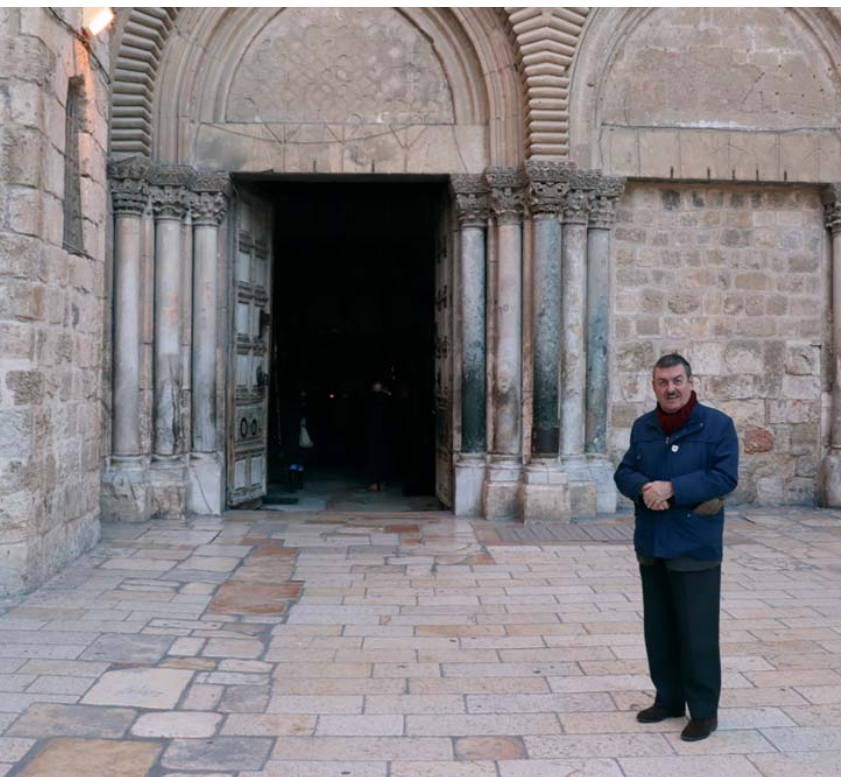
Le Gouverneur Général devant l'entrée de la basilique du Saint-Sépulcre, lors d'un pèlerinage en Terre Sainte avec le staff du Grand Magistère, en février 2019.

présence chrétienne dans les lieux où notre Seigneur est né, a vécu, est mort et ressuscité, mais aussi pour favoriser ce dialogue, cette coexistence pacifique, ce respect qui sont les prémisses nécessaires à un avenir de paix dans ces terres tourmentées. Et pour ce faire, nous n'avons pas à effectuer une action épisodique déconnectée ; nous devons opérer selon une stratégie précise, une analyse des priorités, une planification minutieuse des temps et des lieux.