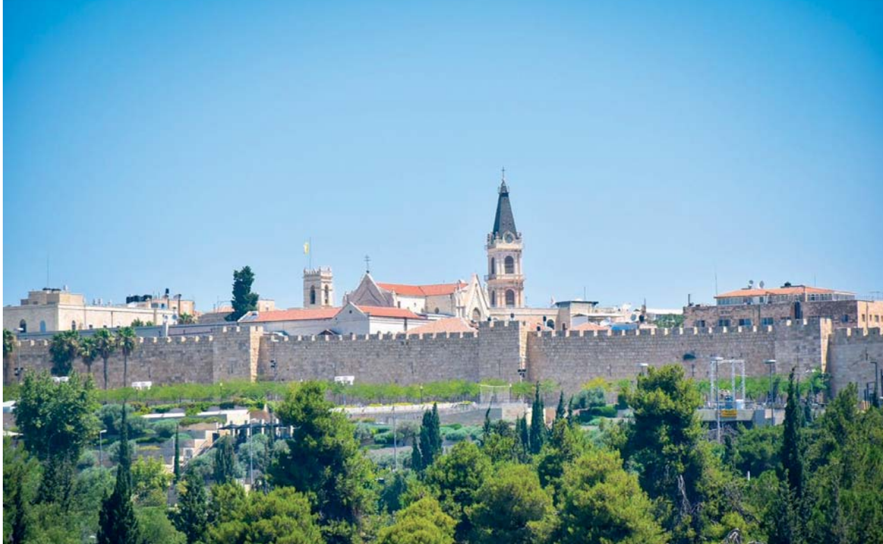
Une vue du Patriarcat de Jérusalem où se trouvent les collections décrites dans cet article.