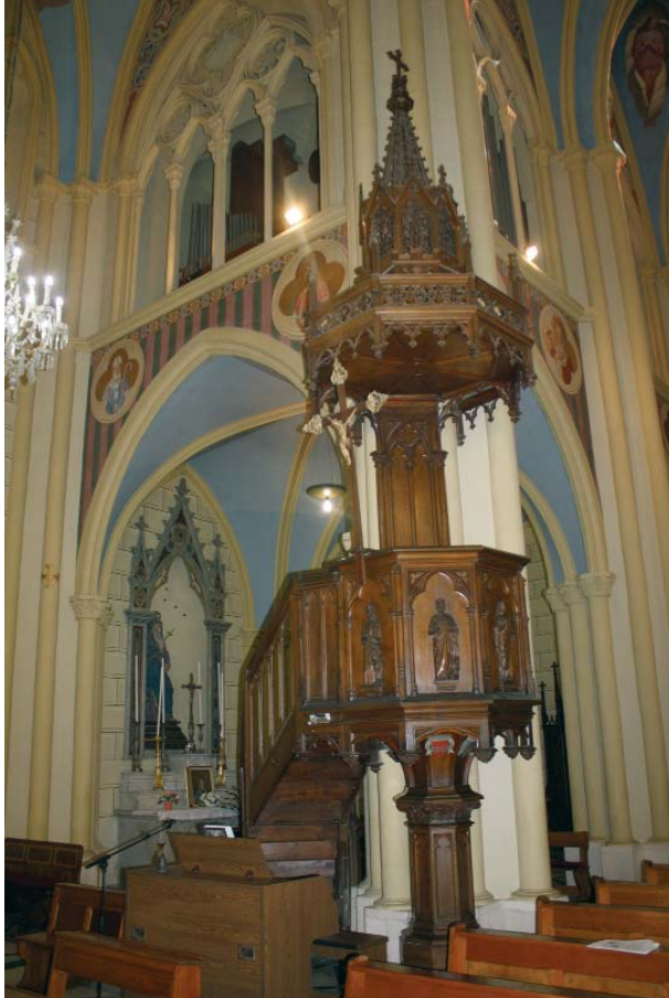
Chaire à prêcher.