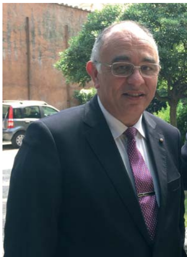
Le nouveau Vice-Gouverneur Général pour l'Amérique centrale et du sud, Enric Mas.

fin de juin 2019 et il voit de nombreuses possibilités pour l'avenir : « L'Amérique latine est plus qu'un continent et offre de grandes opportunités de croissance dans tous les secteurs. C'est une région où l'Ordre du Saint-Sépulcre peut certainement continuer à se développer ».