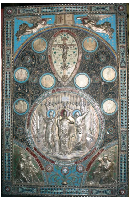
Coffret de l'Alliance catholique, Armand-Calliat, argent doré et émaux, Lyon, vers 1885, détail du médaillon central.

par Urbain II. Le médaillon central montre le pape entouré du bienheureux Pierre l'Ermite et de saint Louis tenant la Couronne d'épines. Deux devises sont également lisibles l'une en face de l'autre : Dieu le veut , cri de ralliement des premiers croisés et devise de l'Ordre équestre du Saint-Sépulcre de Jérusalem ainsi que Nous voulons Dieu , dénonçant l'oppression subie par les catholiques en France à cette période. On peut y voir aussi l'étendard de l'Alliance catholique transperçant « la bête in-