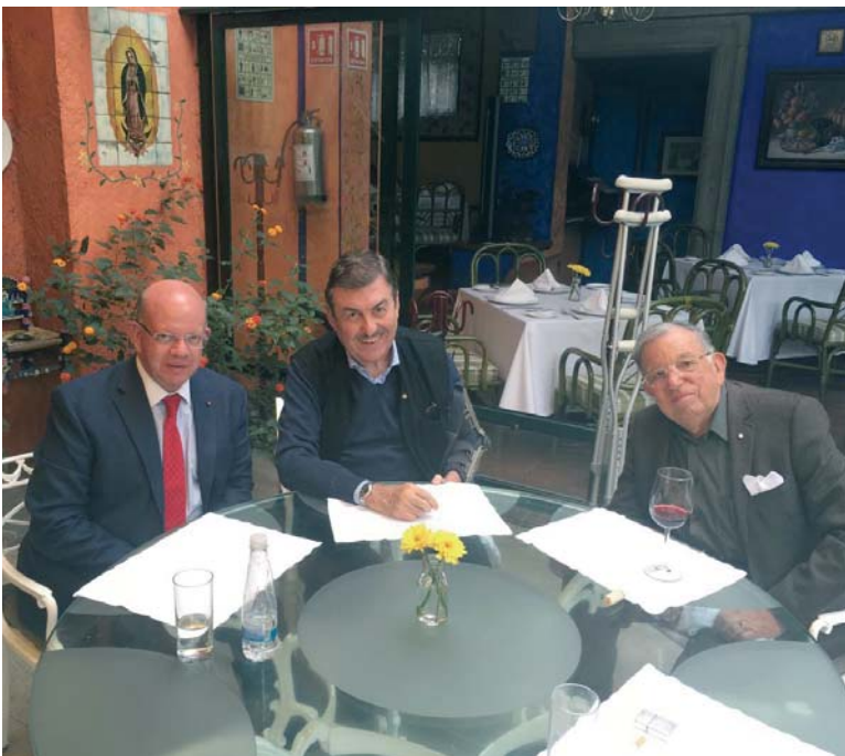
Le Gouverneur Général à Mexico durant l'été 2019, entouré du Lieutenant pour le Mexique d'alors et de son actuel successeur.

Modrone un plan d'action, au cours de leurs visites au Mexique, en Argentine et au Brésil, durant l'été 2019.