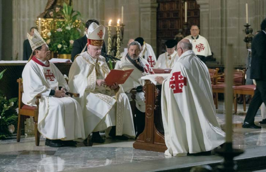
La cérémonie d'Investiture au Mexique a été marquée par l'entrée en fonction du nouveau Lieutenant, Guillermo Macías Graue.