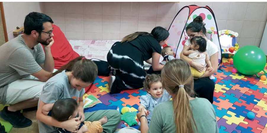
Au cours d'une activité de volontariat auprès des enfants dans un des établissements soutenus par l'Ordre en Terre Sainte.