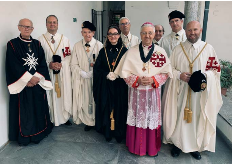
Au cours de l'année 2019, la Lieutenante pour la Suisse a eu la chance de participer à trois investitures à l'étranger (ici à Milan).

lieutenance respective. Cela montre que nous sommes une grande famille, non seulement au sein de nos propres lieutenances, mais aussi au-delà des frontières nationales et même au-delà des océans et des continents. Notamment la Consulta de 2018 a également démontré cette solidarité entre nous.