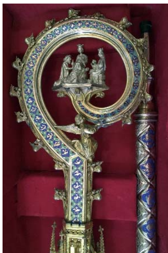
Crosse offerte par les chevaliers du Saint-Sépulcre de Cologne, G. Hermeling, argent et émaux, Cologne, 1862.