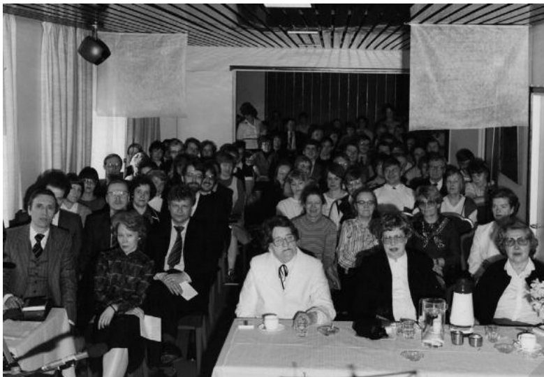
Pääsiäisenä -84 vuosikokouksessa hotelli Tottissa Savonlinnassa.