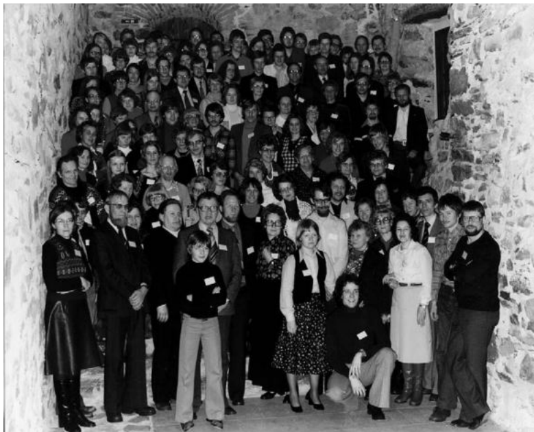
Kirjeopisto Vian Oppilaskunnan vuosikokous Olavinlinnassa 70-luvun loppupuolella.