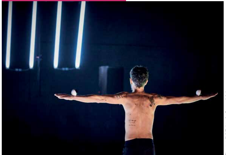
Time to tell

Le Théâtre [troglo] du Rossignolet déploie sa saison culturelle 2023-2024 jusqu'en juin avec de nombreux rendez-vous pour tous les publics. En février, deux concerts sont programmés au théâtre, puis en mars, un spectacle de jonglage contemporain à l'Espace Agnès Sorel.