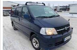
Toyota Hiace 2,5d, NELIVETO, PITKÄ, vm. 2007, manuaali, aj. 343 500 km, kats. 2/22, kahdet renkaat, ilmastointi, webasto, juuri tehty iso huolto, vetokoukku. 10750€ sis. 24% alv.