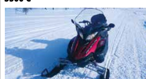
Myös vaihto onnistuu. Rahoitus jopa ilman käsirahaa ja kaskopakkoa. Pienellä kuukausierällä alk. 69 €/kk.