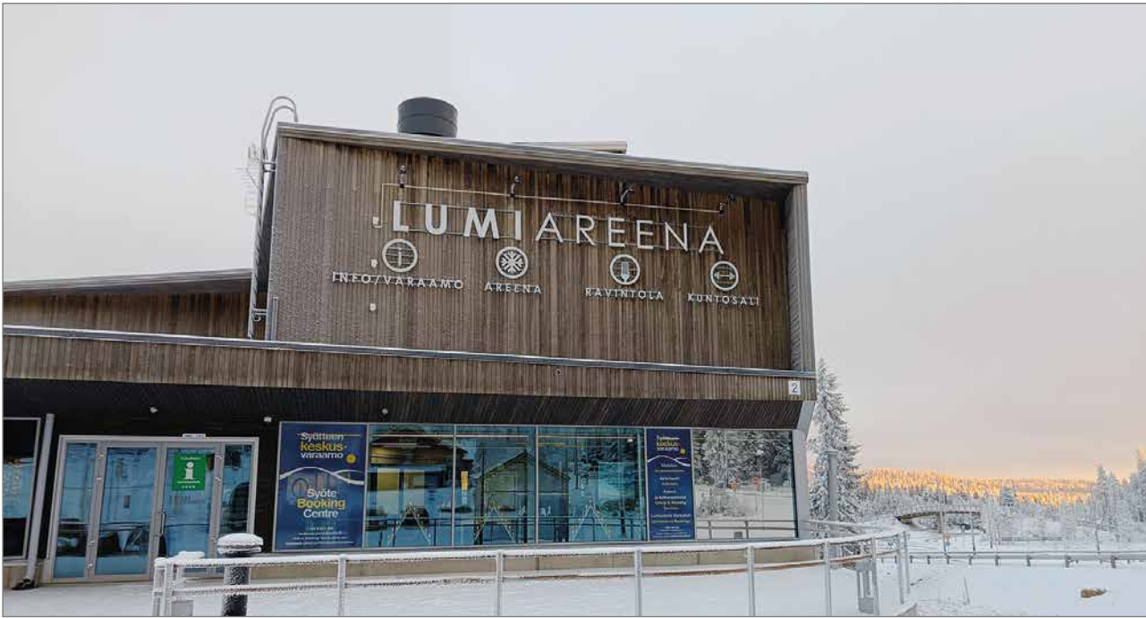
Syötteen keskusvaraamo palvelee LumiAreenan rakennuksessa talvikaudellakin maanantaista lauantaihin.