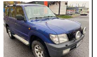
Toyota Landcruiser 3,0TD, automaatti, HYVÄ, 7 henk., vm. 2000, aj. 580 100 km, kats. 1/22, kahdet renkaat, lohkolämmitin, akkulaturi, hyvin huollettu, vetokoukku. 7950 €