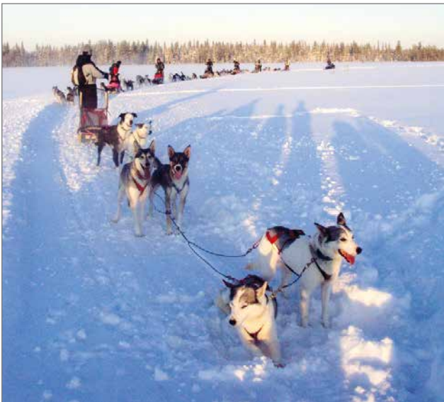
Finn-Jann-koiravaljakot ovat innostuneita, kun pääsevät oman työnsä ääreen.

-Nyt valmistaudumme tulevaan safarikauteen. Syksyn kelit ovat olleet suotuisat treenaamiseen ja olemme pystyneet toteuttamaan treniohjelman koirillemme suunnitellusti. Virtaa tuntuu olevan mukavasti tuleviin haasteisiin. Kauden varustilanne näyttää varsin hyvälle ja kun oppaiden osalta on kokenut porukka koossa, niin seuraavien lumisateiden myötä olemme valmiita kauden, toteaa Jokela tyytyväisenä. R.E.