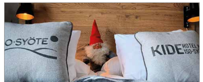
KIDE Hotel by Iso-Syöte on toista vuotta peräkkäin palkittu Suomen parhaana lasketteluhotellina.

Syötteen upea luonto ja monipuoliset aktiviteettimahdollisuudet kiinnostavat kotimaisten matkailijoiden lisäksi myös ulkomaalaisia. Suomalaisen ykkösharrastuksen ollessa laskettelu kansainvälisten matkailijoiden suosiossa ovat erityisesti revontuliretket sekä huskysafarit. Myös