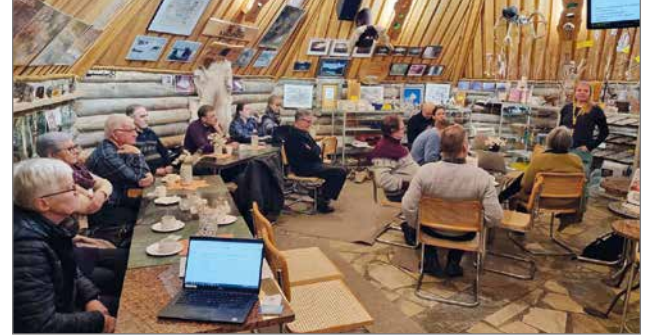
Aten kodan viihtyisissä tiloissa Syötteellä keskusteltiin metsänhoidon uusista vaihtoehdoista.

Pudasjärven Kelosyötteellä Aten mökeillä keskusteltiin keskiviikkona 23.11. perinteisen metsänhoidon vaihtoehtoisista menetelmistä ja uusista mahdollisuuksista saada taloudellista tuottoa metsistä. Tilaisuuden järjesti Metsiin perustuvat matkailun hiilipäästöjen kompensatiomallit - esimerkkinä Koillis-Suomi (MAHIS) -hanke, jota toteuttavat Koillis-Suomen kehittämissyhtiö Naturpolis, Luonnonvarakeskus (LUKE) sekä Oulun yliopisto. Paikalle saapui puolentoistakymmenkunta aiheesta kiinnostunutta metsänomistajaa ja metsäalan asiantuntijaa.