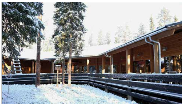
Luontokeskuksen uudistus on valmistumassa joulukuun alkupuolella.

- Olemme iloisia, että vastaanotto oli niin positiivinen. Etenkin paikallisten