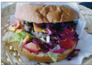
Hirvenjauhelihapihvin sisältävä Eräburger ja naudanlihasta valmistettu Lapin härkä ovat olleet asiakkaiden suosiossa.

Toki listalta löytyy myös kasvisvaihtoehto, ja suurin osa burgereista on mahdollista valmistaa myös gluteenittomana. Burgerin kaveriksi tarjolla on rapeita ranskalaisia ja palanpainikkeeksi saa limsojen lisäksi alkoholittomia oluita. Erityisesti hirvenjauhelihapihvin