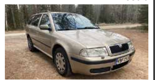
Skoda Octavia farmari 1,6 bens., JUURI KATSASTETTU, kahdet renkaat, ilmastointi, vakkari. 2650 €