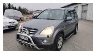
Honda CR-V 2,0 bens., automaatti, NELIVETO, SIISTI, aj. 288500 kats. 8/22, kahdet renkaat aluilla, vakkari, ilmastointi. 5500 €