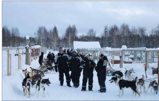
Safari on päättynyt ja iloiset retkeläiset vertailevat kokemuksiaan.

Uutena palveluna aloitimme pienimuotoisen baaritoiminnan tiloissamme. Rekipirtiksi nimetyssä pubissamme on anniskelu- ja varsin tuhdit karaokelaitteet valoineen. Näiden ylläpitäessä ravintolasta saa myös pikkupurtavaa. Ravintola on ollut avoinna toistaiseksi vain lauanta-iltaisin. Safarikauden alkaessa ravintolan auki oloinen on vielä harkinnassa.