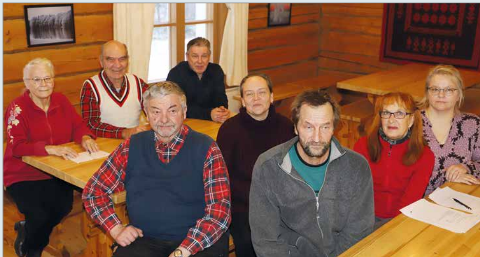
Syyskokous pidettiin Liepeen väentuvan viihtyisissä tiloissa.

tehtiin tämän hetkisestä vaikeasta maailman tilanteesta. Todettiin, että Venäjän hyökkäys Ukrainaan on aiheuttanut myös Suomessa elinkustannusten korkean nousun. Monen pienituloisen elämä on vaikeutunut