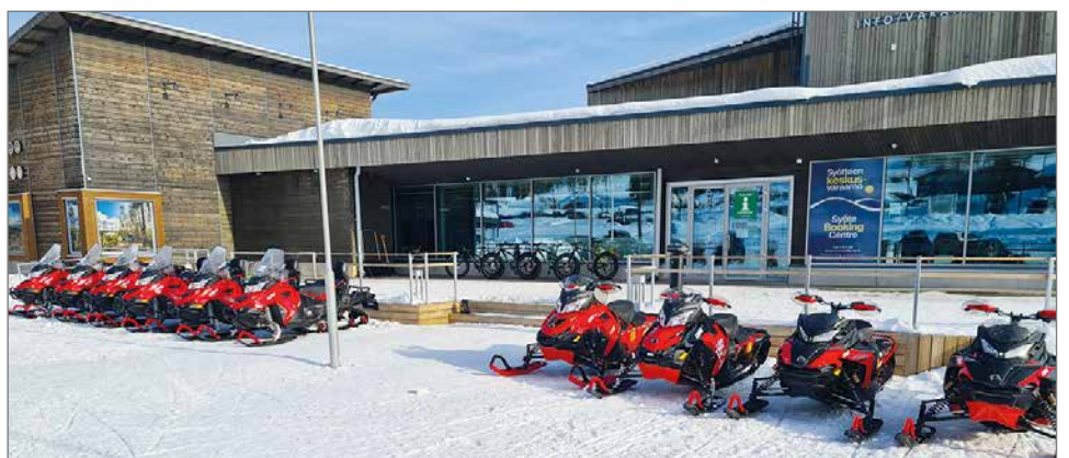
Syöte Rent&Safaris vuokraa kelkat, pyörät, lumikengät, rattikelkat ja pulkat sekä hoitaa LumiAreenan urheiluvuorojen varaukset.

Omatoimiseen talvipyöräilyyn sopivia läskipyöriä löy-