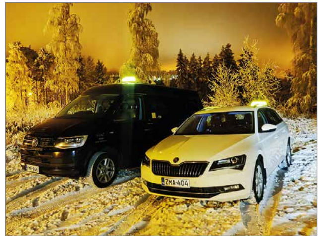
Tervetuloa kyytiimme - Kiireen pohjoispuolelle!

Kelakyytien lisäksi ajamme vammaispalvelu- ja sosiaalihuoltolain mukaisia pal-