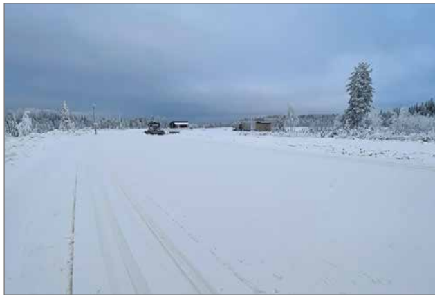
Erinomaiset säät ovat myötävaikuttaneet, että hiihtämään on päästy jo 22.11.

Syötteen Latupooli ry:n vuosibudjetti noin 200.000 euroa. Tulot kertyvät Pudasjärven kaupungin, yritysten, mökkiläisten ja yksittäisten päiväkävijöiden maksuista. Monet hiihtäjät lunastavat poolin latupassin päiväksi, viikoksi tai koko kaudeksi, jonka tuotto käytetään latuverkon ylläpitämiseen. Latukartasta voi skannata äly-