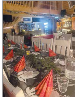
Viihtyisässä Rekipirtissä voi istahtaa nauttimaan hyvästä musiikista juoman ja pienen purttavan kanssa. Tilauksesta siellä voidaan järjestää erilaisia tilaisuuksia.