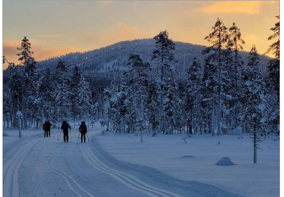
Kansallispuiston laduilla, Annu Tuohiluoto.

Murtomaahiihtäjälle Syöte tarjoaa parhaimmillaan yli 100 kilometrin edestä monipuolisia latuja.