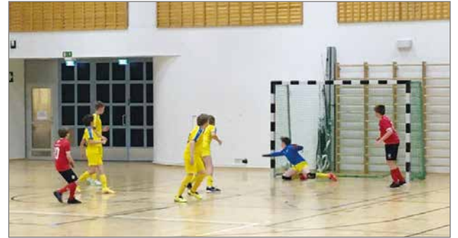
Haukiputaan turnauksessa FC Kurenpojat ja OLS/Itä tasasivat pisteet.

Pitkän turnauspäivän viimeisessä pelissä oululainen OLS/Itä aloitti pelin sähkösti ja siirtyi ensimmäisestä tilanteestaan 1-0 johtoon. Unto Niemelä laukoi tasoituksen minuuttia myöhemmin. Molemmilla joukkueilla oli tämän jälkeen hyviä maalipaikkoja, mutta maaleja saatiin odottaa puoliajan