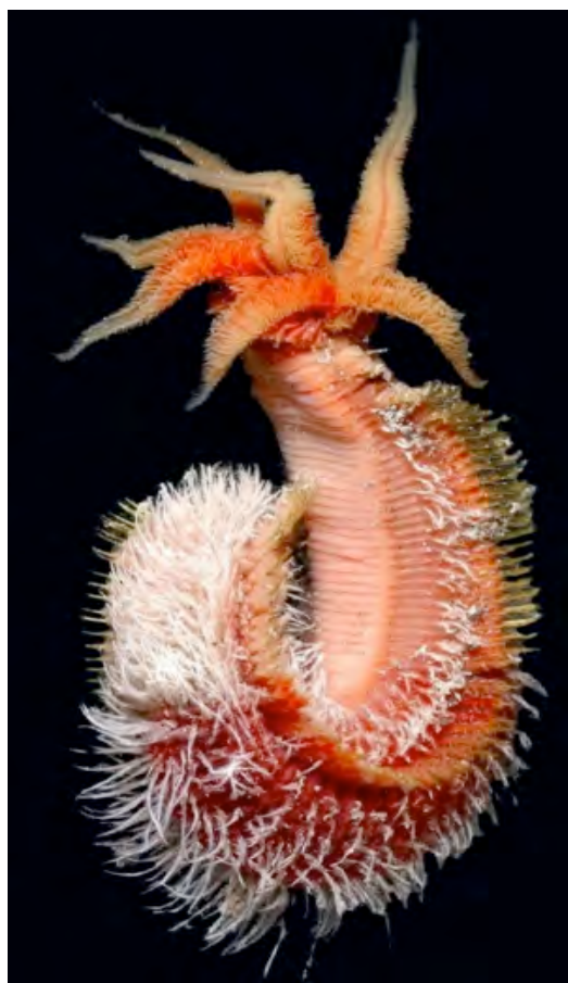
Figura 1. Alvinella pompejana Desbruyères & Laubier, 1980.

Alvinellidae son exclusivos de las ventilas hidrotermales del Océano Pacífico.