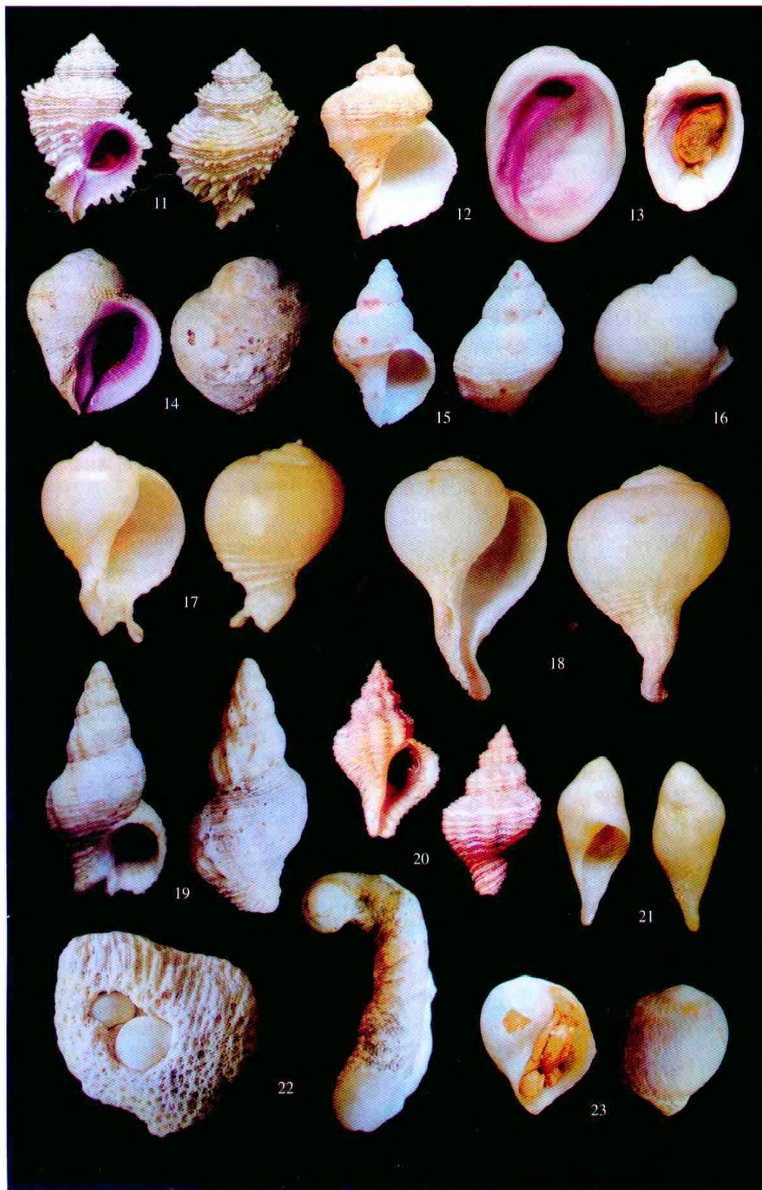
图 11~23 珊瑚螺科 13 种螺 (Thirteen species of the family Coralliophilidae)

11. 球形珊瑚螺 Coralliophila bulbiformis 12. 畸形珊瑚螺 Coralliophila erosa 13. 唇珊瑚螺 Coralliophila madraparava 14. 紫柄珊瑚螺 Coralliophila neritoides 15. 南海珊瑚螺, 新种 Coralliophila nanhaiensis sp. nov. 16. 芜菁螺 Rapa rapa 17. 曲芜菁螺 Rapa incurva 18. 球芜菁螺 Rapa bulbiformis 19. 纺锤珊瑚螺 Coralliophila costularis 20. 威氏珊瑚螺 Coralliophila wilsoni 21. 拉氏延管螺 Magilus lamarkii 22. 延管螺 Magilus antiquus 23. 薄壳延管螺 Magilus striatus