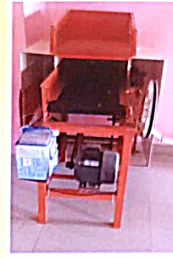
पाने बारीक करण्याचे यंत्र