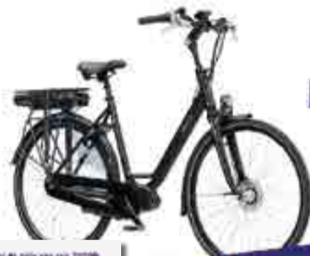
WAYZ E-GO® DELUXE