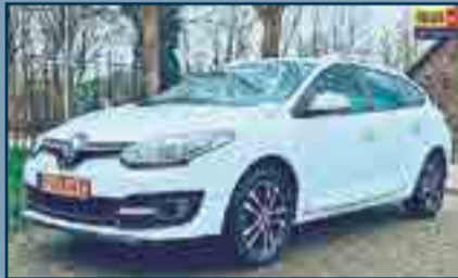
Renault Megane 1.5 dCi Expression NAVI/ AIRCO Bouwjaar: 2014 | Carrosserie: Stationwagen KM. Stand: 141.142 km | € 7.950,-

VOOR VERKOOP EN TOTAAL ONDERHOUD VAN UW AUTO