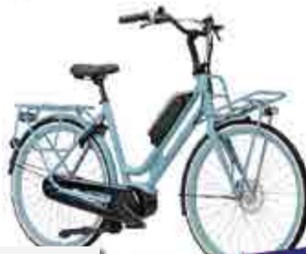
QUIP EXTRA CARGO E-GO®

Gratis gratis accu met voordeel tot wel €150,-