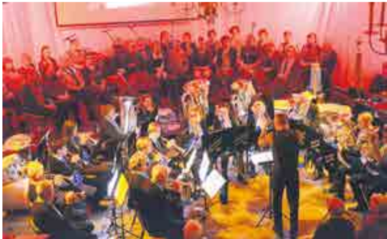
Tijdens het concert van Brassband Crescendo en Popkoor Break Out

Brassband Crescendo en Popkoor Break Out gaven voor de tweede maal een concert. De samenwerking van vorig jaar beviel beide verenigingen zodanig dat het schreeuwde om een vervolg. De belangstelling was groot en in de voorver-