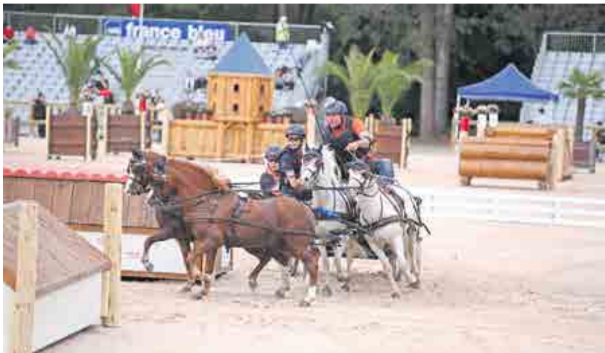
Wereldkampioen Jan de Boer: mannen met pony's

TEUGE.- Zondag 2 juni 2019 van 11.00 tot 17.00 uur vindt de Kunst- en Cultuurroute Teuge plaats. Nieuw dit jaar is het vierspan mannen met pony's door Jan de Boer. Jan is wereldkampioen mannen met pony's! Hij rijdt deze spectaculaire clinic om 12.00 uur en om 15.00 uur op het terrein naast het ontbijthotel, De Zanden 45-47.