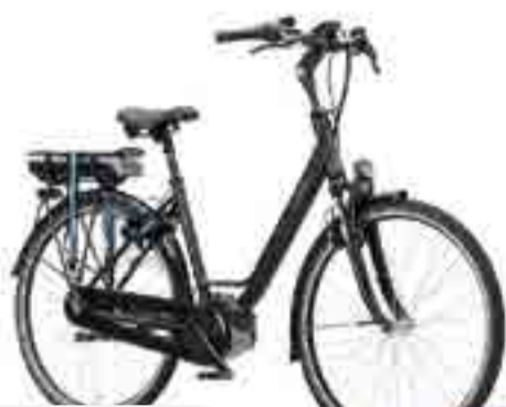
WAYZ E-GO® ACTIVE PLUS