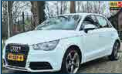
Audi A1 1.2 TFSI Attraction Pro Line Business NAVI/ AIRCO | Bouwjaar: 2012 | Carrosserie: Hatchback KM. Stand: 89.675 km | € 12.950,-