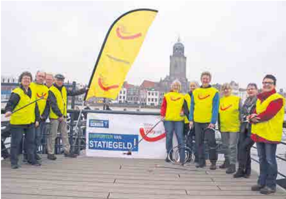
De actiegroep WorpWegWerp-vrij wil meer aandacht voor statiegeld op verpakkingen.

DE WORP.- In het kader van de landelijke opschoondag heeft een groep vrijwilligers afgelopen zaterdag de omgeving van de uiterwaarden bij de IJssel ontdaan van allerhande zwerfvuil. De werkgroep WorpWegWerp-vrij is ruim acht jaar geleden in het leven geroepen omdat enkele Worprenaren zich irriteerden aan de als maar groeiende stroom zwerfvuil. Vooral de rommel bij de IJsselstrandjes is een doorn in het oog. In de zomermaanden recreëren daar veel mensen en die nemen niet allemaal de lege verpakkingen en ander afval mee naar huis. Vanwege de hoge waterstand hebben de vrijwilligers de omgeving van het Worpplantsoen en de Bolwerksweg aangepakt. Dicht bij de IJssel kon men niet komen.