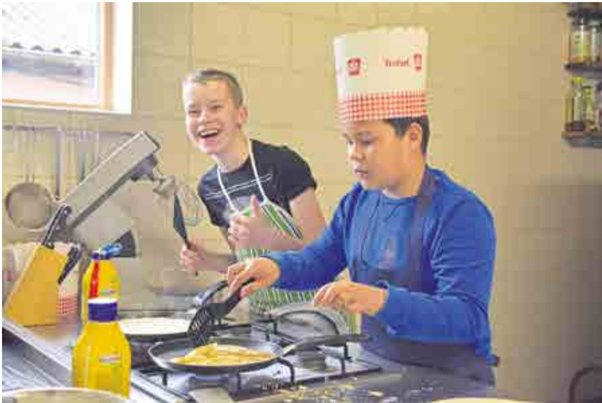
Leerlingen en ouders bakten samen 500 pannenkoeken

WILP-ACHTERHOEK. Leerlingen van de OBS Wilp-Achterhoek hebben afgelopen vrijdag meegedaan aan de Nationale Pannenkoekdag. Bij Kookstudio Den Hoek werden door de kinderen uit de groepen 7 en 8 stapels pannenkoeken gebakken. In totaal waren er wel 500 stuks.