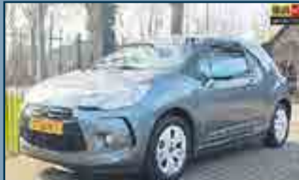
Citroen DS3 1.4 Chic AIRCO | Bouwjaar: 2010 | Carrosserie: Hatchback KM. Stand: 122.227 km | € 5.950,-