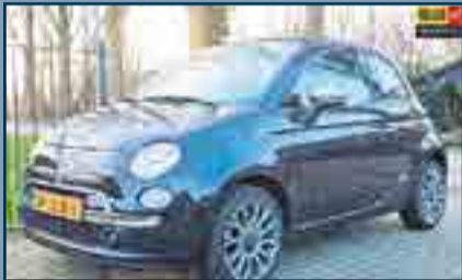
Fiat 500 1.2 CABRIO AIRCO/ NAVI Bouwjaar: 2010 | Carrosserie: Cabriolet KM. Stand: 90.825 km | € 7.950,-