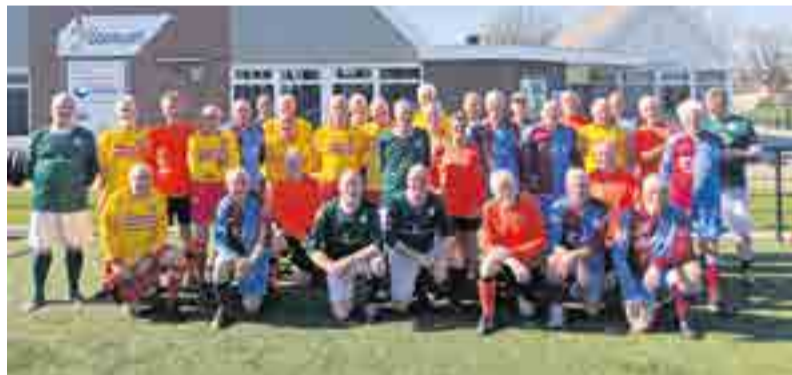
Samen voetballen op een mooie zonnige vrijdagmiddag

De organisatie en deelnemers kijken terug op een succesvolle en vooral gezellige middag, mede dankzij de gastvrijheid van SV Voorwaarts. Het toernooi krijgt volgend jaar dan ook zeker een vervolg. Een keer meedoen met een training, iedere vrijdag van 13:30 tot 14:30 uur op sportpark De Laene, of wil je meer weten over het voetbalspel? Kom gerust langs of mail naar buurtsportcoachsvvoorwaarts@outlook.com