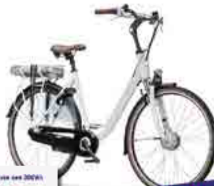
WAYZ E-GO® COMFORT

Gratis gratis accu met voordeel tot wel €150,-