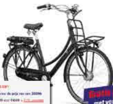
CNCTD E-GO® / CNCTD E-GO® SMART

Gratis gratis accu met voordeel tot wel €150,-