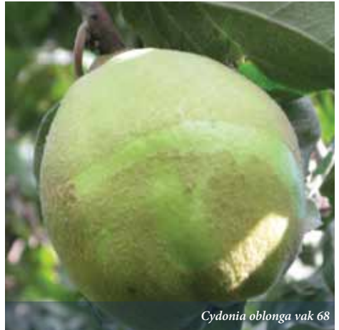
Cydonia oblonga vak 68