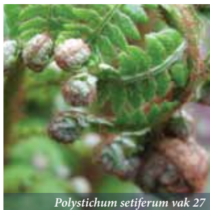
Polystichum setiferum vak 27