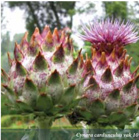
Cynara cardunculus vak 10