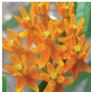
Asclepias tuberosa vak 70