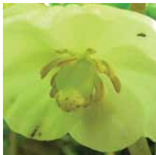
Podophyllum peltatum vak 30