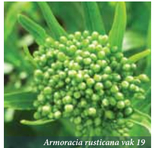
Armoracia rusticana vak 19