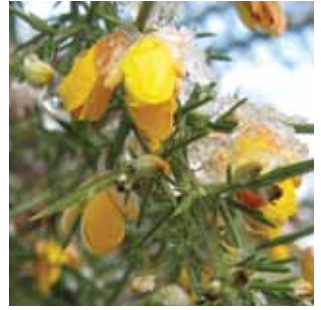
Ulex europaeus vak 56