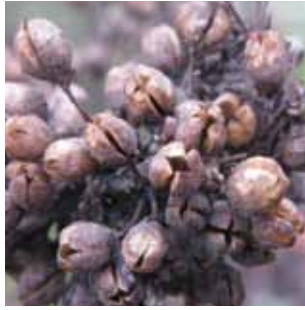
Verbascum nigrum vak 50