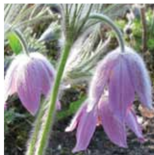
Pulsatilla vulgaris vak 44