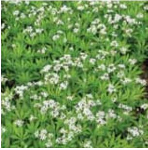
Galium odoratum vak 48