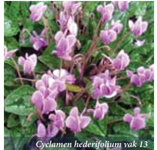
Cyclamen hederifolium vak 13