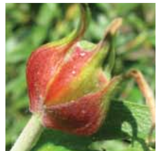
Cistus laurifolius vak 71