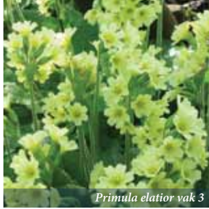
Primula elatior vak 3