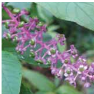
Phytolacca americana vak 31