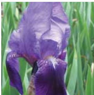
Iris germanica vak 70