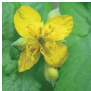
Chelidonium majus vak 56