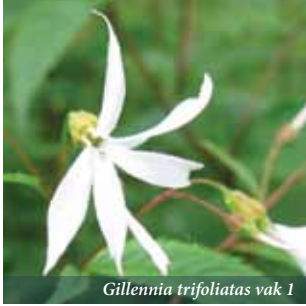
Gillenya trifoliata vak 1

Ribesfam./Grossulariaceae Kaasjeskruidfam./Malvaceae Composietenfam./Asteraceae Kruisbloemfam./Brassicaceae Composietenfam./Asteraceae