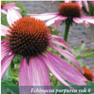
Echinacea purpurea vak 8