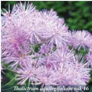
Thalictrum aquilegifolium vak 16