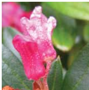
Rhododendron ferrugineum vak 40