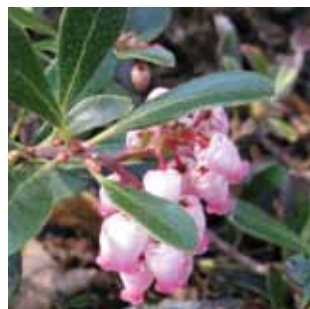
Arctostaphylos uva-ursi vak 40