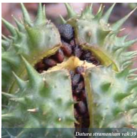
Datura stramonium vak 39