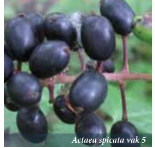
Actaea spicata vak 5