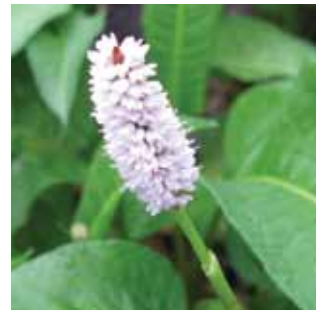
Persicaria bistorta vak 68