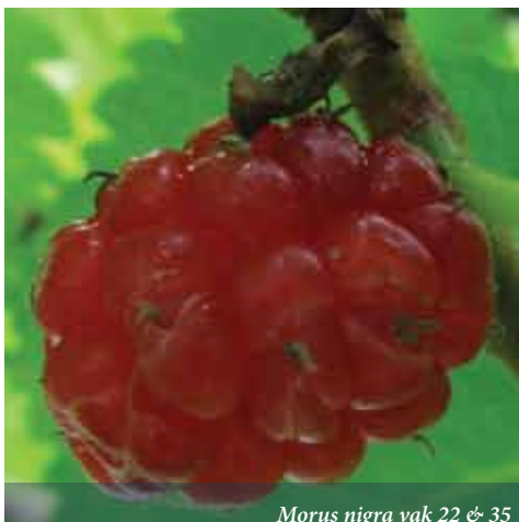
Morus nigra vak 22 & 51