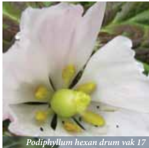
Podophyllum hexan drum vak 17