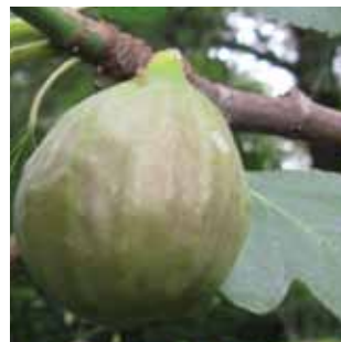
Ficus carica vak 55