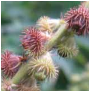
Agrimonia eupatoria vak 66