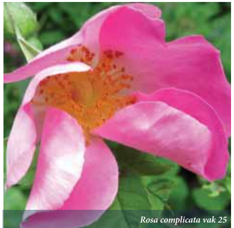
Rosa complicata vak 25