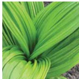
Veratrum nigrum vak 37