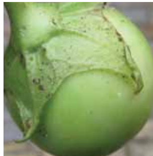
Mandragora officinarum vak 67