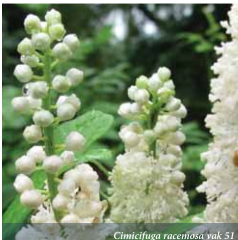
Cimicifuga racemosa vak 51