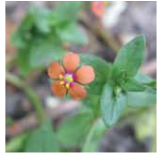
Anagallis arvensis vak 62