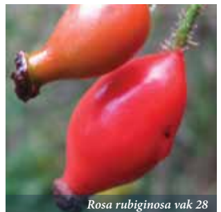
Rosa rubiginosa vak 28