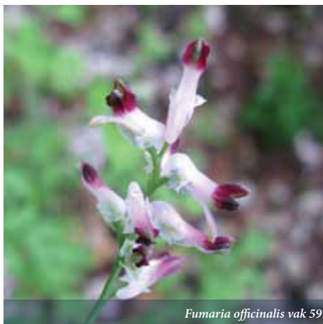
Fumaria officinalis vak 59