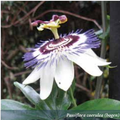
Passiflora caerulea (bogen)