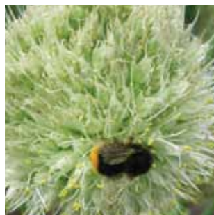
Allium fistulosum vak 43