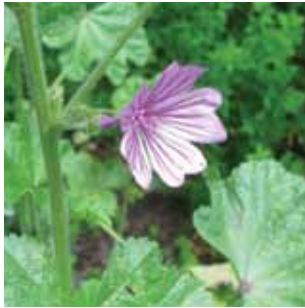
Malva sylvestris vak 56