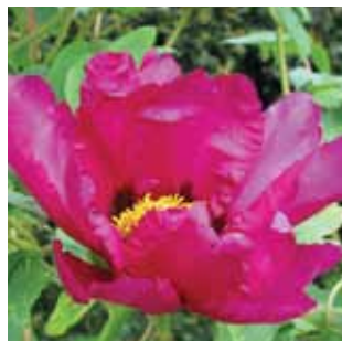
Paeonia suffruticosa vak 46

Gagelfam./Myricaceae Lissenfam./Iridaceae Kattestaartfam./Lythraceae Ranonkelfam./Ranunculaceae Lipbloemfam./Lamiaceae Lipbloemfam./Lamiaceae