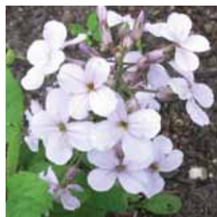
Hesperis matronalis vak 34