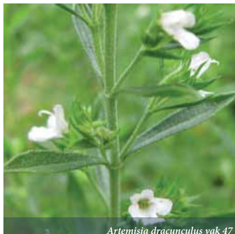
Artemisia dracunculus vak 47