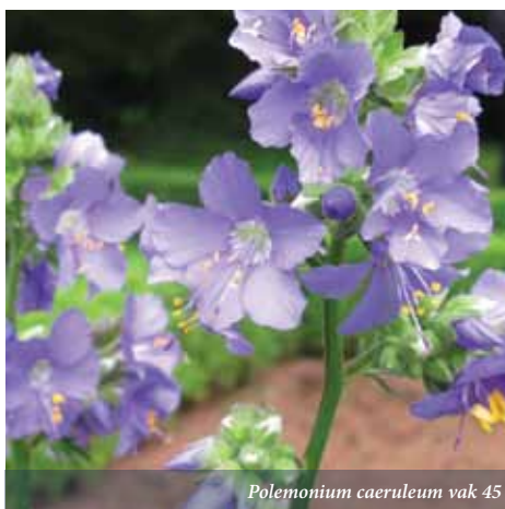
Polemonium caeruleum vak 45