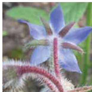
Borago officinalis vak 44