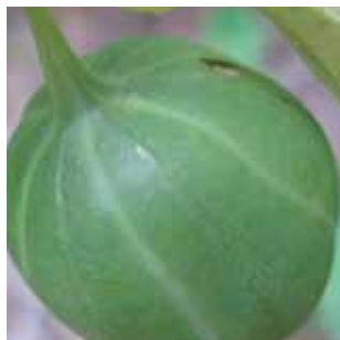
Aristolochia clematitis vak 34