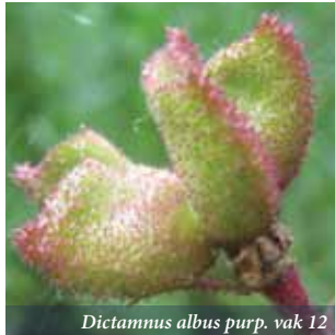
Dictamnus albus purp. vak 12