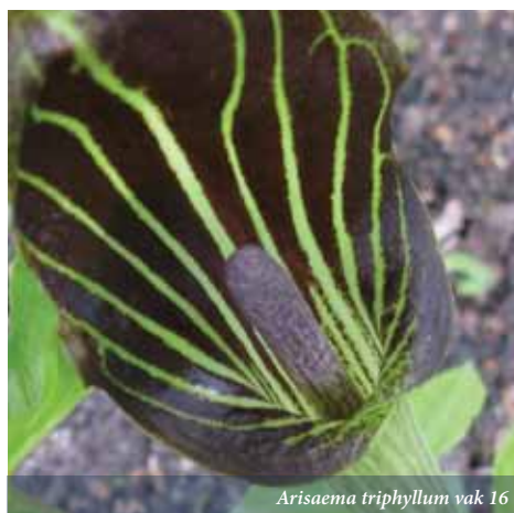
Arisaema triphyllum vak 16