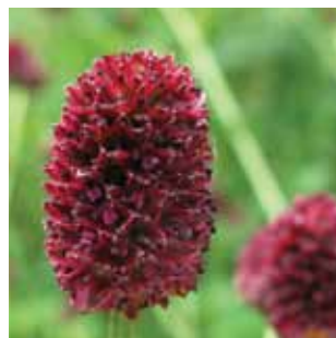
Sanguisorba officinalis vak 46