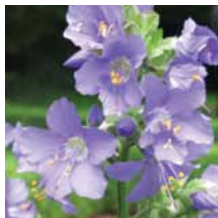
Polemonium caeruleum vak 45