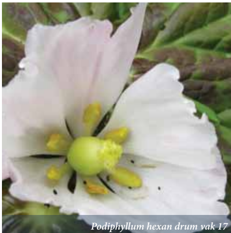
Podiphyllum hexan drum vak 17