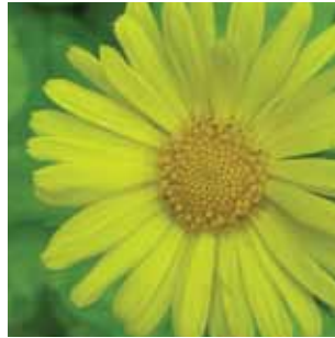
Doronicum pardalianches vak 60