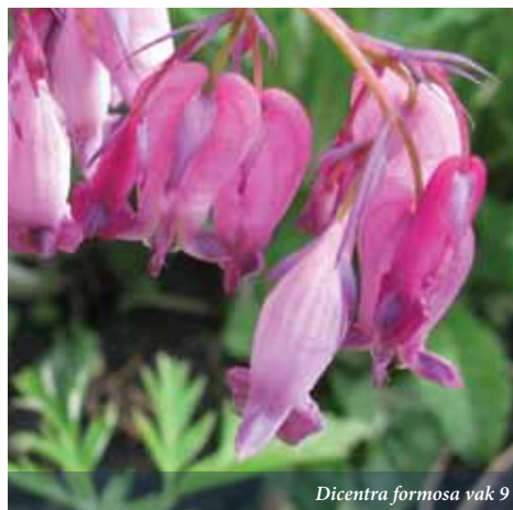
Dicentra formosa vak 9