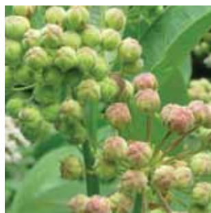
Asclepias syriacus vak 34