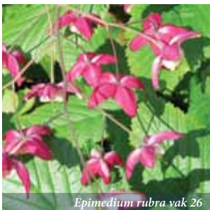
Epimedium rubra vak 26