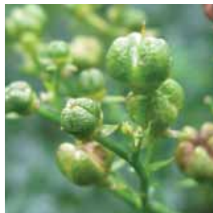
Ruta graveolens vak 70

Acanthaceae Rozenfam./Rosaceae Rozenfam./Rosaceae