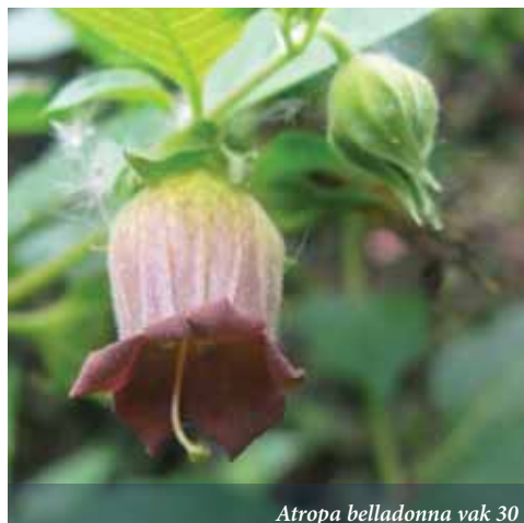
Atropa belladonna vak 30