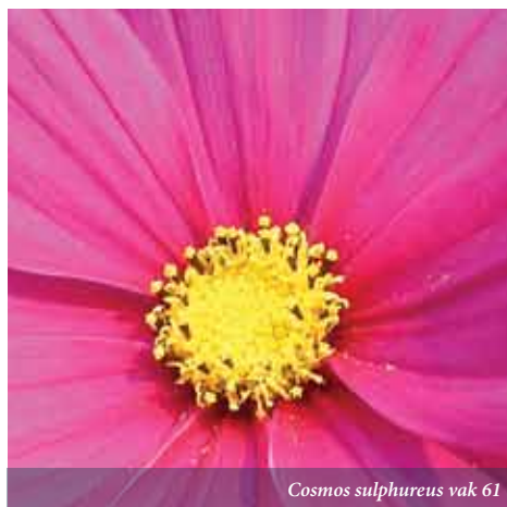
Cosmos sulphureus vak 61