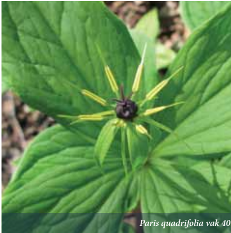
Paris quadrifolia vak 40