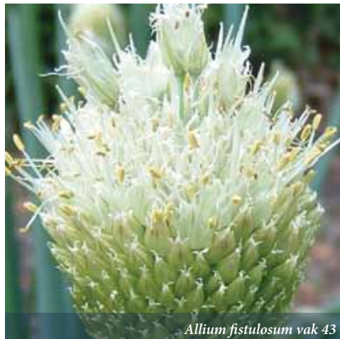
Allium fistulosum vak 43