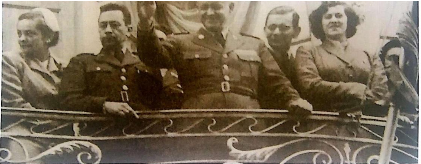
En mayo de 1957, tras numerosas huelgas y protestas, el general Rojas Pinilla cedió el poder a una Junta Militar.

El Frente Nacional fue un acuerdo entre los partidos tradicionales de Colombia: el Liberal y el Conservador, como una forma de salir de la terrible violencia que azotaba al país desde finales de los años cuarenta. Para 1957 el general Rojas debió renunciar a su cargo tras algunos escándalos que involucraron al Ejército Nacional y a los organismos de seguridad. Tras la caída del general se estableció una Junta Militar que gobernó entre mayo de 1957 y agosto de 1958; durante este periodo, los partidos propusieron un plebiscito (1 de diciembre de 1957) para que los colombianos votaran a favor del Frente Nacional, una fórmula en la que durante los próximos 16 años, los dos partidos alternarían la presidencia y se repartirían los puestos públicos, incluyendo ministerios y gobernaciones. Con ocasión del plebiscito, 4'169.294 personas votaron a favor de esta forma de gobernar al país.