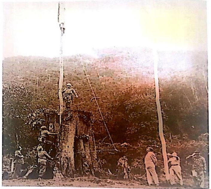
Los gobiernos del Frente Nacional llevaron a cabo ofensivas militares para recuperar los territorios que se encontraban bajo el control de las guerrillas, especialmente en Huila y Tolima.