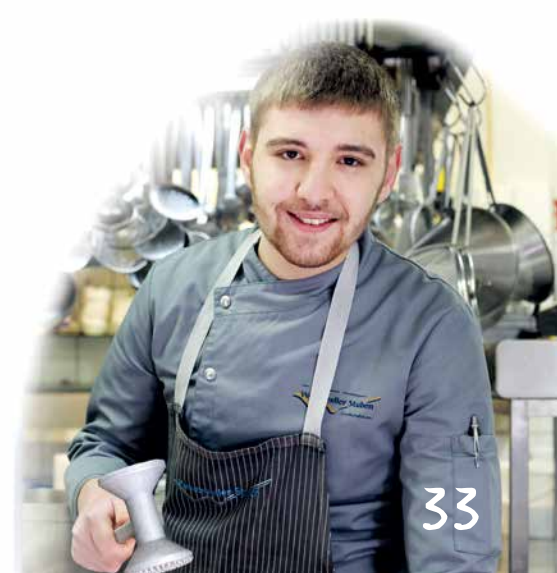
Mersin, Auszubildender als Koch.

Weitere Gerichte wie Matjes, Pilze und Wild werden je nach saison angeboten.