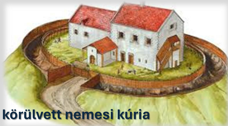
Fallal körülvett nemesi kúria

A kereskedők harmincadvámot fizettek. Ez azt jelentette, hogy árujuk értékének egyharmincadrészét be kellett fizetniük a kincstárba, ha be vagy kiléptek az országból.