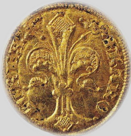
Károly aranyforintja az anjouk jelképével a liliommal

A bányászok a kitermelt nemesfém mennyisége szerint bányabért fizettek a királynak.