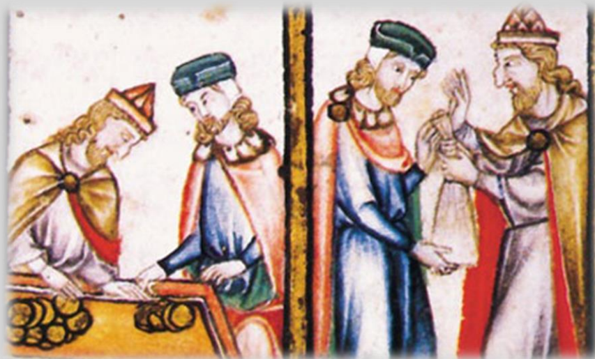
A harmincadvám ábrázolása egy korabeli képen

A kereskedők harmincadvámot fizettek. Ez azt jelentette, hogy árujuk értékének egyharmincadrészét be kellett fizetniük a kincstárba, ha be vagy kiléptek az országból.