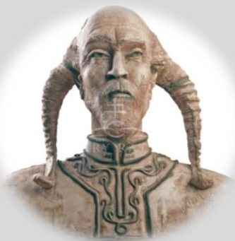
Aba Amadé (1240–1311)

A királyi adományok megnövelték birtokaikat.