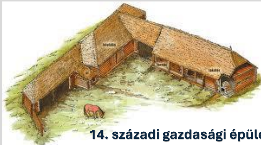
14. századi gazdasági épület

Ezt azok a jobbágyháztartások fizették, amelyeknek akkora kapuja volt, hogy egy szénásszekér átfért rajta.