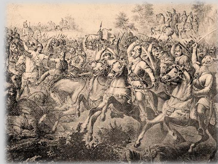
A Rozgonyi csatában Károlynak az Abák hatalmát törte meg

Ez egyben hadtörténeti „újdonság” is, mert először fordult elő, hogy a városi polgárság megsegítette az uralkodót.