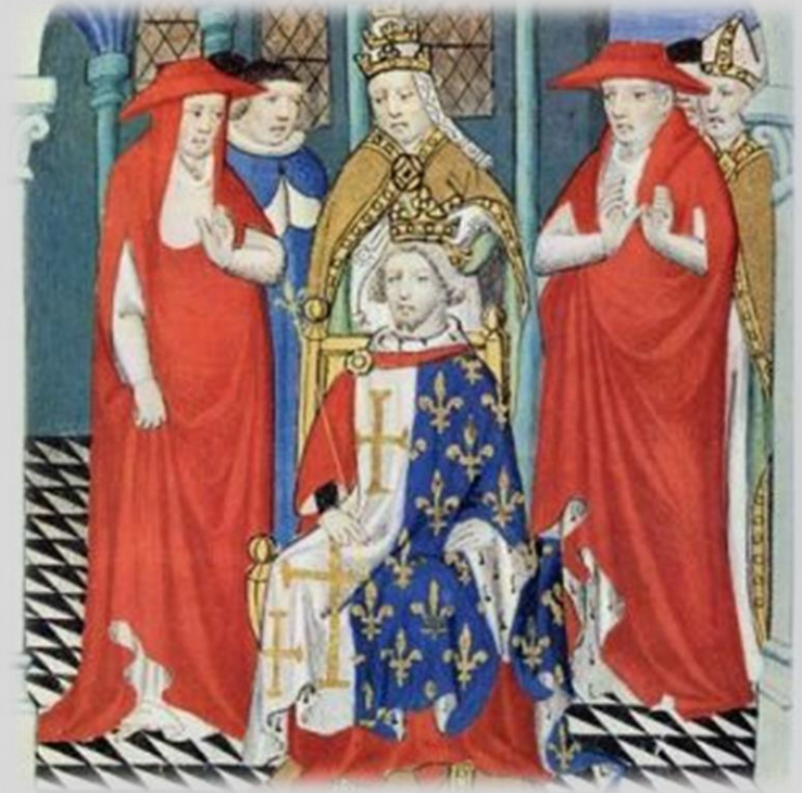
I. Károly „egyik” koronázása

A királyra esküt tevők között nem jelentek meg a leghatalmasabb főurak.