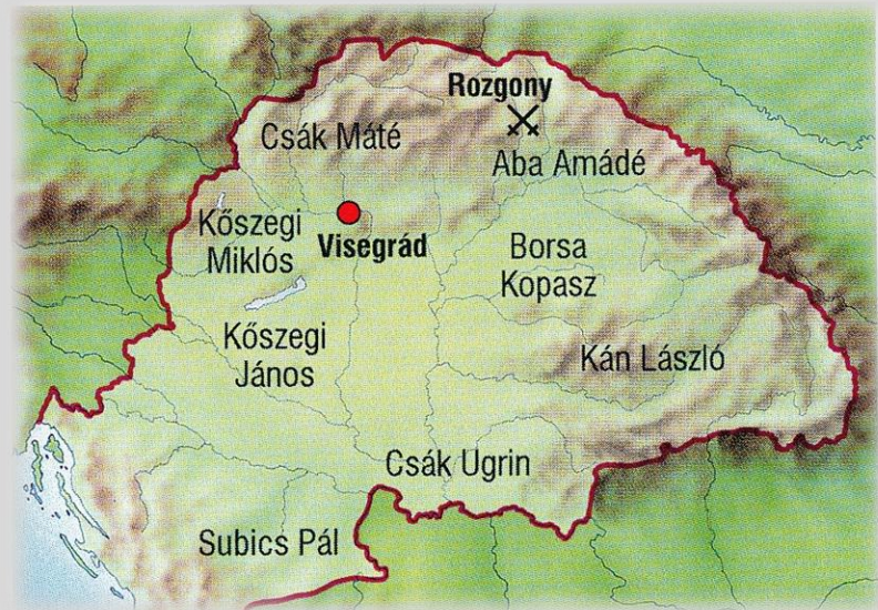
Magyarország Károly uralkodásának idején a legjelentősebb tartományurak területei

Károly a tartomány urak legyőzése után a királyság gazdasági ügyeivel foglalkozott. A kincstár bevételeit akarta növelni, ugyanis a királyi birtokok eladományozásával ezek csökkentek. Ekkoriban Magyarország bányái adták ezüsből a világtermelés negyedét, aranyból pedig a harmadát.