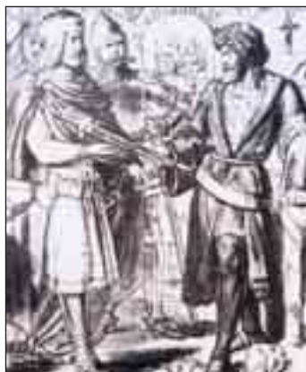
Die Verhaftung Richards in Erdberg, unbekannter Stich aus dem 19. Jhd.

König Richard Löwenherz, der sich seit dem Schiffbruch von Leopolds Vasallen umge-