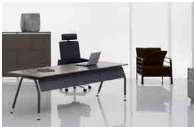
Ein neues Büro in 9 Werktagen

Blaha Büro Ideen Zentrum. Büro-Ideen sehen und erleben auf 3.500m 2 , Klein-Engersdorfer Str. 100, A-2100 Korneuburg, Mo - Fr 8-18 Uhr, Sa 9-14 Uhr. Tel: +43-2262-725 05-0, www.blaha.co.at