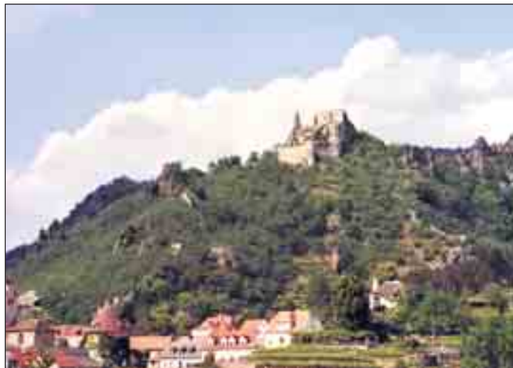
Ruine Dürnstein hoch über der gleichnamigen Stadt an der Donau.