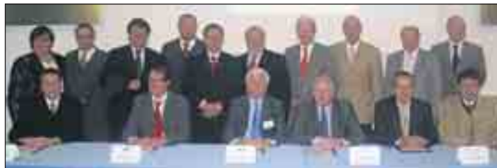
Geschäftsführer und Veranstalter des Tages der Industrie in Ternitz mit Ehrengästen.

Die Firma Schoeller-Bleckmann Edelstahlrohr GmbH stellt nahtlose Edelstahlrohre für die Chemie, Petrochemie, Pharmaindustrie sowie für Kraftwerke, Maschinenbau und Industrieöfen her. Schoeller Bleckmann Nooter ist auf die Herstellung von Hochdruck- Wärmetauschern und Reaktoren für die Düngemittelindustrie spezialisiert und hat sich in den letzten Jahren zum Weltmarktführer in diesem Bereich entwickelt. Die Franz Kirnbauer KG bietet in den