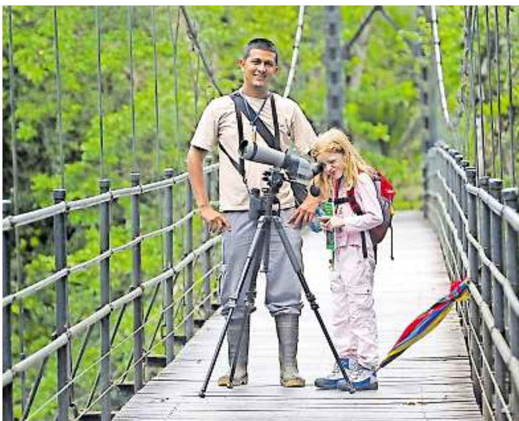
Bunte Pflanzen und Tiere, rauchende Vulkane und viel Dschungel: In den 40 Nationalparks von Costa Rica gibt es viel zu entdecken.