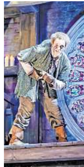
Musical-Fans wird zum Jahresende und in 2019 viel geboten.

Mit der Hamburg Card können Gäste die öffentlichen Verkehrsmittel nutzen und bekommen viele Vergünstigungen, etwa auf Hafen-, Alster-