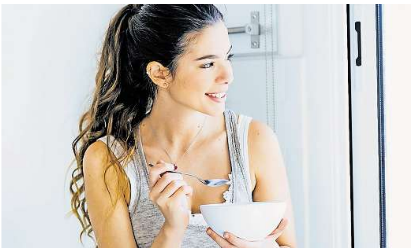
Basisch in den Tag: Ein Frühstück aus Getreideflocken macht satt und wirkt entsäuernd.

Beim Basenfasten geht es darum, das Gleichgewicht von Säuren und Basen im Körper wiederherzustellen. Dieses ist bei den meisten von uns aus dem Takt, unter anderem, weil viele Lebensmittel, darunter Fleisch und andere tierische Produkte, Zucker, weißes Mehl, Kaffee oder Softdrinks überwiegend saure Stoffwechselprodukte bilden, die nur teilweise ausgeschieden werden können. Den Überschuss deponiert der Körper als Schlacken im Gewebe. „Aus naturheilkundlicher Sicht wirken sie dort wie Blockaden auf Stoffwechsel und Selbstheilungs-