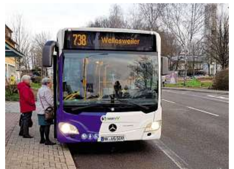
Bequem zum Einkauf fahren