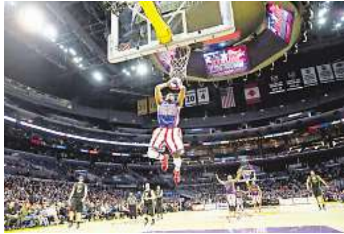
Die Harlem Globetrotters begeistern seit vielen Jahren ihre Fans in den größten Hallen dieser Welt.

Karten gibt es an allen bekannten Vorverkaufsstellen, u.a. in allen WOHENSPIEGEL- und DIE WOCH-Verlagsbüros saarlandweit und unter www.WochenspiegelOnline.de/tickets . Der WOHENSPIEGEL verlost 10 x 2 Karten für die Basketball-Show der Harlem Globetrotters am 27. März in der