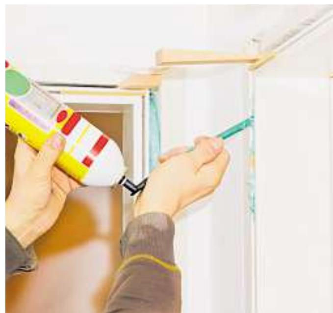
Punktuell soll der Hohlraum zur Wand mit speziellem Montagekleber gefüllt werden.

Beachten Sie: Stellen Sie die Zarge frei mit Luft oben und zu beiden Seiten (etwa je 1-2 cm) ein. Falls noch Gipsreste oder Ähnliches in der Maueröffnung stören, schlagen Sie diese mit Hammer und Meißel ab. Stecken Sie die Türbänder (Scharniere) in die vorgebohrten Löcher in der Zarge und ziehen die Inbusschrauben von der Seite fest. Befestigen Sie ebenfalls die türseitigen Scharniere. Nun können Sie das Türblatt probeweise einsetzen und prüfen, ob die Tür auch einwandfrei schließt. Letzte