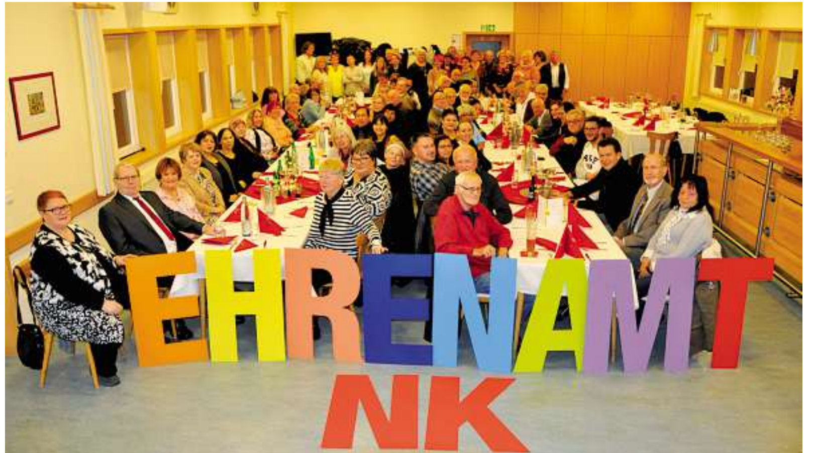
Engagement für unsere Stadt: Tendenz steigend