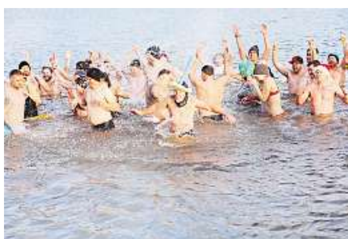
Der Spaß steht beim Eisschwimmen im Itzenplitzer Weiher natürlich wieder im Vordergrund.

stehen. Die Ki-Ka-Ju Merchweiler sorgt für Glühwein und Würstchen und der Angelverein Heiligenwald sowie die umliegende Gastronomie freuen sich über Besucher. Der Eintritt ist wie üblich frei, die Merchweiler Seelöwen und auch einige Mitglieder des Wünschewagen-Teams des ASB werden mit Sammeldosen um eine freiwillige Spende bitten. red./eck