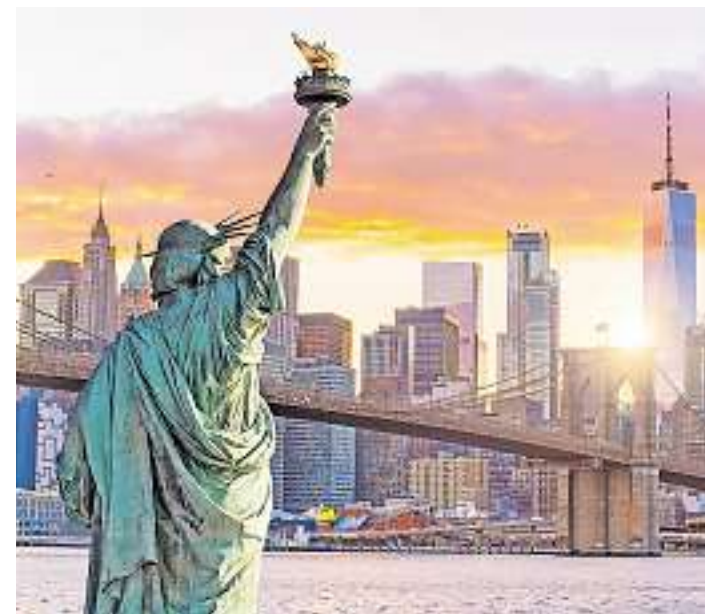
Vier Reiseziele, die während des Vortragsprogrammes vorgestellt und im Rahmen der Messe auch gleich gebucht werden können: Dubai (links oben/Foto: Oleg Zhukov – stock.adobe.com), Sardinien (rechts oben/Foto: ferkelraggae – stock.adobe.com), Kenia (links unten/Foto: Oleg Znamenskiy – stock.adobe.com) und New York (rechts unten/Foto: ff1photo – stock.adobe.com).

TÄGLICH AKTUELL Hier werben Sie wirksam! www.WochenspiegelOnline.de