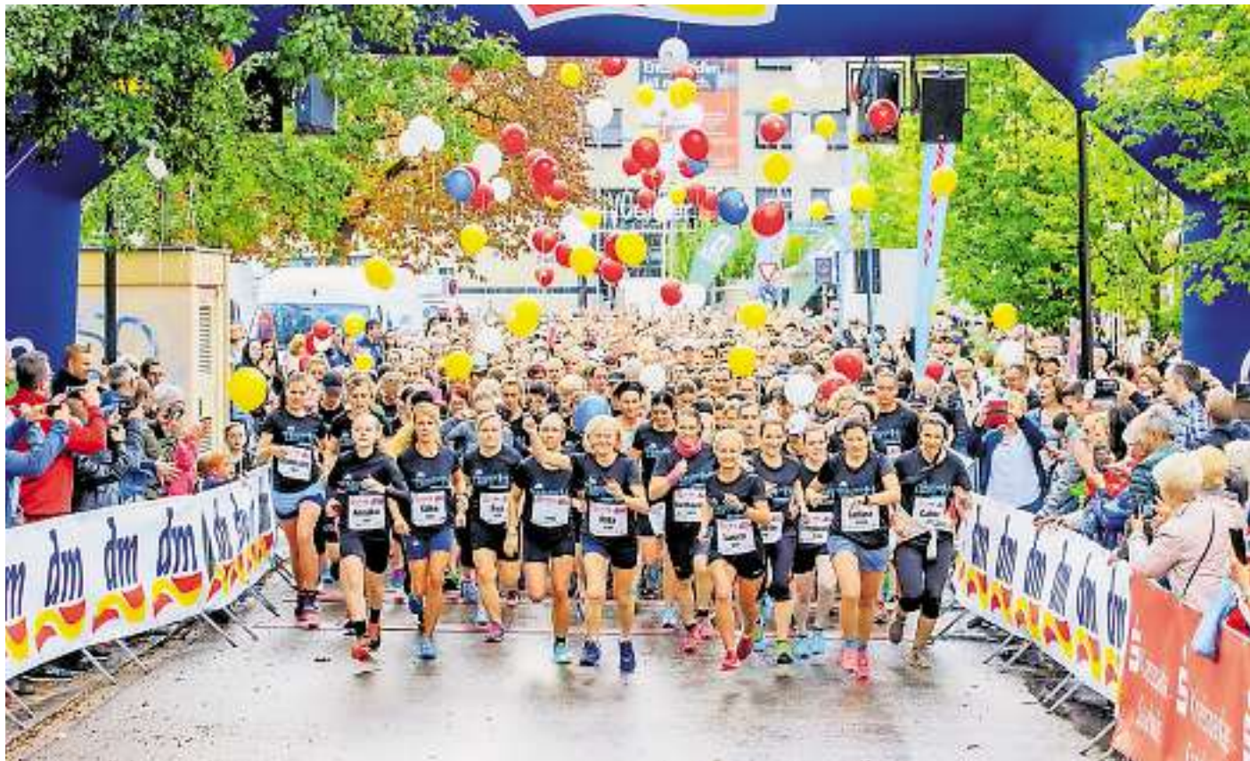
Am Freitag, 6. September, geht der dm Frauenlauf SaarLorLux in seine siebte Runde.

Erneut haben Strohballen gebrannt. Die Polizei vermutet Brandstiftung – diesmal bei Ittersdorf