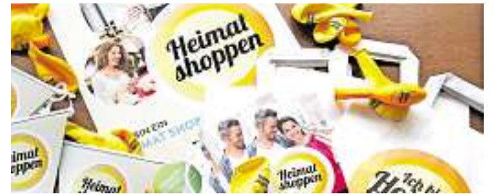
Saarouis Geschäfte machen wieder mit bei der Aktion Heimat shoppen.

frauenlauf-saarlorlux.de). Nachmeldungen sind am Dienstag, 3. September, 13 bis 18 Uhr bei der Startunterlagenausgabe von und am Veranstaltungstag von 14 bis 17.30 Uhr auf dem Kleinen Markt möglich. Im Startgeld enthalten sind ein Funktions-Shirt, ein Überraschungspaket sowie Strecken- und Zielpflege. Doch wer denkt das wäre bereits alles, der hat sich getäuscht. Neben dem sportlichen Event wartet abseits der Strecke ein buntes Programm auf alle Frauenlauf-Begeisterte. Bereits vor dem Start erwartet die Läuferinnen ein professionelles Warm-Up auf der Bühne. Während die Muttis fleißig ihre Kilometer meistern, ist für die Kleinen mit einer Kinderbetreuung gesorgt. Für die Männer und Begleiter der Damen wurde mit der „Männer-Wartzone“ vorgesorgt. Dort können die Herren der Schöpfung bei Dart und „Kofferraum-Schießen“ austoben. Nach dem Lauf wird gemeinsam gefeiert. Die Live-Band „Tonsport“ sorgt für gute und ausgelassene Stimmung, zudem kümmern sich vor Ort wieder zahlreiche Cateringstände um das leibliche Wohl. Der 7. dm Frauenlauf SaarLorLux bietet wieder ein buntes und abwechslungsreiches Programm und ist damit perfekt, um das Wochenende einzuleiten. Info: www.frauenlauf-saarlorlux.de oder auf der Facebook-Fanpage.