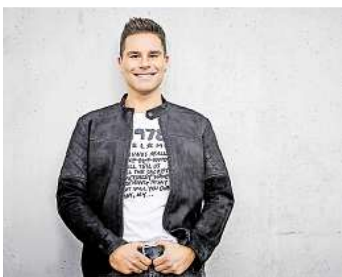
Eloy de Jong hat den Soundtrack zum Jahrhundertsommer definiert.