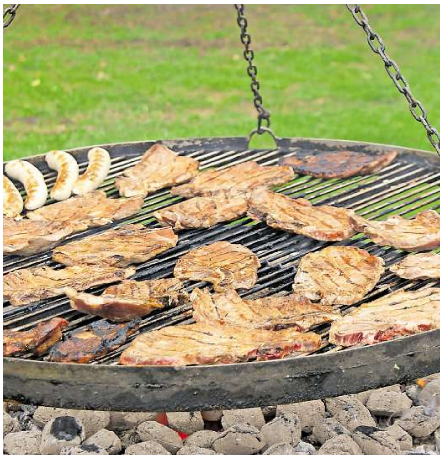
Die Europäische Schwenkermeisterschaft wird in Berus ausgetragen.

Globus SB-Warenhaus Holding GmbH & Co. KG, Leipziger Str. 8, 66606 St. Wendel, Betriebsstätte Saarlouis