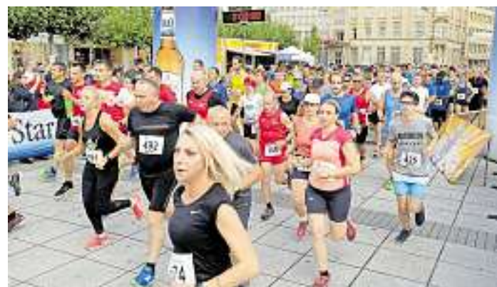
An Mariä Himmelfahrt, 15. August, wird der 23. Altstadtlauf des LAC Saarouis gestartet.