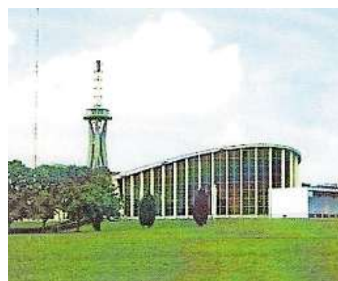
Auf dem Gelände der ehemaligen Sendeanlagen wird gefeiert.

Mitmachzirkus, Artistikshow und Kinderschminken starten zur Mittagszeit. Um 15 Uhr tritt der XXL Kinderchor unter Leitung von Marita Grasmück auf. Zum Ende des Feiertags gibt's ab 19 Uhr Livemusik.