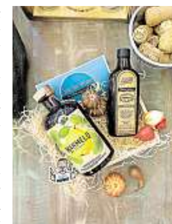
Marmelo ist ein saarländischer Quittenbrand.

Exemplare der limitierten Serie. Jede Flasche wird von Hand gefüllt, etikettiert, versiegelt und nummeriert. Der WOCHENSPIEGEL verlost online jeweils zwei Flaschen Marmelo Quittenbrand und Marmelo-Likör. Alle Infos und Teilnahmebedingungen unter www.wochenspiegelonline.de/