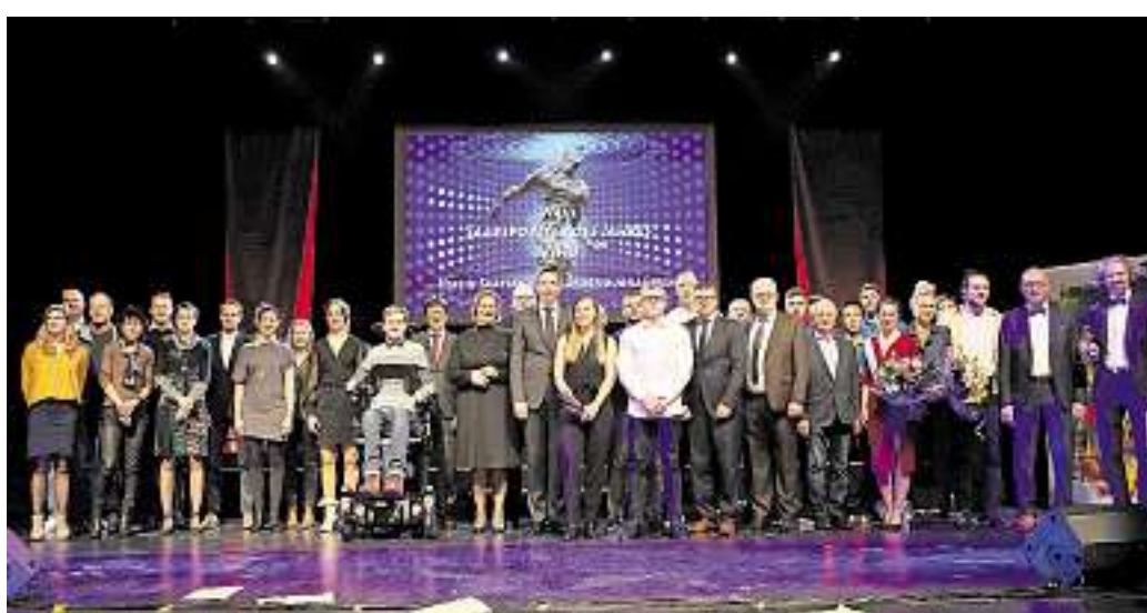
Im Rahmen einer Gala im Theater am Ring werden die Saarsportler 2022 gekürt. Hier ein Archivfoto aus dem Jahr 2019.