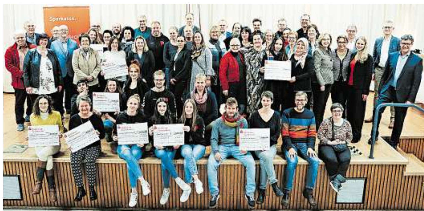
Ehrung der Gewinner*innen beim Vereinspreis 2022 der Sparkasse Saarbrücken.

Prämierung beim Wettbewerb der Sparkasse Saarbrücken – Niemand ging leer aus