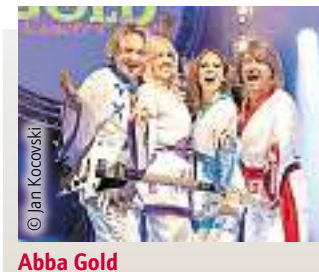
Abba Gold The Concerts Show Live Do., 29. Dezember 2022, 20.00 Uhr Saarlouis, Saarlandhalle Fr., 27. Januar 2023, 20.00 Uhr Merzig, Stadthalle