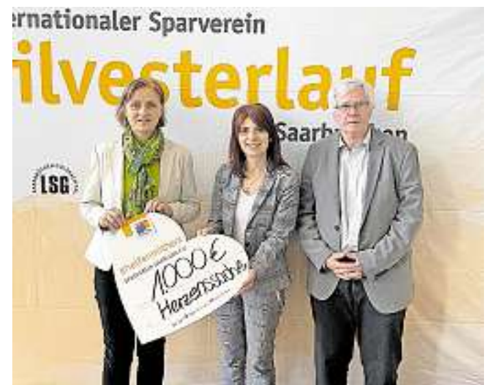
Im Rahmen der Pressekonferenz wurde eine Spende über 1000 Euro an die Aktion Herzenssache übergeben. Foto: Florian Beck / Sparverein

Der Silvesterlauf führt traditionell durch den Stadtwald und über eine Streckenverlängerung über das Universitätsgelände. Der Silvesterlauf führt traditionell durch den Stadtwald und über eine Streckenverlängerung über das Universitätsgelände. Voranmeldungen sind bis zum 23. Dezember möglich auf der Internetseite der LSG Saarbrücken-Sulzbachtal oder unter www.meisterchip.de, digitale Nachmeldungen am Freitag, 30. Dezember, zwischen 15 und 18 Uhr sowie am Veranstaltungstag ab 11 Uhr. Entsprechende Nachmeldegebühren