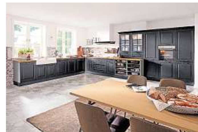
Die schwarzen Fronten verleihen der Landhausküche eine frische und moderne Optik.