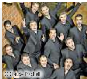
The 12 Tenors – Power of 12 Di., 24. Januar 2023, 20.00 Uhr Saarlouis, Theater am Ring Mi., 25. Januar 2023, 20.00 Uhr St. Ingbert, Stadthalle