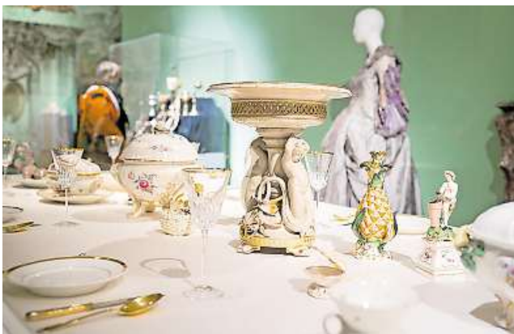
Ausstellungsansicht „Zu Tisch! Die Kunst des guten Geschmacks“, Saarlandmuseum – Alte Sammlung.