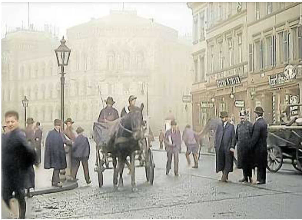
Straßenszene vor der Bergwerksdirektion.

Saarbrücken. Nur noch bis zum 6. Januar besteht die Möglichkeit, das Werk „Ankunft König Wilhelms I. in Saarbrücken“ (1880) des Historienmalers Anton von Werner als digitales Kunstobjekt über die Plattform für kuratierte NFT-Kunst NIF-TEE in limitierter Auflage zu erwerben. Ein Teil des Erlöses wird verwendet, um deutschen und französischen Schulklassen den Besuch im Historischen Museum Saar zu ermöglichen. Link: www.historisches-museum.org red./tt