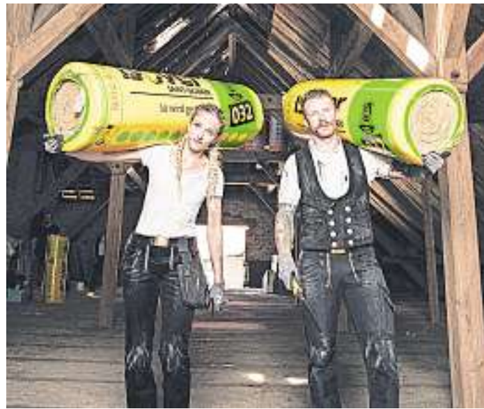
Eine effiziente Dämmung der Gebäudehülle sorgt nicht nur für behagliche Wohnräume, sondern hält auch die Nebenkosten im Zaum. Und durch die eingesparten Energiekosten amortisiert sich das Ganze schon nach kurzer Zeit.

Zum Schluss schrauben Sie die Pergola-Reiter auf die Pfetten. Diese sehen gut aus und dienen Pflanzen darüber hinaus als Rankhilfe. Das Tor befestigen Sie mit drei von außen aufgeschraubten Scharnieren. Als Verschluss verwenden Sie einen einfachen zweiteiligen Schiebe-Riegel. red./jb