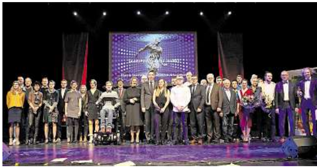
Im Rahmen einer Gala im Theater am Ring werden die Saarsportler 2022 gekürt. Hier ein Archivfoto aus dem Jahr 2019.