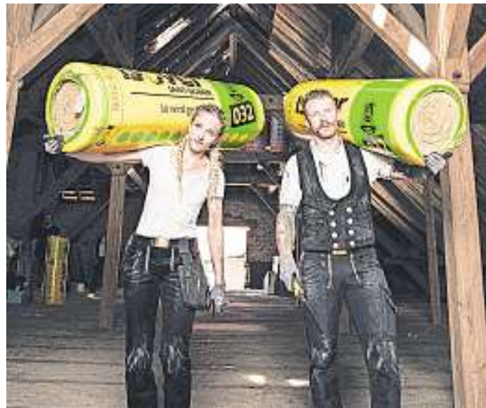
Eine effiziente Dämmung der Gebäudehülle sorgt nicht nur für behagliche Wohnräume, sondern hält auch die Nebenkosten im Zaum. Und durch die eingesparten Energiekosten amortisiert sich das Ganze schon nach kurzer Zeit.

Zum Schluss schrauben Sie die Pergola-Reiter auf die Pfetten. Diese sehen gut aus und dienen Pflanzen darüber hinaus als Rankhilfe. Das Tor befestigen Sie mit drei von außen aufgeschraubten Scharnieren. Als Verschluss verwenden Sie einen einfachen zweiteiligen Schiebe-Riegel. red./jb