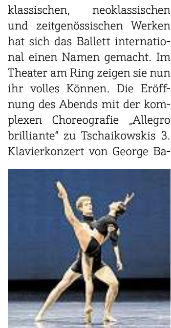
Das Bayrische Juniorballett präsentiert am 21. Dezember ein aufregendes Programm im Theater am Ring.

SaarLouis. Am Mittwoch, 21. Dezember, um 20 Uhr (Einlass ist um 19 Uhr) findet im Rahmen des Theater Abonnements im Theater am Ring eine Aufführung des Bayrischen Juniorballetts statt. Der Abend verspricht hochkarätiges Ballett zu Stücken von Tschairowsky, Beethoven, Ravel, Rachmaninov und Gross. Seit zehn Jahren bietet das Bayerische Junior Ballett München jeweils 16 internationalen jungen Tänzerinnen und Tänzern für zwei Jahre die Möglichkeit, sich nach Abschluss ihres Studiums in einem geschützten Rahmen zu professionellen Künstlern zu entwickeln. Dabei dient das Ballett regelmäßig als Karrieresprungbrett aufstrebender Talente. Mit ihrem einzigartigen Repertoire aus