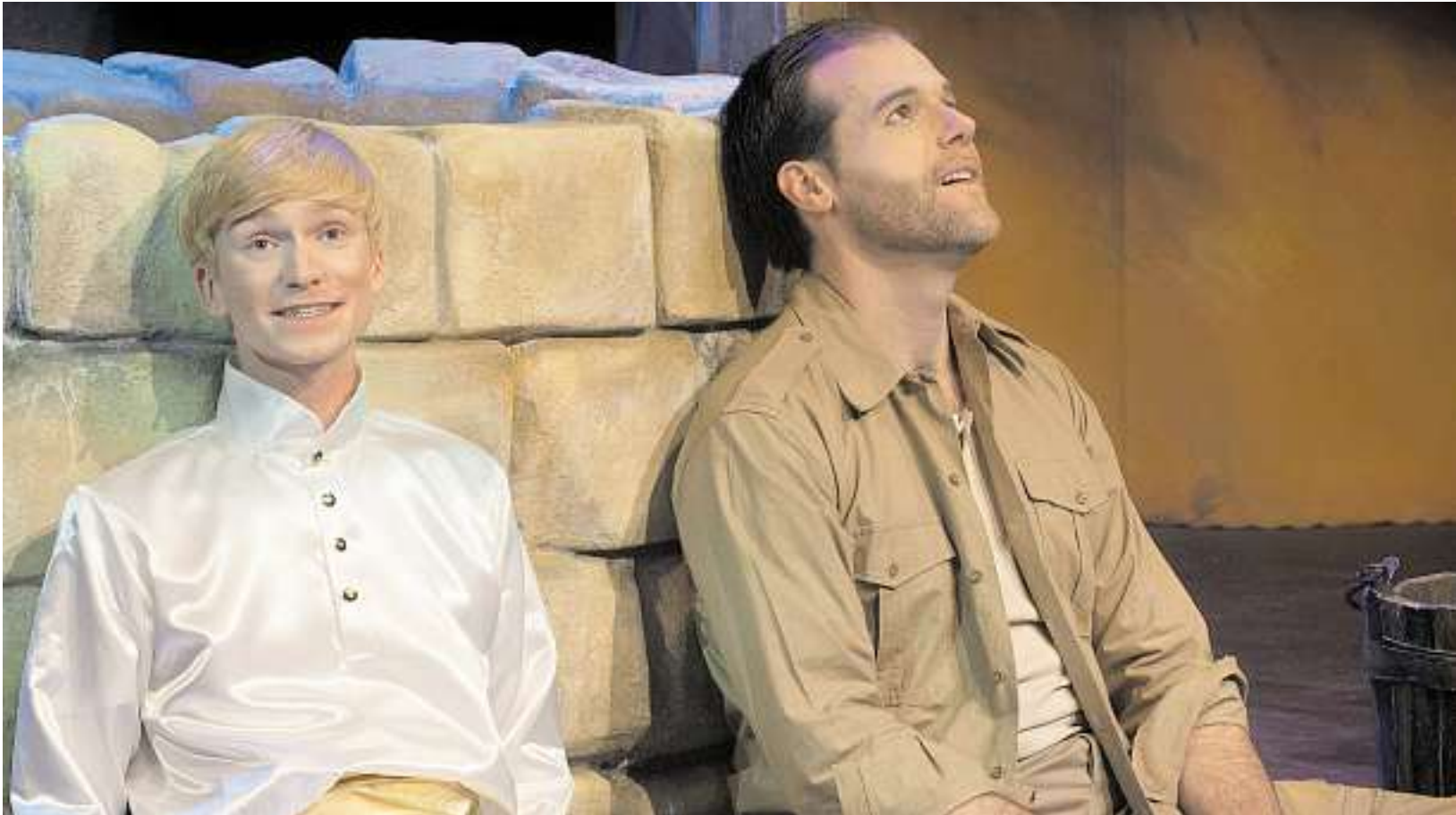
„Der kleine Prinz“ ist ein atemberaubendes und farbenfrohes Bühnenstück mit grandioser Musik und vielen Spezialeffekten.