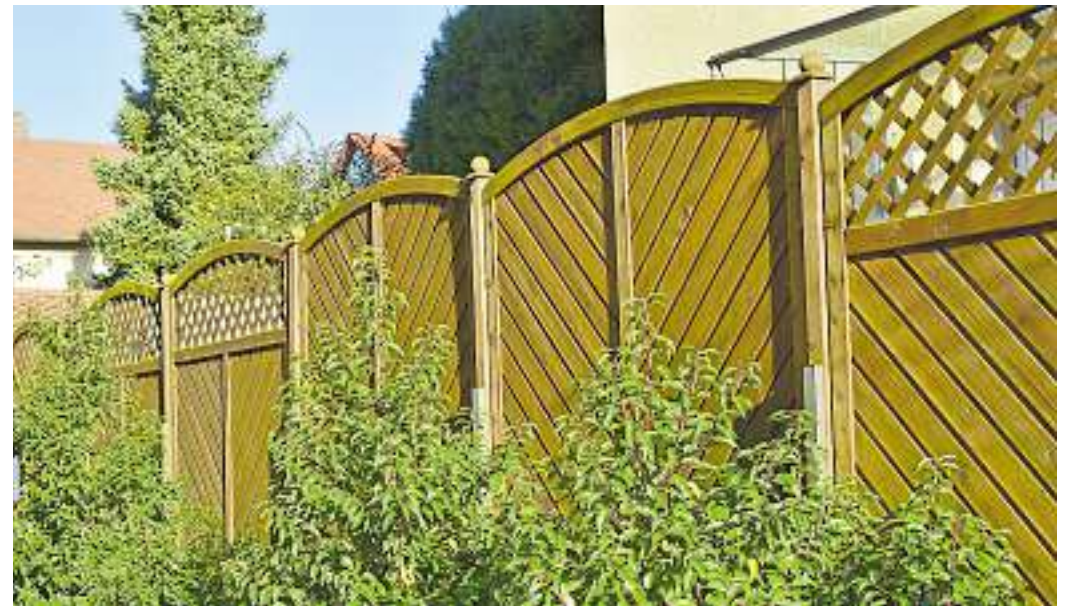
Bei einem Holz-Sichtschutz immer daran denken, dass alle Schrauben und Beschläge aus nichtrostendem Edelstahl bestehen, damit sich das Holz nicht verfärbt.

Nachdem die Grundkonstruktion steht, bringen Sie