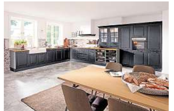
Die schwarzen Fronten verleihen der Landhausküche eine frische und moderne Optik.