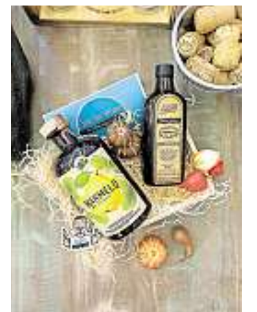
Marmelo ist ein saarländischer Quittenbrand.

Exemplare der limitierten Serie. Jede Flasche wird von Hand gefüllt, etikettiert, versiegelt und nummeriert. Der WOHENSPIEGEL verlost online jeweils zwei Flaschen Marmelo Quittenbrand und Marmelo-Likör. Alle Infos und Teilnahmebedingungen unter www.wochenspiegelonline.de/