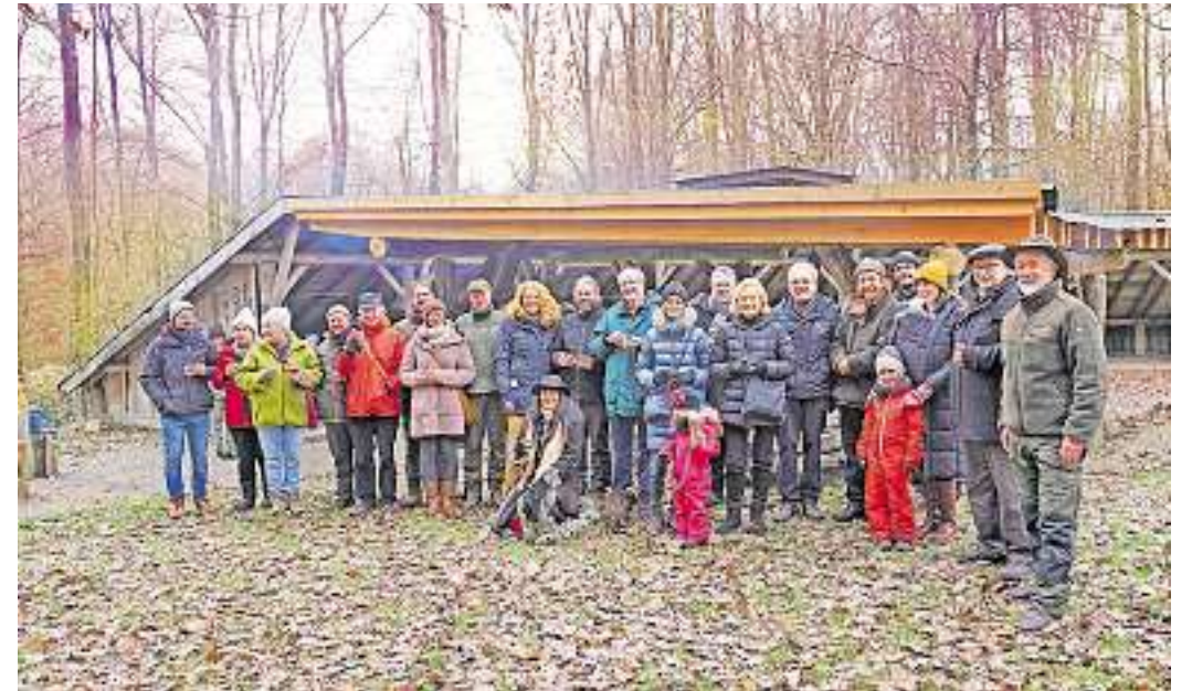
Einweihung des Bauprojekts im „Urwald vor den Toren der Stadt“ mit zahlreichen Gästen.

Neunkirchen. Die Geschäftsstelle der Neunkircher Kulturgesellschaft (VHS, Veranstaltungen, Vermietungen, Musik- und Musicalschule) ist in der Zeit vom 22. Dezember bis zum 1. Januar geschlossen. Ab Montag, 2. Januar, ist die Geschäftsstelle wieder geöffnet. Die Städtische Galerie Neunkirchen ist ab dem 24. Dezember bis einschließlich 3. Januar geschlossen. Die aktuelle Ausstellung „Kimoto. Worte und Zeichen im Fluss“ ist für Besucher wieder ab Mittwoch, 4. Januar, geöffnet. red./hr