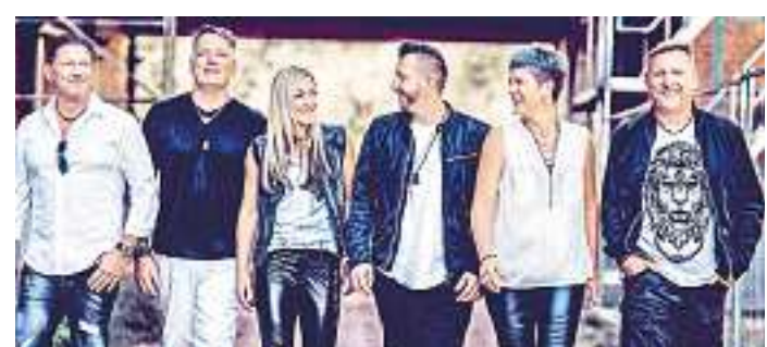
Die Formation „Changes“.

Saarbrücken. Die Spielbank Saarbrücken wird auch 2023 wieder ein abwechslungsreiches Konzertprogramm in der Bel étage anbieten. Los geht's am Freitag, 27. Januar, um 20 Uhr, in der an diesem Abend unbestrittenen Bel étage mit der saarländischen Rockband „Rock Road“.