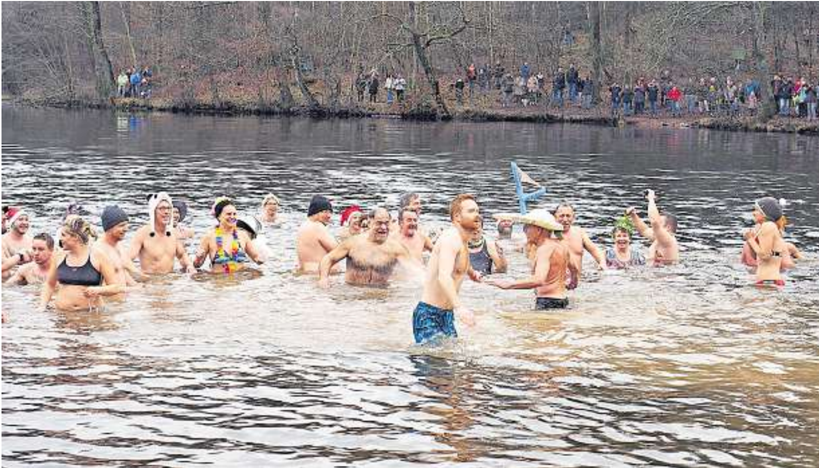
Insgesamt stiegen 2020 60 Schwimmerinnen und Schwimmer in die 4,9 Grad kalten Fluten.