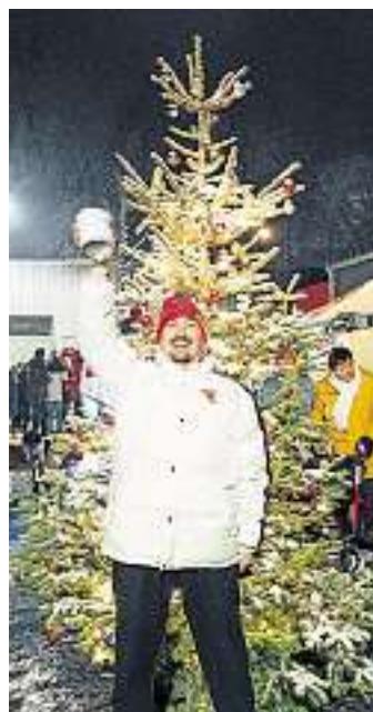
Gut gefüllte Spendendose – Dank großzügiger Spender auf dem Weihnachtsmarkt Hüttigweiler kann sich die Wärmestube Saarbrücken über eine ordentliche Spende freuen.

Hüttigweiler. Als der Heimat- und Verkehrsverein Hüttigweiler informierte, dass ein Weihnachtsmarkt erstmalig auf dem neuen Platz vor der modernisierten Iltalhalle geplant sei, hat der Verein CBF Charity nicht lange gezögert und zugesagt. In Hüttigweiler, speziell auf dem angrenzenden Verzy Platz, wurde schließlich die Idee zu dem Hilfsverein geboren. Die Vorbereitungen für die Teilnahme war ein ganz neues Tätigkeitsfeld. Bedingt durch Corona war es bisher nicht möglich auf einem Fest mit einem eigenen Stand vertreten zu sein. Die Vorfreude war dementsprechend riesengroß. Als passendes Spendenziel für kompletten Gewinn wurde die Wärmestube Saarbrücken ausgesucht, da sich die Zahl der Hilfesuchenden in der Landes-