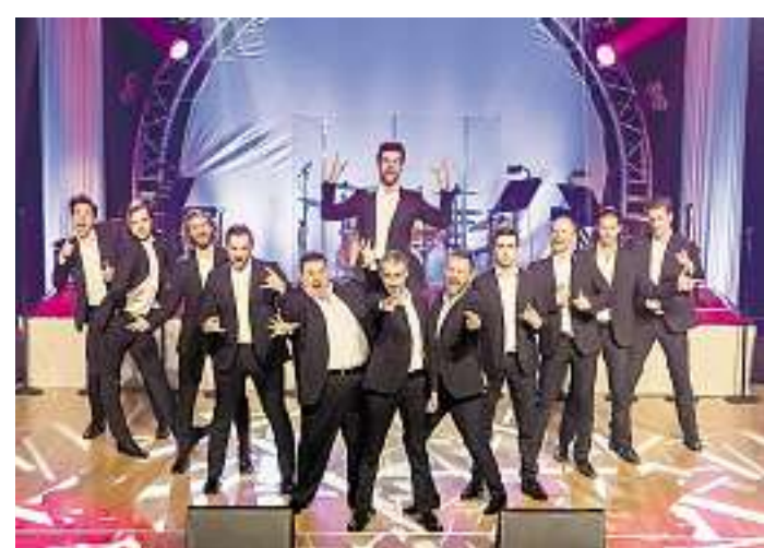
In der Illipse in Illingen präsentieren The 12 Tenors ihre Show „Power of 12“.

Illingen. Zwölf internationale Top-Sänger, begleitet von einer hochkarätigen Band! Zwölf einzigartige Stimmen, umrahmt von einer spektakulären Lichtshow! Ein eindrucksvolles Klangerlebnis und eine Show der Extraklasse! The 12 Tenors sind nach der Zwangspause wegen der Pandemie wieder zurück auf der Bühne. Am Sonntag, 5. März, ist ihre Show „Power Of 12“ ab 20 Uhr endlich in der Illipse in Illingen zu erleben. Das stimmig gewaltige Ensemble holt damit seinen wegen der Pandemie mehrfach verschobenen Auftritt nach, und verspricht live ein musikalisches Feuerwerk der Extraklasse. Seit vielen Jahren begeistern diese zwölf Tenöre überall in Europa aber auch in China, Japan oder Südkorea ihr Publikum. Die stimmliche und persönliche Individualität jedes einzelnen Ensemblemitglieds macht die Einzigartigkeit dieses singenden Dutzend aus. Ihre