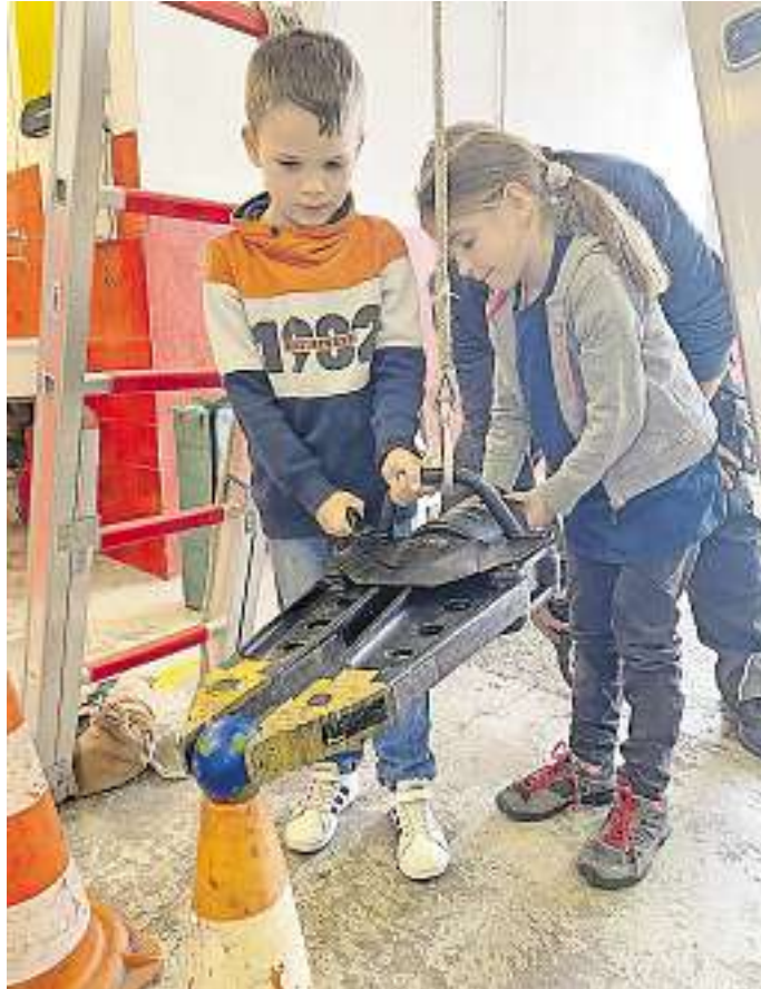
Früh übt sich - In der Kinderfeuerwehr werden Kinder spielerisch auf den Dienst in der Jugendfeuerwehr vorbereitet.

Neunkirchen. Der Löschbezirk Neunkirchen-Innenstadt gründet eine Kinderfeuerwehr für Sechs- bis Achtjährige. Interessierte Eltern sind zum Infoabend am Donnerstag, 5. Januar, 18 Uhr, auf der Feuerwache Neunkirchen, Friedensstraße 11, eingeladen. Um Anmeldung per Mail an feuerwehr@neunkirchen.de oder Tel. (0 68 21) 2 02-804 wird gebeten. Neunkirchen-Innenstadt wird der zweite Löschbezirk der Neunkircher Wehr mit eigener Kinderfeuerwehr sein. Beim Löschbezirk Münchwies gibt es bereits seit 2018 eine solche Vorbereitungsgruppe. In der Kinderfeuerwehr werden Kinder spielerisch auf den Dienst in der Jugendfeuerwehr vorbereitet, in die sie ab acht Jahren eintreten dürfen. Die Gruppe trifft sich nicht nur zu Übungen, sondern auch zum Sport, zum Basteln und Werken oder zu Festen und Ausflügen. Die Mitgliedschaft in der Kinderfeuerwehr ist kostenlos. red./hr