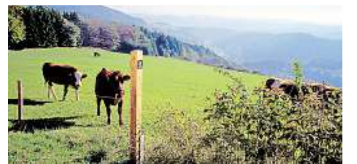
Alle ausgewiesenen Qualitätswanderwege im Waldecker Land sind durchgehend ausgeschildert, verlaufen durch eine naturbelassene Umgebung und sind abwechslungs- sowie aussichtsreich.