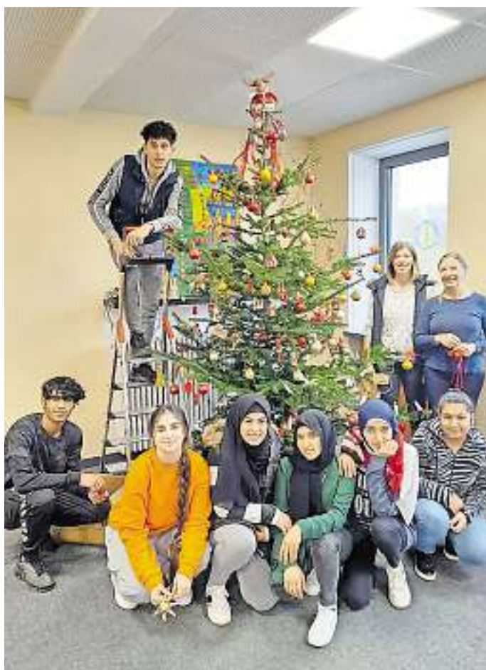
Adventszeit mit Schülern unterschiedlicher Glaubensgemeinschaften am TGSBBZ Neunkirchen.

Neunkirchen. Bastelscheren, Klebstoff und Papier waren vor Weihnachten im TGSBBZ Neunkirchen die wichtigsten Materialien. Die Schüler, die noch nicht lange in Deutschland leben, beschäftigten sich mit den Bräuchen der Vorweihnachtszeit. St-Martin, Advent und der Heilige Nikolaus standen dabei im Fokus. Je nach Sprachverständnis wurde ihnen mit Hilfe von Vokabelübungen und Ausmalen die Thematik nähergebracht und von den Bräuchen berichtet. Dann ging es an die Kreativität: St. Martins-Laterne, Papiertütensterne, Nikolausstiefel aus Servietten und das Schmücken des schuleigenen Weihnachtsbaums. Die Jugendlichen waren mit Begeisterung dabei, die Klassenräume wurden mit den Basteleien geschmückt. So konnten sie gemütlich in die Adventszeit starten. Vor allem die jungen Menschen, denen die christlichen Bräuche nicht vertraut sind, hatten großes Interesse gezeigt, da sie in der Stadt und in den Geschäften