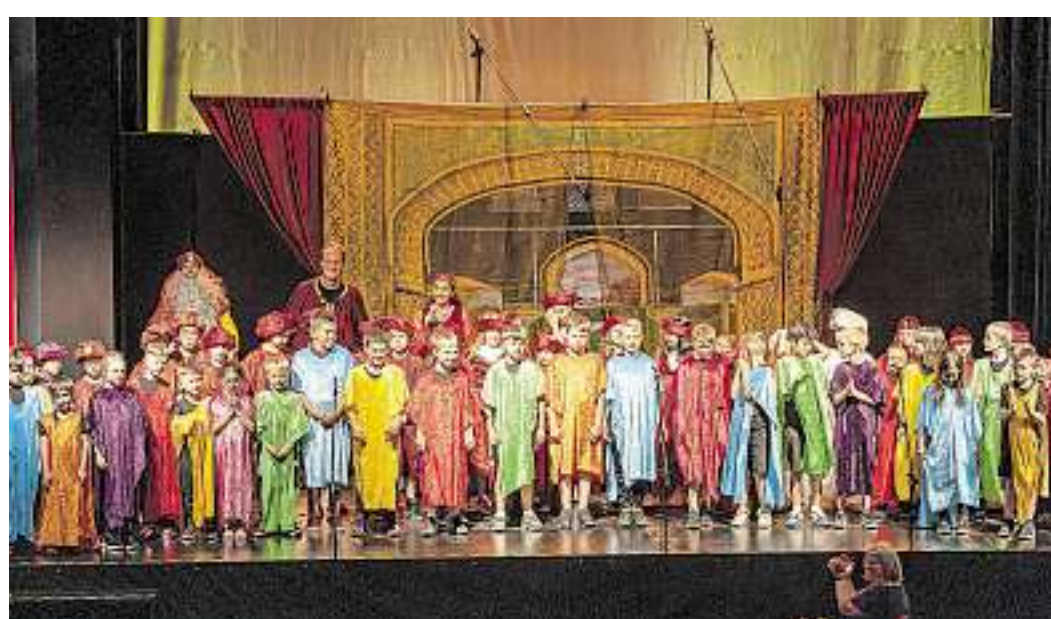
Die Grundschüler boten bei ihrer Aufführung eine großartige Leistung und begeisterte das Publikum.