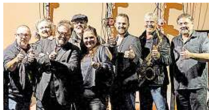
The Final Heat Band spielen zur Eröffnung des 18. Insel-Sommer-Traums.

Schmelz. Beim Eröffnungskonzert des Insel-Sommer-Traums auf der Mühleninsel der Bettinger Mühle in Schmelz am Donnerstag, 20. Juli, spielt ab 18.30 Uhr die Band „Acoustic Mealtme“ als Vorgruppe auf der Bühne unter der Linde. Acoustic Mealtme – das junge und dynamische Akustik Trio aus Saarlouis.