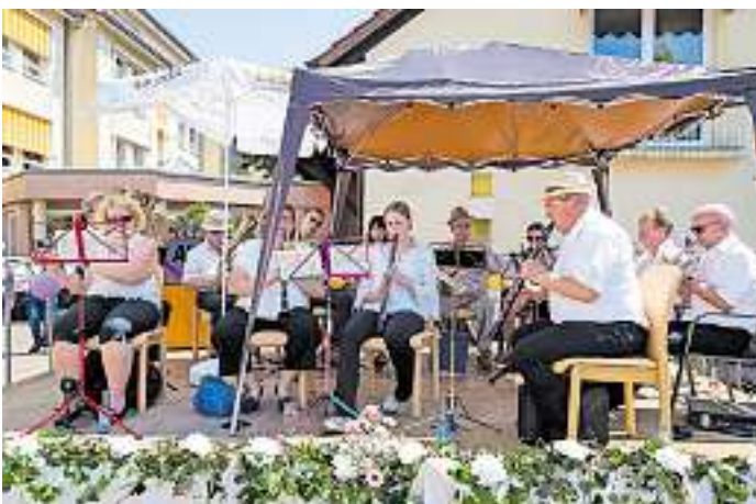
Musik und viel Unterhaltung standen auf dem Programm des Seniorenzentrums Primsmühle.