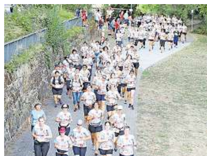
Die 11. Auflage des dm-Frauenlaufes findet am 1. September in Saarlouis statt.

„Wir freuen uns sehr, den Teilnehmerinnen wieder die altbewährte und allseits beliebte Frauenlauf-Atmosphäre, gespickt mit ein paar Neuheiten, bieten zu können“ erzählt Carla Singelmann, Projektmanagerin bei n plus sport, und ergänzt: „Die Resonanz zum neuen T-Shirt-Design war auf jeden Fall schon mal sehr positiv.“ Die Neuheiten aus dem vergangenen Jahr sind gut aufgenommen worden. So wird am 1. September um 18.05 Uhr wieder der eigene Startschuss für die Walkerinnen fallen. Außer-