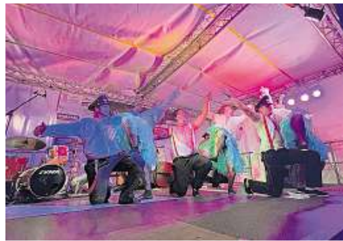
Das Männerballett aus Biringen und Oberesch begeisterte.

Ein weiteres Highlight des Festes war die beeindruckende Großübung der Rettungskräfte, die monatelang vom Organisationsteam geplant und vorbereitet wurde. Am Escherhof konnten die Besucher hautnah erleben, wie die Einsatzkräfte in einer realistischen Rettungssituation agieren. Die professionelle Darstellung verdeutlichte