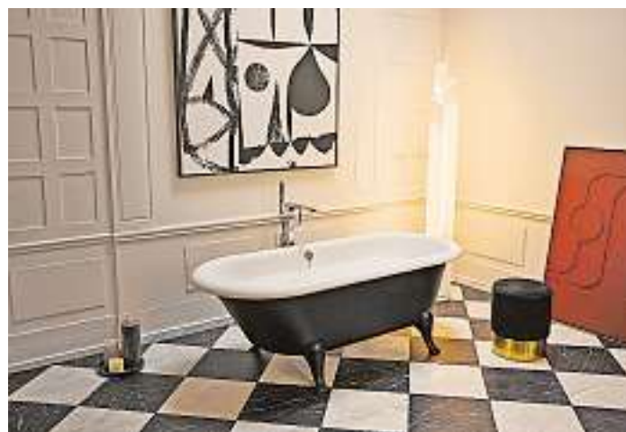
Die elegante, freistehende Wanne mit Echtholzfüßen und wahlweise mattschwarzem Korpus lädt zu glamourösen Badmomenten ein.

Vervollständigt wird das Gesamtbild neben passenden WCs und weiteren Waschbecken durch nostalgische Gründerzeitmöbel. red./jb/hlc