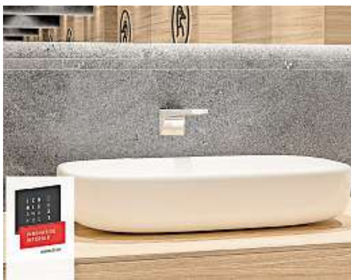
Per Digitaldruck können beispielsweise Logos oder Schriftzeichen auf verschiedenen Profilen aufgebracht werden.