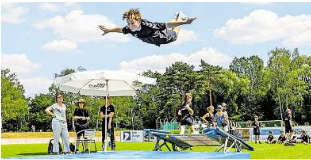
Die jungen Turnerinnen und Turner der TV Germania beeindruckten mit ihrer Turnvorführung.

und Facelift bringt nun die neue vierköpfige Brass Section der nächsten Generation. Einlass ab 18 Uhr. Der Eintritt kostet 12 Euro (Karten nur an der Abendkasse). red./jb