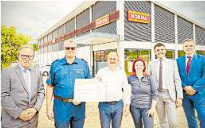
Spendenübergabe von Norma an die Feuerwehr Löschbezirk Nalbach.

„Wir freuen uns, Einrichtungen in unserer Region durch finanzielle Mittel unterstützen zu können“, so der Niederlassungs-