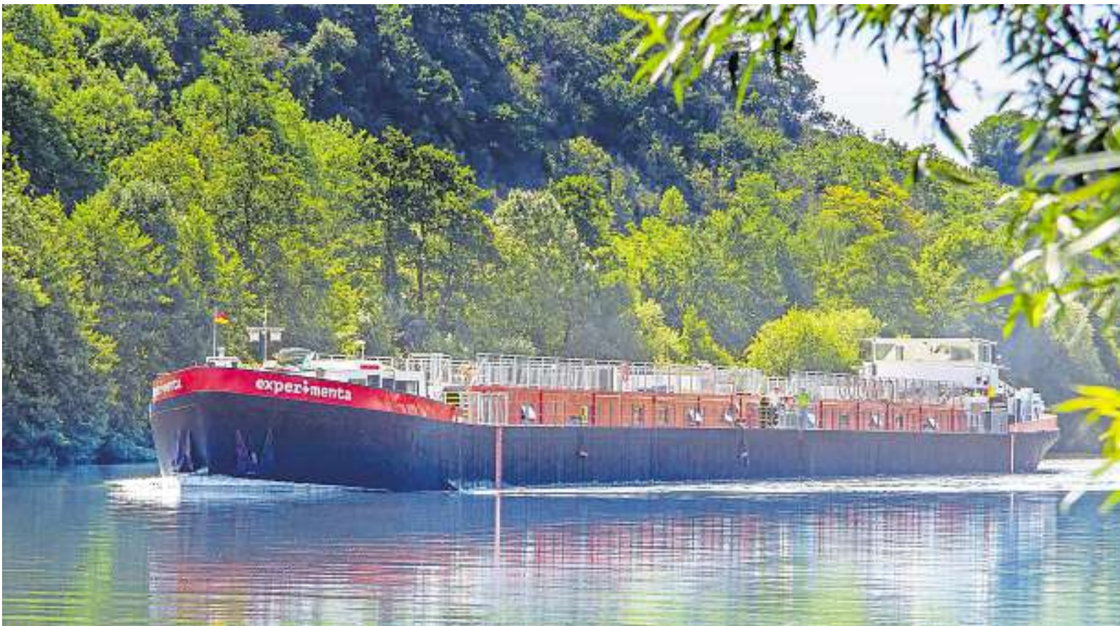
Das Schiff von Deutschlands größtem Science Center ist wieder auf Tour. Auch in Saarlouis wird die MS experimenta anlegen.