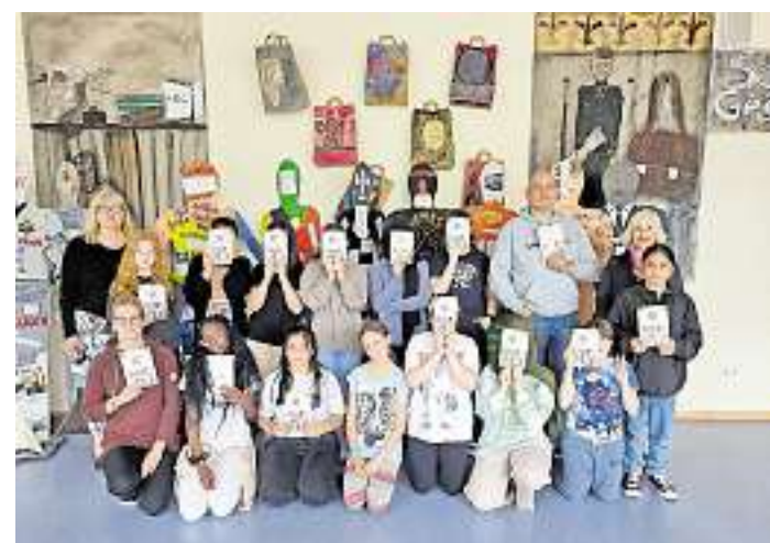
Die Selbstverteidigungskurse fanden in diesem Jahr in der Martin-Luther-King-Schule in Saarlouis statt.

In diesem Jahr fanden die Kurse an der Martin-Luther-King Schule in Saarlouis statt. Aufgrund der großen Nachfrage konnten in Zusammenarbeit mit der Fight University sogar zwei Kurse angeboten werden. Unter dem Oberbegriff „Nicht mit mir!“ werden hier nicht nur Selbstsicherheit und Verteidigung trainiert. Auch der Umgang mit dem Smartphone, Bildern im Internet und Missfrauen gegenüber Menschen im Netz, die ich nicht kenne, sind Bestandteil des Kurses. Selbstverteidigungskurse lehren, wie man sich in Gefahren-