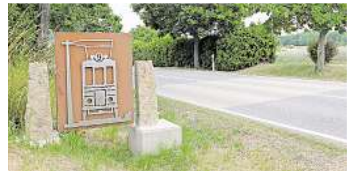
Kunstschmied Klaus Finsterer hat die Stahlkonstruktion hergestellt und montiert.