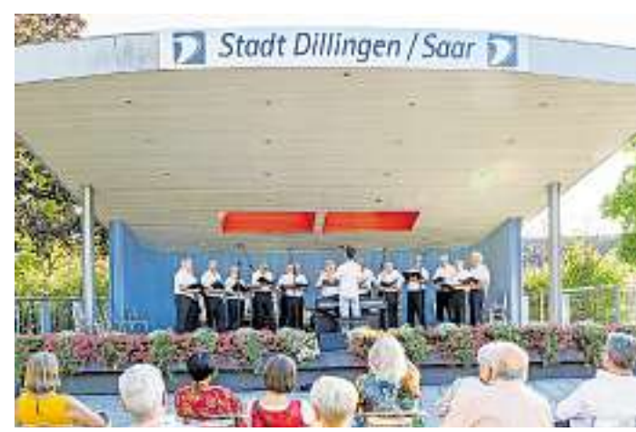
In der Konzertmuschel im Stadtpark in Dillingen findet die AKV-Sommerserenade statt.

Dillingen. Am Sonntag, 23. Juli, veranstaltet die Arbeitsgemeinschaft der kulturellen Vereine der Stadt Dillingen in Zusammenarbeit mit der Stadt Dillingen eine Sommerserenade in der Konzertmuschel im Stadtpark Dillingen. Gestaltet wird die Sommerserenade von der KG Pächter Dickkäpp unter der Leitung von Petra Schmitt, dem Zupforchester Dillingen-Pachten unter der Leitung von Stephan Németh, dem Männerchor 1874 Diefflen unter der Leitung von Stephan Langenfeld, dem Kirchenchor Cäcilia Diefflen unter der Leitung von Florian Schwarz und dem Musikverein Dillingen-Pachten unter der Leitung von Thomas Kopp. Die Tanzgruppe „Golden Girls“ der KG Pächter Dickkäpp präsentieren einen Showtanz unter dem Motto: „Schlager sind toll“. Die KG Pächter Dickkäpp bestehen seit 34 Jahren und haben für jedes Alter eine Tanzgruppe. Von der Minigarde bis hin zum Männerballett tanzen aktuell über 80 Personen in der Gesellschaft. Neben dem Tanz kommt aber auch der Gesang und das gesprochene Wort nicht zu kurz. Die Golden Girls bestehen seit 30 Jahren, hier findet sich überwiegend das Alter 30 plus zusammen, um jährlich einen schönen Schautanz gemeinsam auf die Beine zu stellen. Das Zupforchester Dillingen-Pachten eröffnet mit einem Prelude aus „Te Deum“ von Marc-Antoine Charpentier. Es