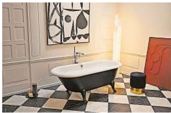
Die elegante, freistehende Wanne mit Echtholzfüßen und wahlweise mattschwarzem Korpus lädt zu glamourösen Badmomenten ein.

mosphäre auf dem Schulhof der Grundschule Bliesen erwartet die Zuhörer eine bunte Mischung irischer Klänge, Ohrwürmer berühmter Musiklegenden, bekannte Oldies sowie moderne Hits. Für das leibliche Wohl ist gesorgt. Der Eintritt ist frei. red./tt