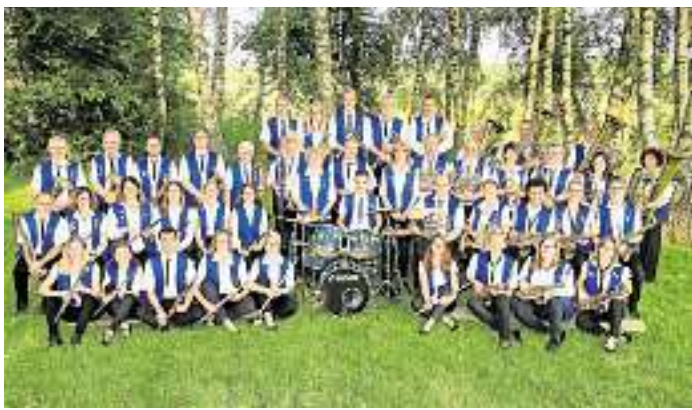
Der Musikverein Bliesen präsentiert zum Jubiläum ein schwungvolles Programm.