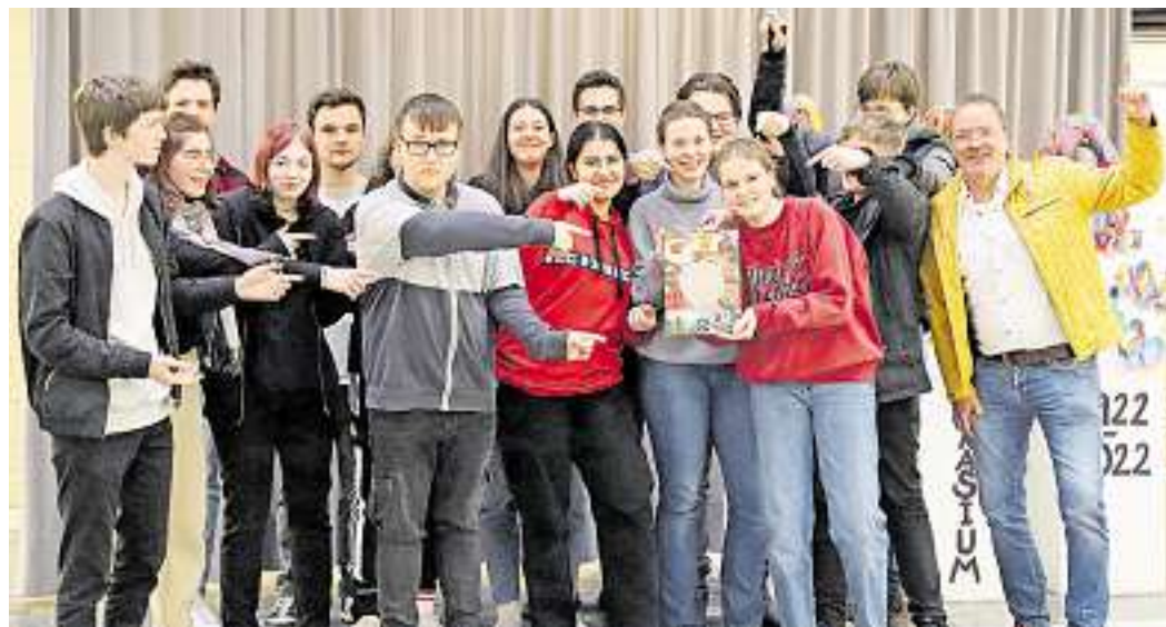
Die Schüler der ehemaligen Klasse 10c freuen sich über die Veröffentlichung ihres Fair-Trade-Kochbuches.