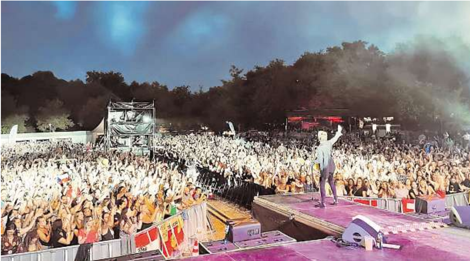
An allen Veranstaltungstagen wird die Stimmung bei allen Konzerten beim Burg Open Air an der Burg Kerpen bestens sein.

Meilerbetrieb und Rahmenprogramm am Rande des Buchwalds von 15. bis 29. Juli