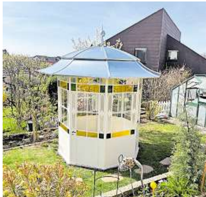
Ein nostalgischer Metall-Pavillon wird in liebevoller Handarbeit individuell und „Made in Germany“ angefertigt.

Wollen Sie in Ihrem Garten viele verschiedene Kräuter mit unterschiedlichen Ansprüchen an Standort und Boden anbauen und ernten, dann empfiehlt sich der Bau einer Kräuterspirale oder -schnecke red./jb