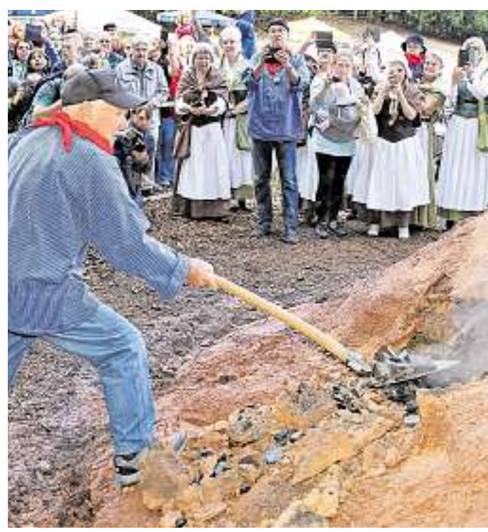
Ist die Holzkohle gut geworden? Immer wieder spannend ist die Öffnung des Meilers am Ende der Köhlertage im Beisein zahlreicher Besucher.

Es ist wahrlich eine Mammutleistung, was die Dorfbevölkerung bei den Vorbereitungen und den Köhlertagen am Meilerplatz ableistet. Die Köhlertage sind mittlerweile weit über die Grenzen des Landkreises St. Wendel bekannt und nicht mit den üblichen Volksfesten vergleichbar. Das Dorf besinnt sich hierbei auf seine geschichtliche Entwicklung. Nur wenn man sich jetzt mit seiner Vergangenheit aktiv befasst, kann man sie auch für spätere Generationen bewahren und erlebbar machen. Was vom kleinen geschäftsführenden Vorstand und einem Orgateam der Arbeitsgemein-