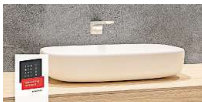
Per Digitaldruck können beispielsweise Logos oder Schriftzeichen auf verschiedenen Profilen aufgebracht werden.

Thomas Feit aus Primstal genoss über neun Jahre klassische Schlagzeugausbildung. Diese setzte er in diversen Bandprojekten, als Aushilfsschlagzeuger und in Musikvereinen um. Er war und ist unter anderem in den Bands „Drunken Roosters“, „Stonetable“, „Woodwell“ und „Blue Summer“ aktiv. Bei „AnTon“ hat er nun das „große Schlagzeug“ gegen das Cajon ausgetauscht. Der Badebetrieb am Konzerttag ist bis 21 Uhr möglich. Der Eintritt kostet 2 Euro. Veranstaltet wird „Live im Bad“ von der Gemeinde Nonnweiler, dem Förderverein Naturfreibad und der DLRG Primstal. Die Veranstaltung endet um 23 Uhr. red./hr