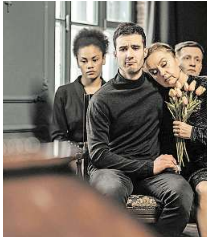
Bei der Trauerbewältigung hilft es, wenn man nicht alleine damit fertig werden muss.

Trauer braucht ihren Raum und ihre Zeit. Die Stiftung Deutsche Bestattungskultur hat für Trauernde auf dem Ohlsdorfer Friedhof in Hamburg sogar eine eigene „Trauerhaltestelle“ eingerichtet: Menschen in Trauer können dort mit Kreide ihre Gedanken beschreiben und nach einiger Zeit lässt die Witterung diese Gedanken verschwinden. Die Trauerhaltestelle ist bewusst konfessionsfrei und für jedermann zugänglich angelegt. Wie tief und wie lange jemand nach dem Tod eines wichtigen Menschen trauert, hängt von vielen Faktoren ab. Unterstützungsangebote helfen dabei, mit dem Schmerz nicht alleine bleiben zu müssen. Viele Hinterbliebene ziehen sich in ihre Trauer zurück. Trauer-Zeit kann und sollte man nicht willentlich verkürzen, da unverarbeitete Trauer und mangelnde Akzeptanz eines schweren Verlustes zu Krankheiten, Depression und seelischen Schäden führen können. Hier braucht es Stütze und Geleit – durch Familie, gute Freunde, eine Selbsthilfegruppe oder einen Trauerbegleiter. Erste Ansprechpartner sind dabei oft die Bestattungshäuser und ihre Trauernetzwerke.