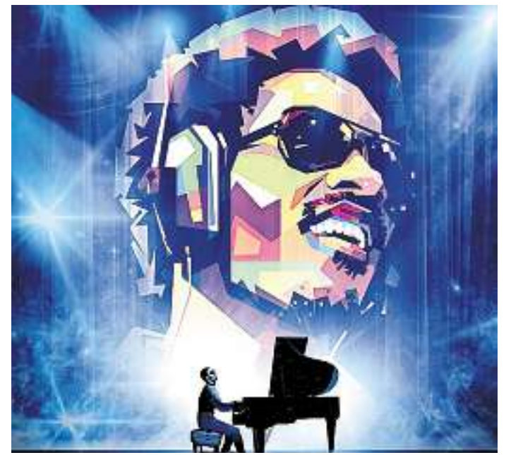
Eine Tribute-Show der Extraklasse wartet auf die Besucher in der Dillinger Stadthalle.

The Stevie Wonder Story ist ein musikalischer und visueller Leckerbissen mit Bläsern im Philly-Stil, einer Rhythmusgruppe inklusive Schlagzeug und herausragenden Backgroundsängern. Sie wird, versprechen die Produzenten, „das Publikum fesseln, begeistern und zum Tanzen bringen – zu den Songs und dem Soul einer Motown-Legende“. Karten sind in Dillingen im First Reisebüro, Tel. (06831) 98730 sowie in allen bekannten Vorverkaufsstellen und unter www.kultopolis.com erhältlich. red./jb