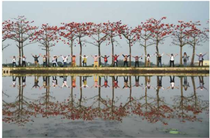
112年阮綜合醫院攝影比賽 院內員工組 - 優選 - 相聚在花季