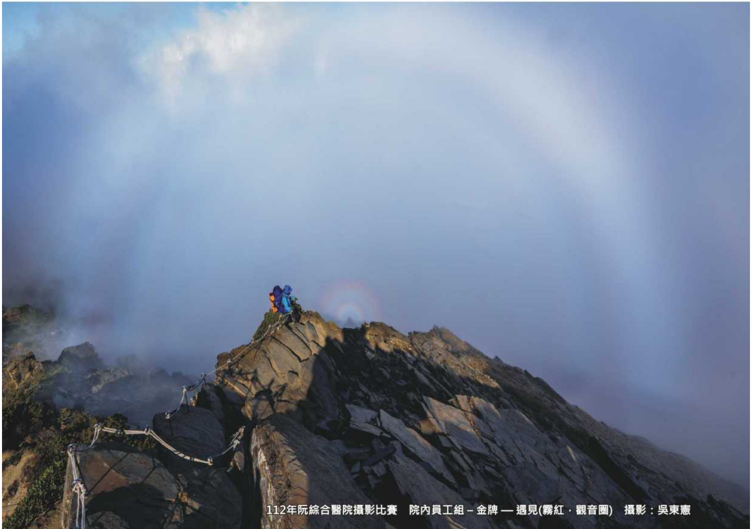
112年阮綜合醫院攝影比賽 院內員工組 - 金牌 — 遇見(霧紅·觀音圈)