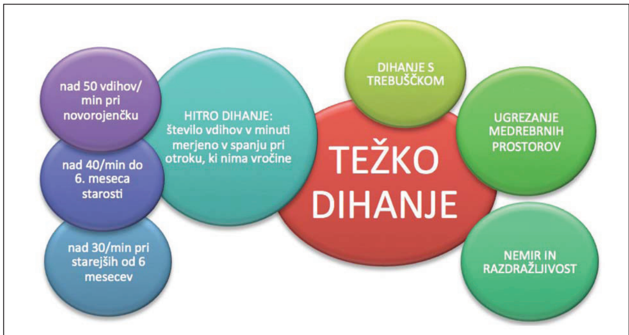
Slika 1: Simptomi in znaki oteženega dihanja, Vir: Drole Torkar, Mrvič, 2012