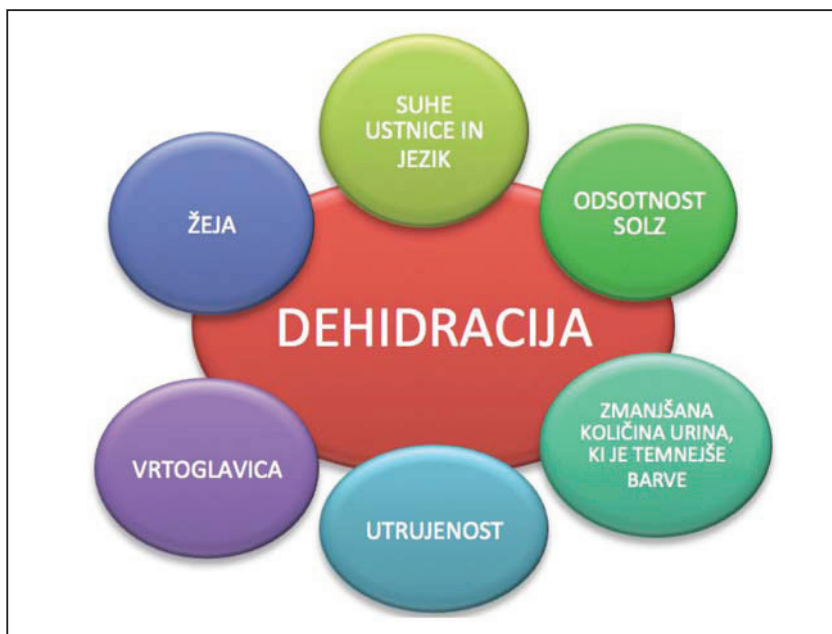
Slika 2: Simptomi in znaki dehidracije