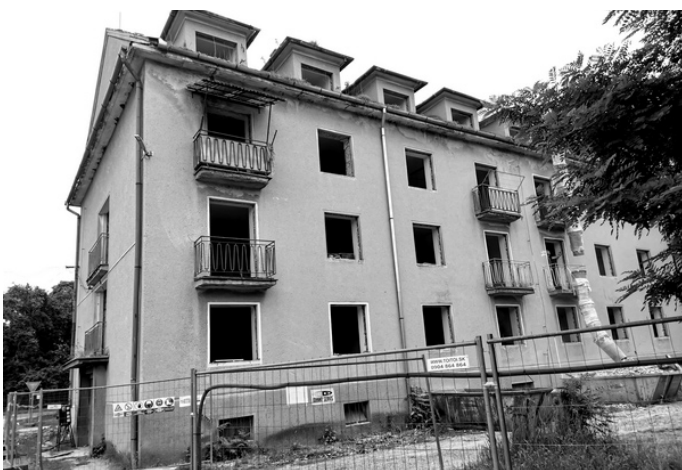
V priebehu mája sa začali práce na prestavbe slobodárne. Rekonštrukciou vznikne 19 nájomných bytov.

A következő időszak projekttervezete tulajdonképpen a PHSR folytatásaként fogható fel, hiszen a dokumentum tartalmazza mindazokat a fejlesztési elképzeléseket, amelyeket nem kezdtek el, ill. nem fejeztek be. A teljesség igénye nélkül ide tartozik pl.: a helyi utak fejlesztése, új parkolóhelyek, új temető létesítése, a kastély és a park, valamint a kemping és a fürdő felújítása, a geotermikus forrás hasznosítása. A lakáspolitikai terén a többrendeltetésű házak építése, a munkásszálló átépítése, családiház-, ill. társasház-építés feltételeinek megteremtése. A tanügyben, kulturális és szociális ügyek terén a magyar tannyelvű alapiskola, az óvodák, a kultúrházak felújítása, fesztiválszervezés támogatása, napközi-időotthon és közösségi helyek építése. A tervezetek között még mindig találkozhatunk a csatornahálózat-építéssel, a régió ivóvízellátásának fejlesztésével, folytatódna a kerékpárutak, a pihenőövezetek fejlesztése, a közterületek revitalizációja, az illegális szemétdombok felszámolása, valamint az épületek energiaigény-csökkentése. (ik)