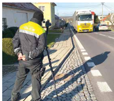
■ Městská policie může rychlost měřit na místech schválených dopravní policií. Mobilním radarem měří už od minulého roku na vybraných místech, nejčastěji v městských částech Znojma.

Spuštěno už bylo v minulých dnech nejen v Kasárnách, ale i v Načeraticích a na ulici Evropská. „Postavíme kameru na určené místo, ta následně všechna projíždějící auta eviduje. Pokud jede řidič moc rychle, přestupek si kamera zapamatuje a následně vše přehrajeme do systému. Ten obsluhuje odbor dopravy, který do dvou až tří týdnů odešle provozovateli vozidla pokutu,“ vysvětluje ředitel Městské policie Znojmo Ivan Budín. Strážníci tu ale ne-