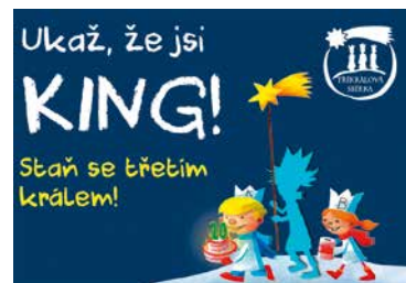
■ Tříkrálová sbírka 1.–14. ledna 2020.

Charita také spolupracuje s vedením znojemské věznice, kam již doručila 535 pokladniček, které lidé ve výkonu trestu čistí a připravují na výroční dvacátou Tříkrálovou