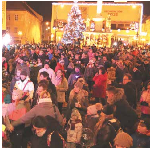
■ V posledním dni starého roku se lidé opět sejdou v centru města.

Znojemský stánek Thálie uvede na silvestra v 17.00 a v 19.00 hru Dokud nás milenky nerozdělí. V brilantní situační komedii plné zvrátů a záměn uvidíte na jevišti herce Veroniku Freimanovou, Vladimíra Kratinu a další. Kdo si tak chce užít silvestr v netradičně divadelním prostředí, může zakoupit vstupen-