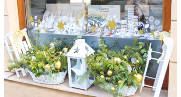
■ Originální výzdobou, a to během celého roku, kráší Obrokovu ulici obchod Klenoty Mareš. Za tu loňskou vánoční získal v soutěži 1. místo.

O nejkrásnější vánoční stromek – nejhezčí nazdobený vánoční stromek v Obrokově ulici – jeden za mateřské školy, jeden za základní školy. Není nutné se předem hlásit.