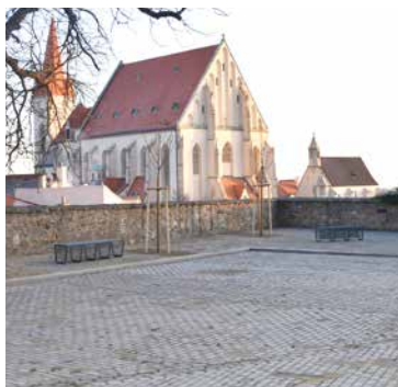
■ Nové zadláždění i odstranění zdi výrazně přispělo k zatraktivnění celého areálu.

Zajímavostí nového povrchu je vyznačení půdorysu Loupežnické věže, jejíž základy byly objeveny v rámci archeologického průzkumu. Osmihranná románská Loupežnická věž byla až do roku 1892, kdy se zřítla, významnou dominantou města. Zvýrazněny jsou i půdorysné stopy