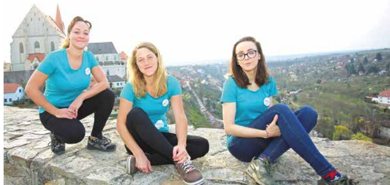
■ Občasně pracující pracovníčky znojemského Kontaktního centra, které sídlí na ulici Horní Česká 4.

Nedílnou součástí služeb centra je také výměnný program injekčního materiálu. Centrum zaštiťuje po celé republice Společnost Podané ruce. Další informace na www.podaneruce.cz . lp