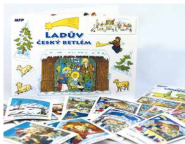
■ Ladovský advent.

To vše můžete mít doma. Propagační předměty lze zakoupit v Turistickém informačním centru na Obrokové ulici jako upomínku Znojemskeho adventu 2019 motivovaného tvorbou Josefa Lady. Příliš ovšem neváhejte. O Mistra Ladu je zájem a počet kusů je omezen! lp