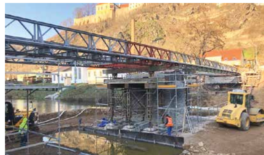
■ Oprava mostu pokračuje.

Firma bude nyní na stavbě pracovat přibližně do 21. prosince, pokračovat bude 6. ledna. Pěším bude průchod dočasně povolen, ač se stále