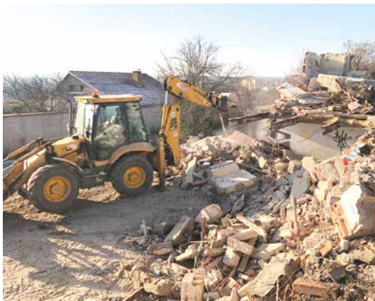
■ V Příměticích už z bývalého autocvičiště odklízí sut. Chystá se tak plocha na nové hřiště.

„V létě jsem slíbil, že ruinu na bývalém cvičišti odstraníme, a to se stalo,“ říká místostarosta Jakub Malačka a dodává: „Už jsem dostal pár dotazů, jestli bude město lokalitu prodávat nějakému developerovi. Aktuálně to v plánu není a nevidím zatím důvod, abychom to v budoucnu udělali. Naopak na celé prostranství máme zpracovanou stu-