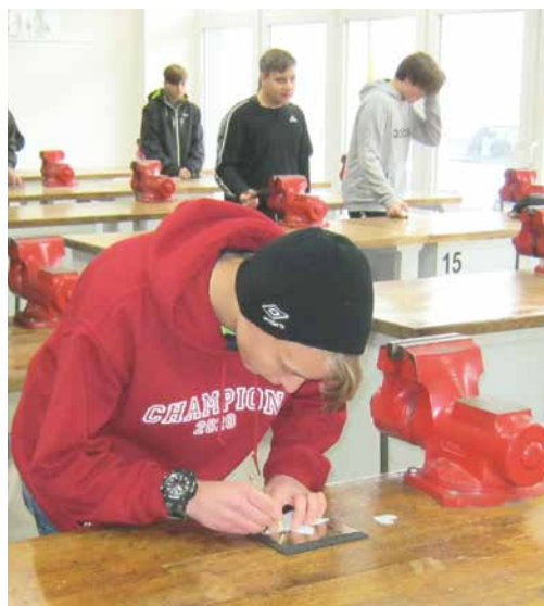
■ Vyzkoušet si řemeslo bylo lákavé.