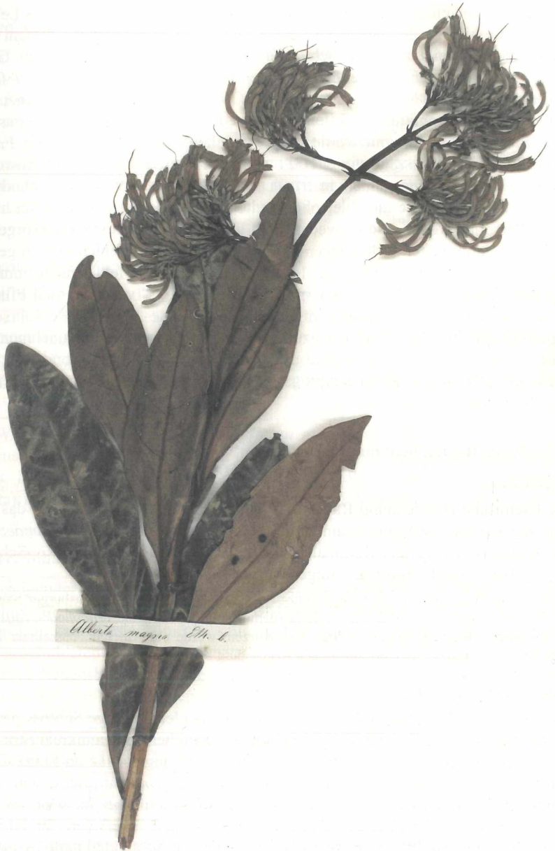
Abb. 1: Herbarbeleg von Alberta magna (Herbarium REG).