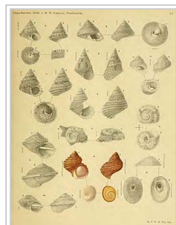
Arten-Tafel aus Schepmans 494 Seiten umfassendem Hauptwerk The Prosobranchia of the Siboga Expedition