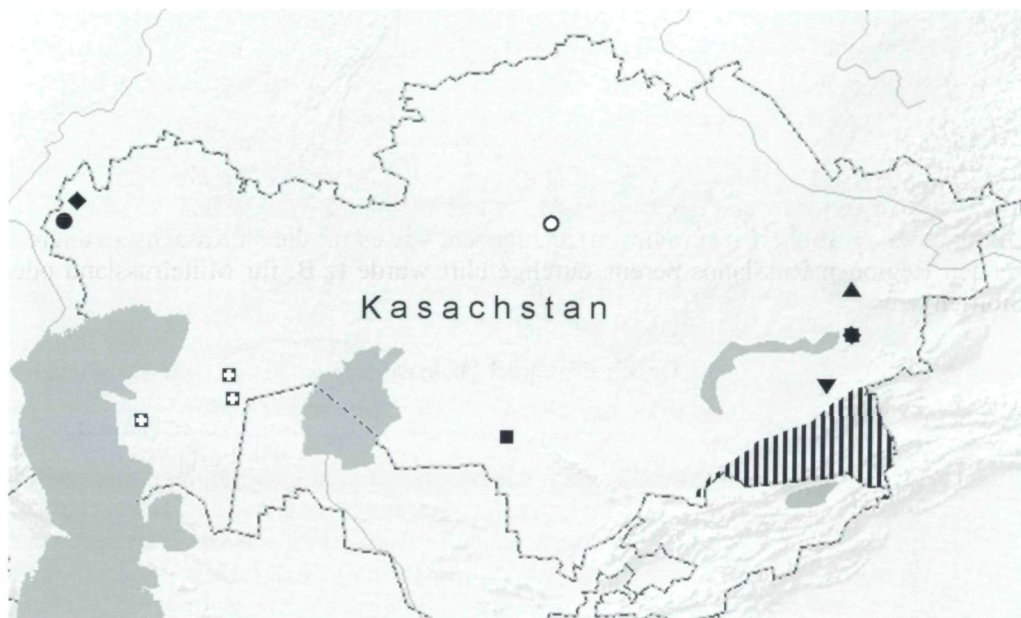
Abb. 1: Fundorte in Kasachstan von Chenopodium gubanovii [○], Atriplex paradoxa [|||||], Atriplex thunbergiaefolia [■], Climacoptera subcrassa und Horaninovia capitata [▲], Anabasis ebracteolata [⊠], Glaucium squamigerum [▼], Veronica biloba [●], Ambrosia artemisiifolia und Bidens frondosa [◆], Senecio viscosus [▲].

Auch diese Art ist neu für Kasachstan; sie war bisher nur aus einigen Gebieten von Usbekistan, Turkmenistan und Tadschikistan bekannt [LE, MWG, TASH]. Sie ist typisch für Flussgebüsche (die sogenannten "Tugai") und tritt hin und wieder auch an sekundären Standorten auf.