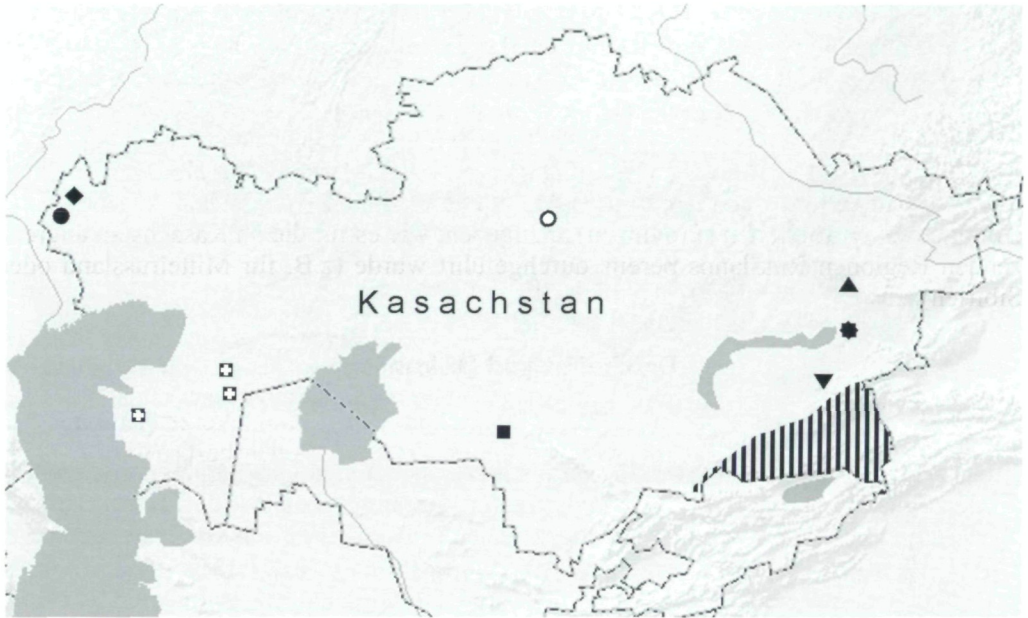
Abb. 1: Fundorte in Kasachstan von Chenopodium gubanovii [○], Atriplex paradoxa [▨], Atriplex thunbergiaefolia [■], Climacoptera subcrassa und Horaninovia capitata [●⊠], Anabasis ebracteolata [⊠], Glaucium squamigerum [▼], Veronica biloba [●], Ambrosia artemisiifolia und Bidens frondosa [◆], Senecio viscosus [▲].

Auch diese Art ist neu für Kasachstan; sie war bisher nur aus einigen Gebieten von Usbekistan, Turkmenistan und Tadschikistan bekannt [LE, MWG, TASH]. Sie ist typisch für Flussgebüsche (die sogenannten "Tugai") und tritt hin und wieder auch an sekundären Standorten auf.