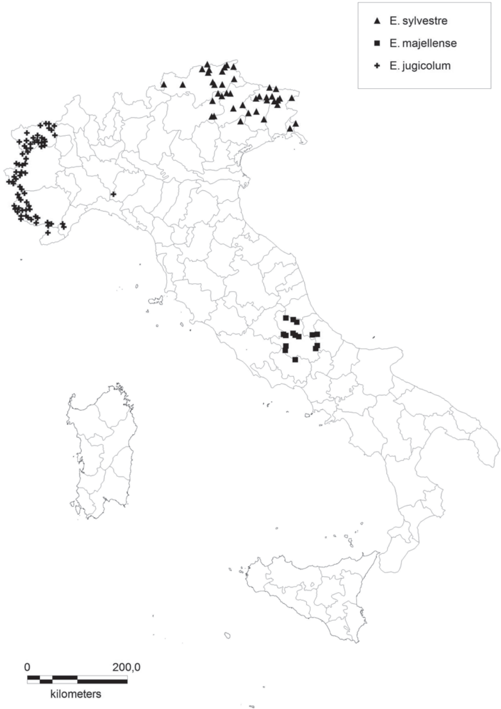
Fig 5: Distribution map of Erysimum jugicolum JORDAN, E. majellense POLATSCHKEK and E. sylvestre (CRANTZ) SCOP. in Italy.