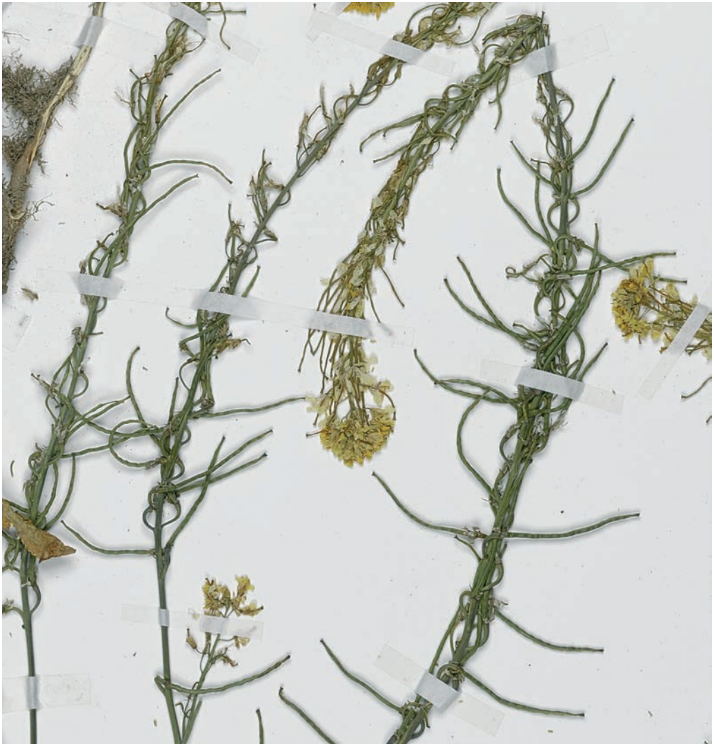
Fig. 4: Sisymbrium pallescens , typischer Fruchtstand, W 2011-0012095.