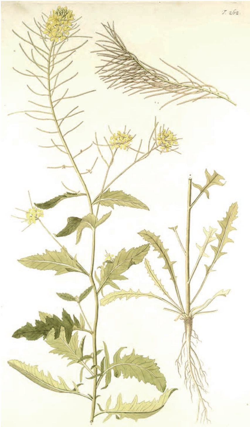
Fig. 2: Sisymbrium austriacum , JACQUIN 1775, Flora Austriaca 3: tab. 262.