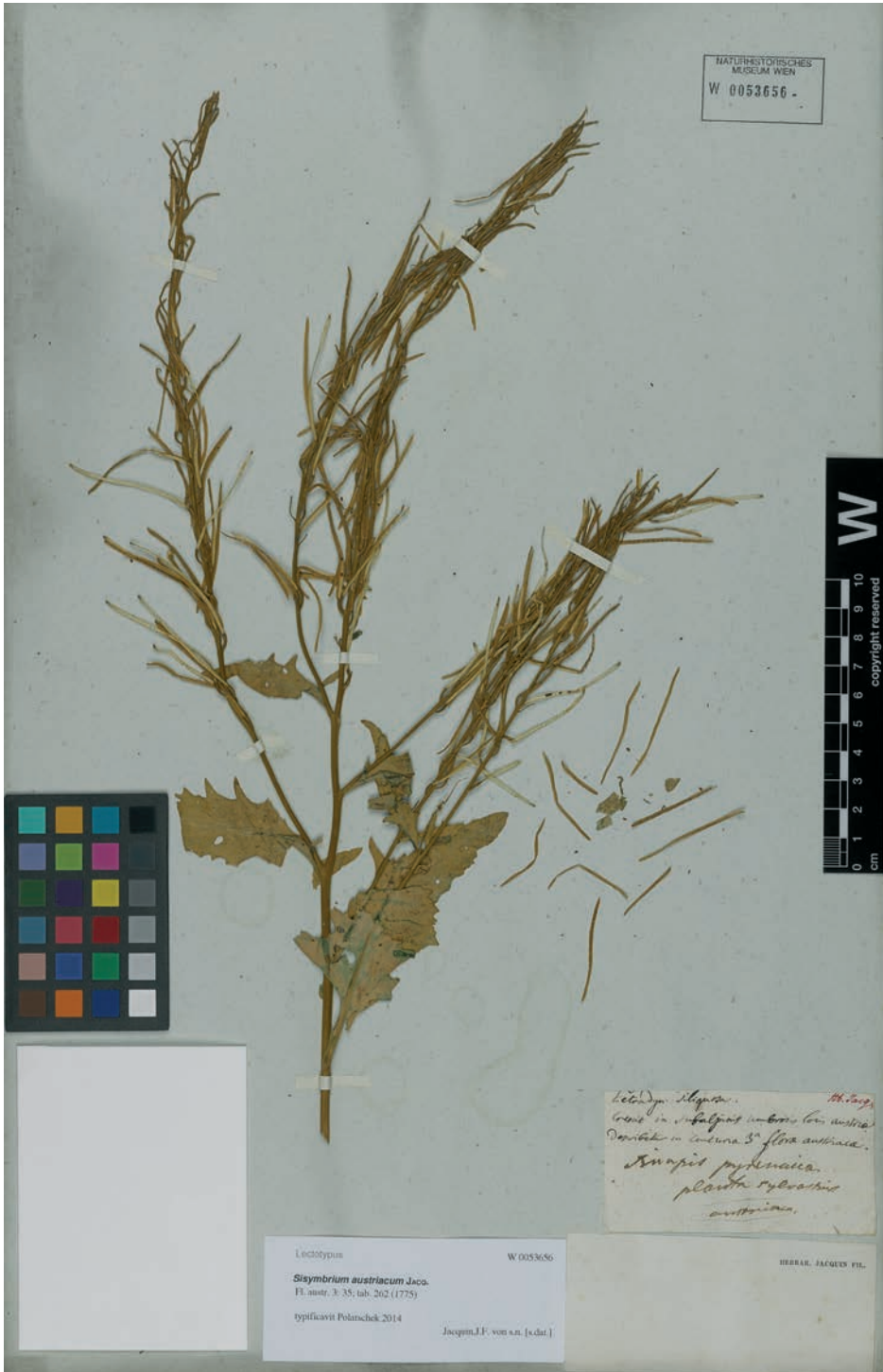
Fig. 1: Sisymbrium austriacum , Lectotypus [W 0053656].