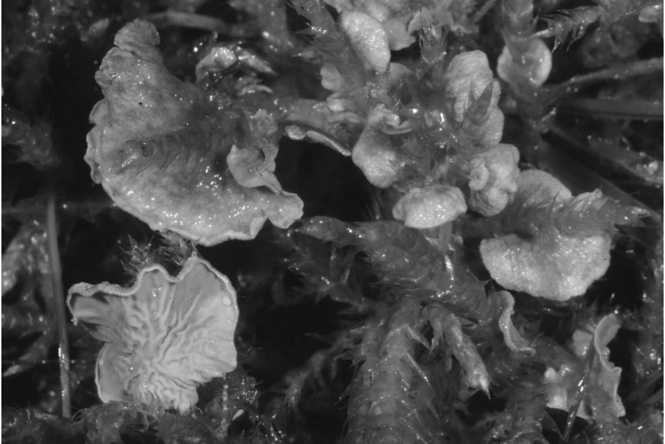
Abb. 1: Bei Arrhenia retiruga handelt es sich um einen in ganz Nordrhein-Westfalen bislang selten gefundenen Adermoosling. Er zählt zu den ritterlingsartigen Pilzen, weist allerdings im Gegensatz zu den eigentlichen Ritterlingen lediglich stark reduzierte Lamellen auf.