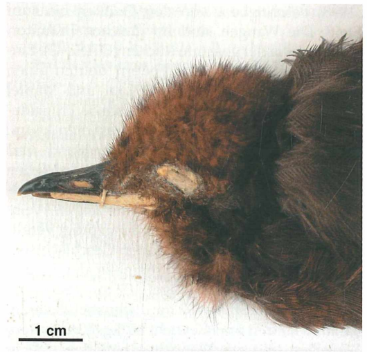
Abb. 3. Jungvogel von Rallina forbesi dryas (Mayr, 1931). ZMB 30.1846, Museum für Naturkunde der Humboldt-Universität zu Berlin. – Juvenile specimen of Rallina forbesi dryas (Mayr, 1931). ZMB 30.1846, Museum für Naturkunde der Humboldt-Universität zu Berlin.

ausgewachsener Vögel, der Tarsus (vom Intertarsalgelenk bis zur letzten ungeteilten Fußschuppe) hat die Länge von 34,7 mm. Die Schwanzfedern stecken noch in den Blutkielen. Mit seinen 56 Gramm 15 liegt dieser Jungvogel zudem weit unter dem Gewicht der Elterntiere (s.u.). Mayrs Exemplar einer jungen Nymphenralle wurde am 7. März 1929 erlegt (Abb. 3). Interessant ist, dass auch dieses äußerst junge Tier schon die dorsale Färbung der adulten Männchen zeigt (vgl. Mayr 1931), und rein äußerlich Geschlecht bestimmt werden könnte. Mayr vermerkte dennoch auf dem Etikett, dass er den Vogel seziiert und dabei kleine Hoden aufgefunden hatte.