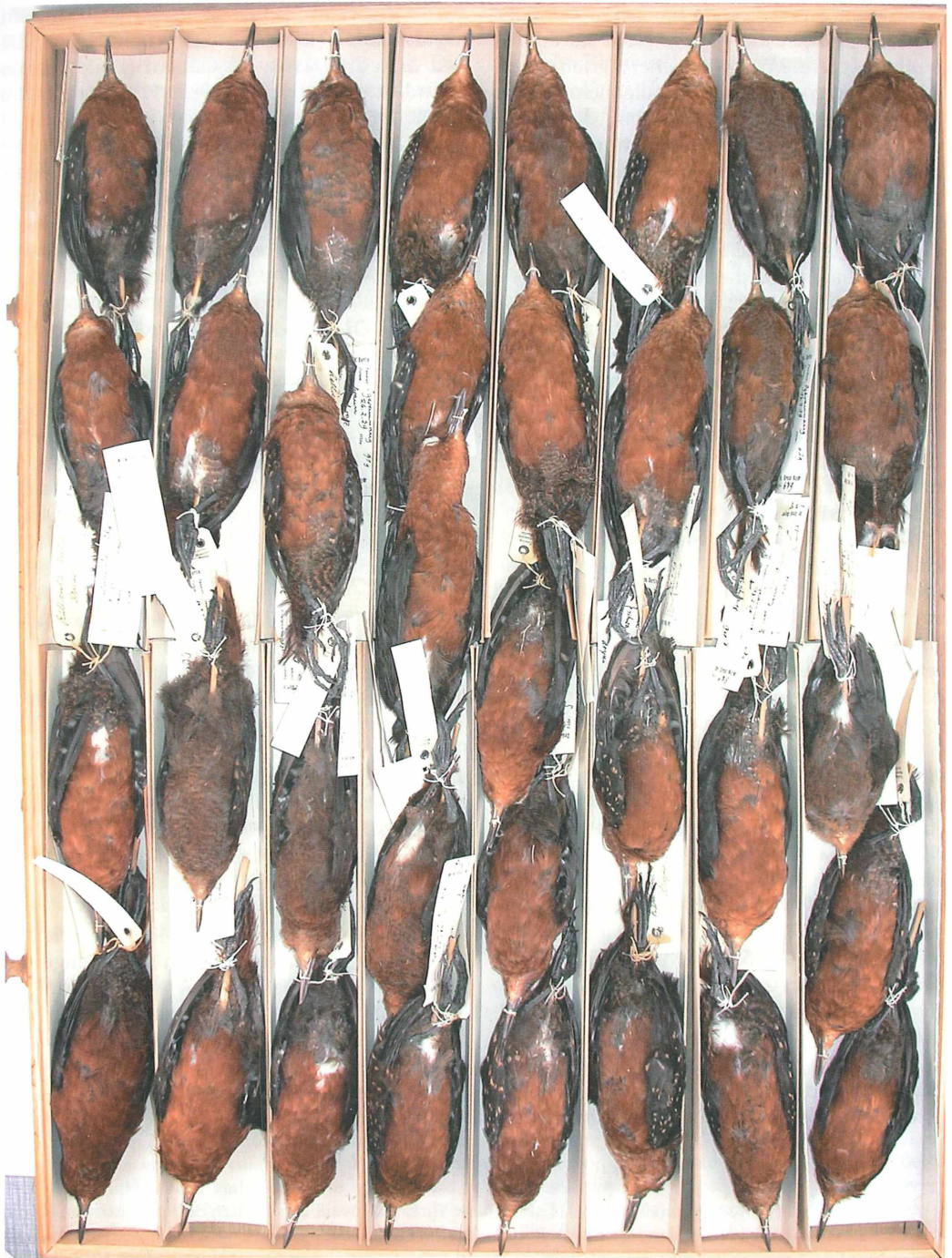
Abb. 1. Die 35 heute am Museum für Naturkunde der Humboldt-Universität zu Berlin verbliebenen Exemplare der von Ernst Mayr auf der Huon-Halbinsel 1929 gesammelten Nymphenrallen-Unterart Rallina forbesi dryas (Mayr, 1931) (ZMB 30.1815-30.1856). – Specimens of Forbes' Forest-rail Rallina forbesi dryas (Mayr, 1931) (ZMB 30.1815-30.1856) collected by Ernst Mayr on the Huon-Peninsular in 1929, now housed at the Museum für Naturkunde der Humboldt-Universität zu Berlin.