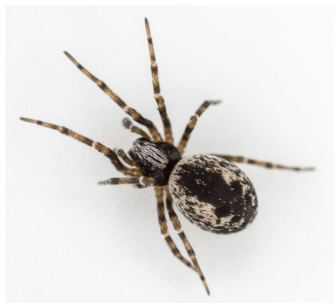
Abb. 1: Weibchen von Brigittea civica (Lucas, 1850), Habitus Fig. 1: Female of Brigittea civica (Lucas, 1850), habitus

Material und Methoden. Bayern, Bamberg-Nord, Zollnerstraße, Gewerbegebiet (ehemalige Kaserne), 49,90681°N, 10,91546°E, 250 m, TK-6031, 21. Mai 2018: 1 ♂, 2 ♀; Hirschaid, Ortsmitte, öffentliches Gebäude, 49,81644°N, 10,98991°E, 251 m, TK-6131, 10. Jun. 2018: 1 ♂, 1 ♀; Forchheim/Ofn, Nähe Nürnberger Tor, Wohngebäude, 49,71571°N, 11,06169°E, 264 m, TK-6232, 10. Jun. 2018: 1 ♂, 1 ♀; Baiersdorf, Ortsmitte, Wohngebäude, 49,65677°N, 11,03279°E, 272 m, TK-6332, 10. Jun. 2018: 1 ♂, 1 ♀; Erlangen, Universitätsstraße, Wohngebäude, 49,59700°N, 11,00768°E, 284 m,