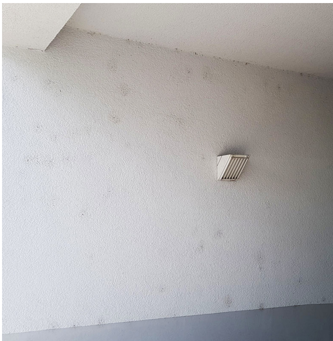
Abb. 2: Ein typisches Bild verunreinigter Netze von Brigittea civica an einer weiß verputzten Wand