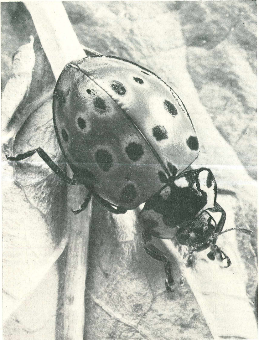
Abb. 3: Auch dieser Marienkäfer, Anatis ocellata L. war an der geschilderten Wanderung beteiligt.