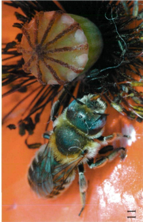
Abb. 9-12: (9) Blüte des Blutroten Storchschnabels, von Osmia tergestensis angebissen, Schönberg am Kamp, 30.V.2005; (10) Osmia tergestensis , Weibchen, Schönberg am Kamp, 30.V.2005; (11) Osmia papaveris , Weibchen auf einer Mohnblüte, St. Margarthen, 19.VI.2004; (12) Osmia villosa , Weibchen beim Nest, Wienerwald, 28.V.2005.