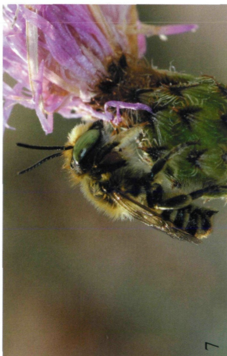
Abb. 5-8: (5) Megachile octosignata , Weibchen, Gumpoldskirchen, 8.VIII.2004; (6) Megachile deceptor , Weibchen, Illmitz, 19.VII.2004; (7) Megachile flabellipes , Männchen, Hainburg, Schloßberg, 2.VIII.2004; (8) Osmia mustelina , Weibchen bei der Nestanlage, Braunsberg, 4.VII.2004.