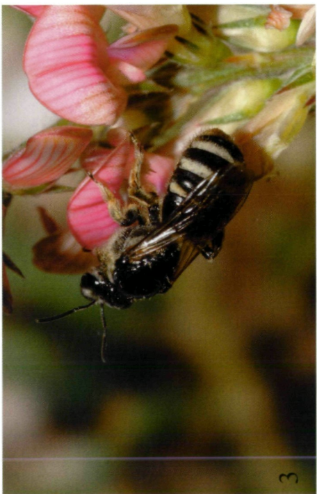
Abb. 1-4: (1) Andrena decipiens , Weibchen, Hölle bei Illmitz, 6.VIII.2004; (2) Camptopoeum frontale , Weibchen, Hundsheimer Berg, 2.VIII.2004; (3) Lasiosiglossum discum discum , Weibchen, Fischawiesen bei Gramatneusiedl, 17.VI.2005; (4) Melitta dimidiata , Weibchen, Fischawiesen bei Gramatneusiedl, 17.VI.2005.