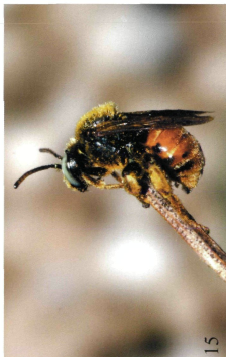
Abb. 13-16: (13) Ceratina nigrolabiata , Weibchen, Spitzerberg, 5.VIII.2004; (14) Ammobates vincetus , Weibchen, Eichkogel bei Mödling 30.VII.2004; (15, 16) Epeoloides coecutiens , Männchen (15) und Weibchen (16), Wien 21.VII.2005.