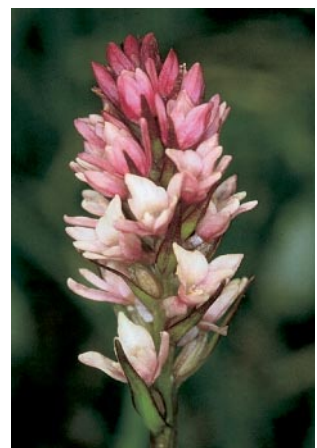
× Gymnigritella heufleri , Schatzalp Davos (CH), 22. 7. 98