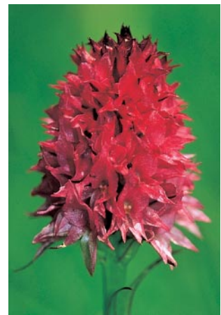
Nigritella dolomitensis , Val da Fanes(I), 14. 7. 89