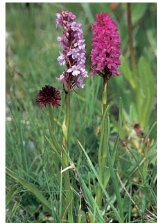
× Gymnigritella suaveolens mit «Eltern» N. rhellicani und Gymnadenia conopsea ; Val Badia, (I), 25. 7. 89