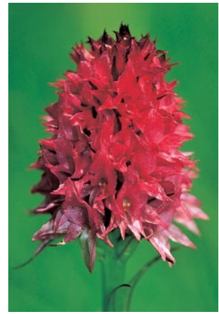
Nigritella dolomitensis , Val da Fanes(I), 14. 7. 89