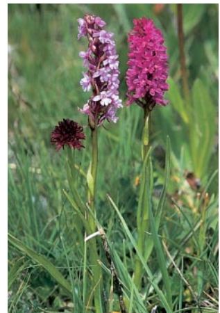
×Gymnigritella suaveolens mit «Eltern» N. rhellicani und Gymnadenia conopsea ; Val Badia, (I), 25. 7. 89