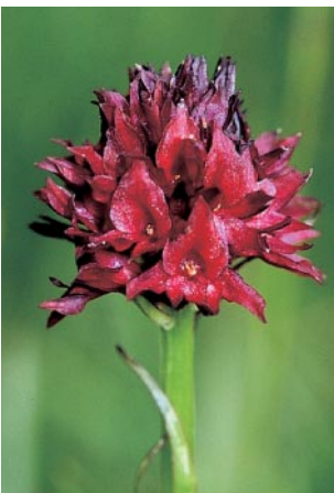
Nigritella austriaca , Seiser Alm (A), 12. 7. 90