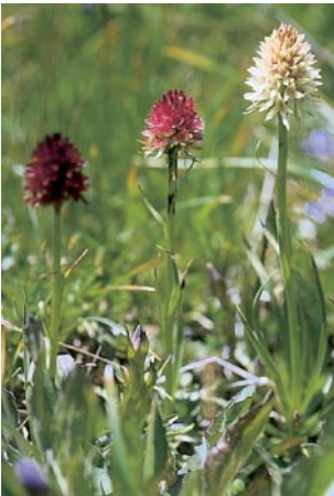
Nigritella rhellicani , Farbvarianten, Pufplatsch (A), 9. 7. 90

TEPPNER & KLEIN (1990) haben festgestellt, dass die alpinen Pflanzen durch ovalen Blütenstand, kleinere Blüten und buchtig gezähnte Brakteenränder merklich von den von Linné beschriebenen skandinavischen Pflanzen abweichen. Jeder wissenschaftliche Name aber bezieht sich auf ein ganz bestimmtes Individuum, auf den sogenannten Holotyp. Wenn dieser nun eine in Schweden vorkommende Pflanze ist, müssen die abweichenden Pflanzen unserer Region umbenannt werden. So taufte TEPPNER & KLEIN (1990) die bei uns heimische Art N. rhellicani , zu Ehren von Johann Müller aus Rellikon am Greifensee, genannt Rhellicanus, der als Erster die Pflanze 1536 in einem Gedicht über eine Wanderung auf das Stockhorn als Christi manus erwähnt.