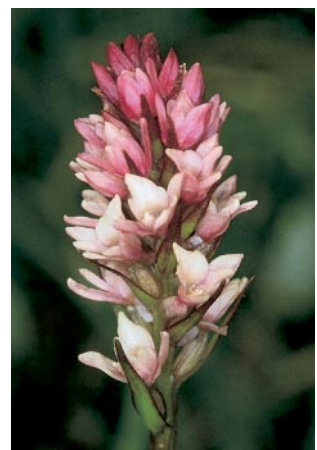
×Gymnigritella heufleri , Schatzalp Davos (CH), 22. 7. 98