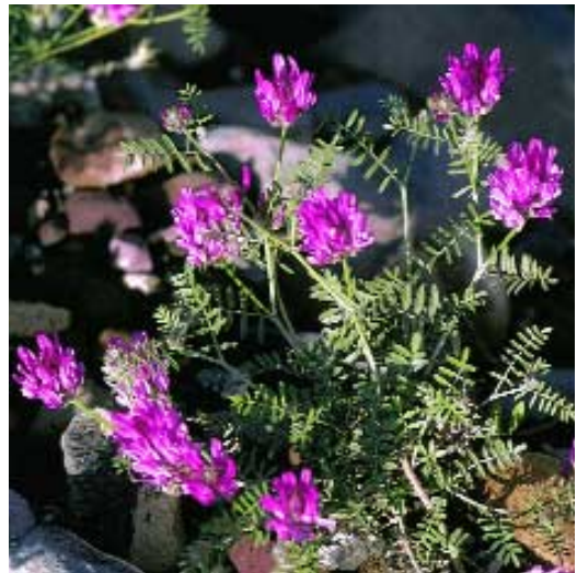
Abb. 11: Astragalus cancellatus Bunge