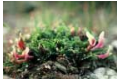
Astragalus brevidentatus Podlech