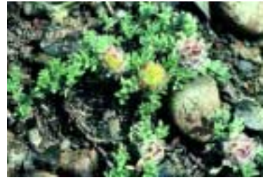
Astragalus pelliger Fenzl