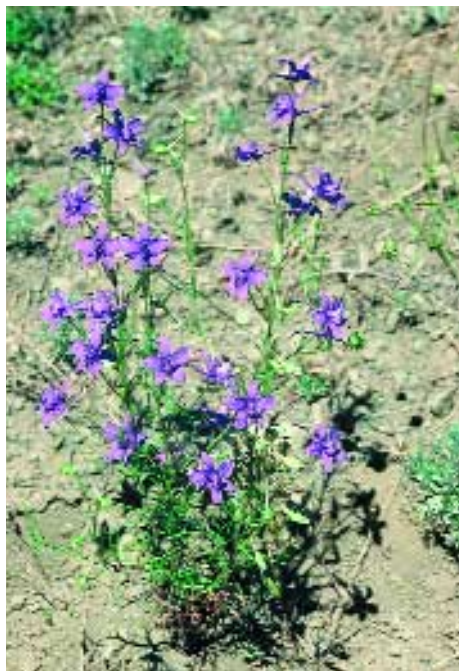
Abb. 1: Consolida armeniaca (Stapf ex Huth) Schröd.