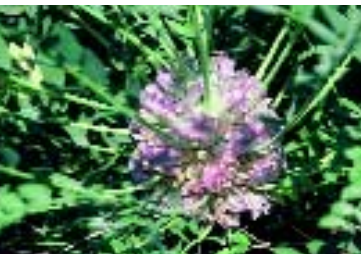
Astragalus dipodurus Bunge