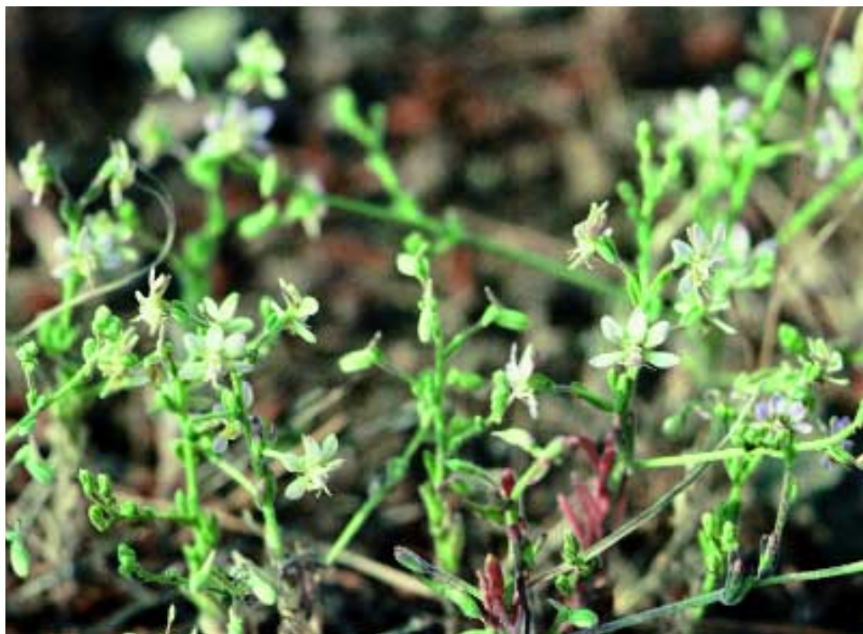
Abb. 3: Consolida lineolata Hub.-Mor. & Simon