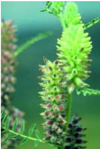
Abb. 10: Astragalus crinitus Boiss.