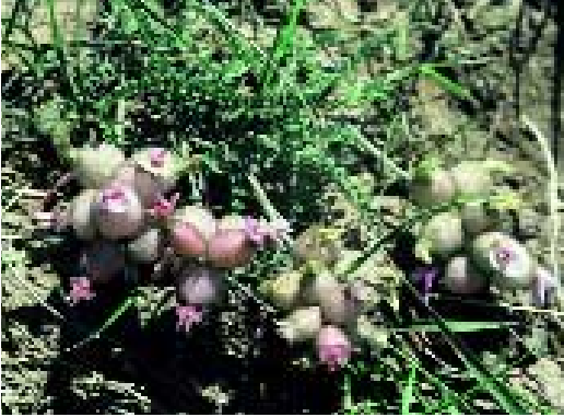
Abb. 14: Astragalus lineatus Lam. var. jildisianus (Bornm.) Matthews