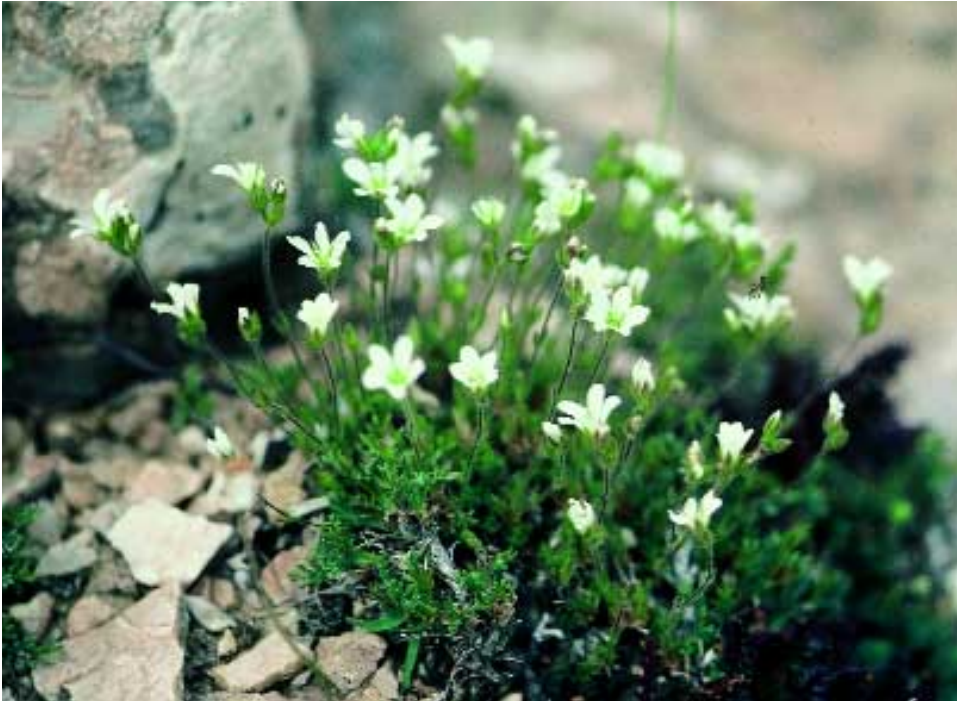
Abb. 4: Minuartia rimarum (Boiss. & Bal.) Mattf. var. multiflora