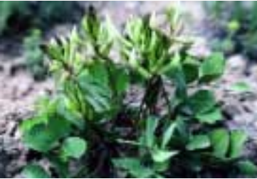
Astragalus paradoxus Bunge