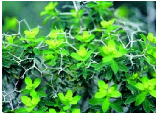
Abb. 6: Euphorbia austroanatolica Hub.-Mor. & M.S. Khan