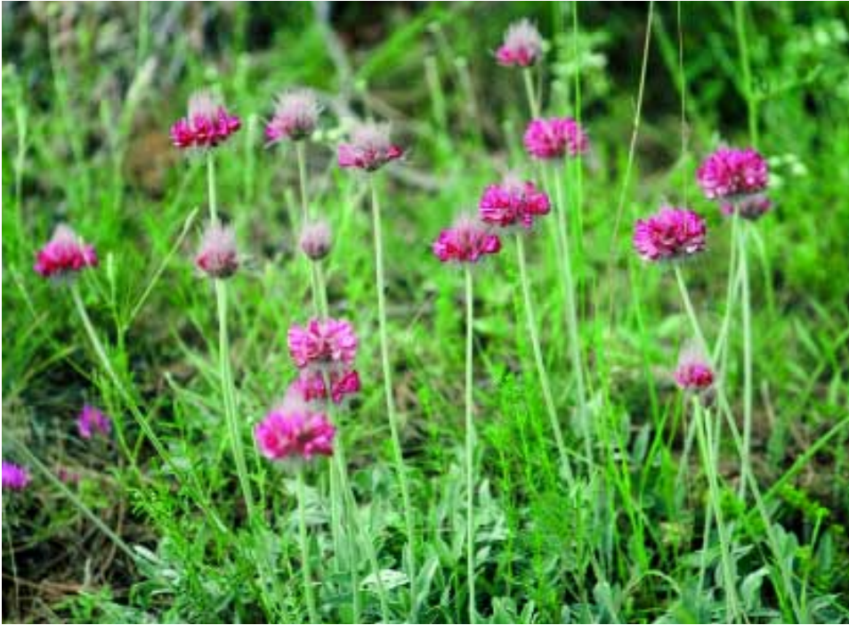
Abb. 7: Ebenus longipes Boiss. & Bal. in Boiss.