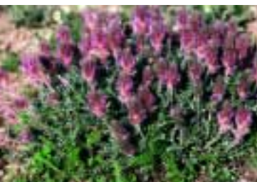
Astragalus hirticalyx Boiss. & Kotschy