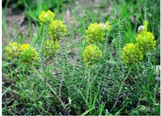
Abb. 15: Astragalus melitenensis Boiss.