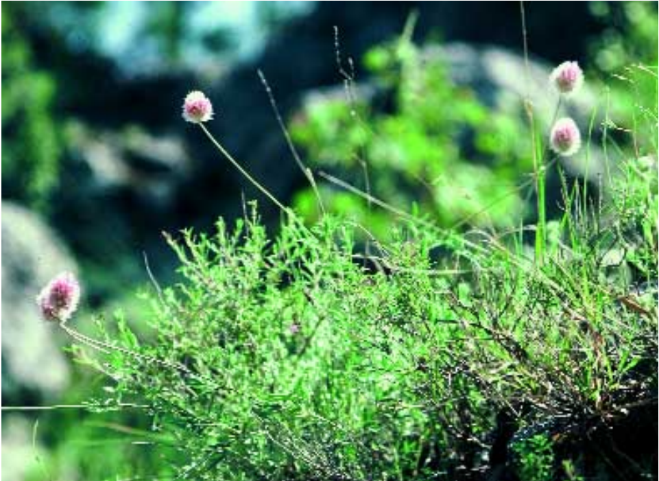
Abb. 9: Ebenus reesei Hub.-Mor. var. reesei