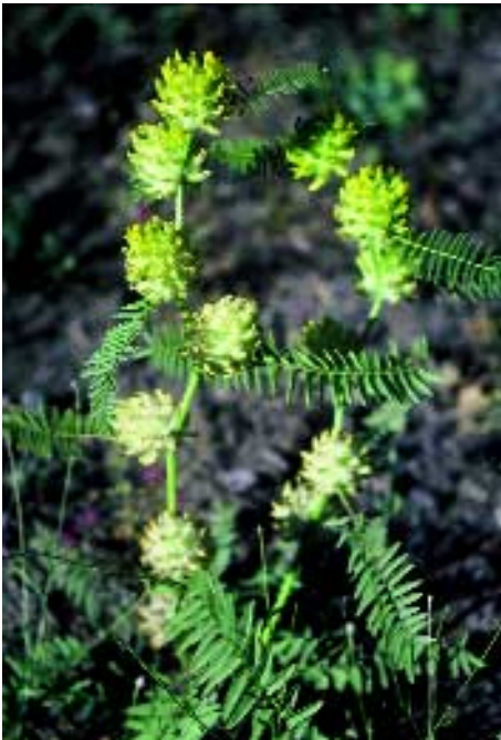
Abb. 16: Astragalus panduratus Bunge