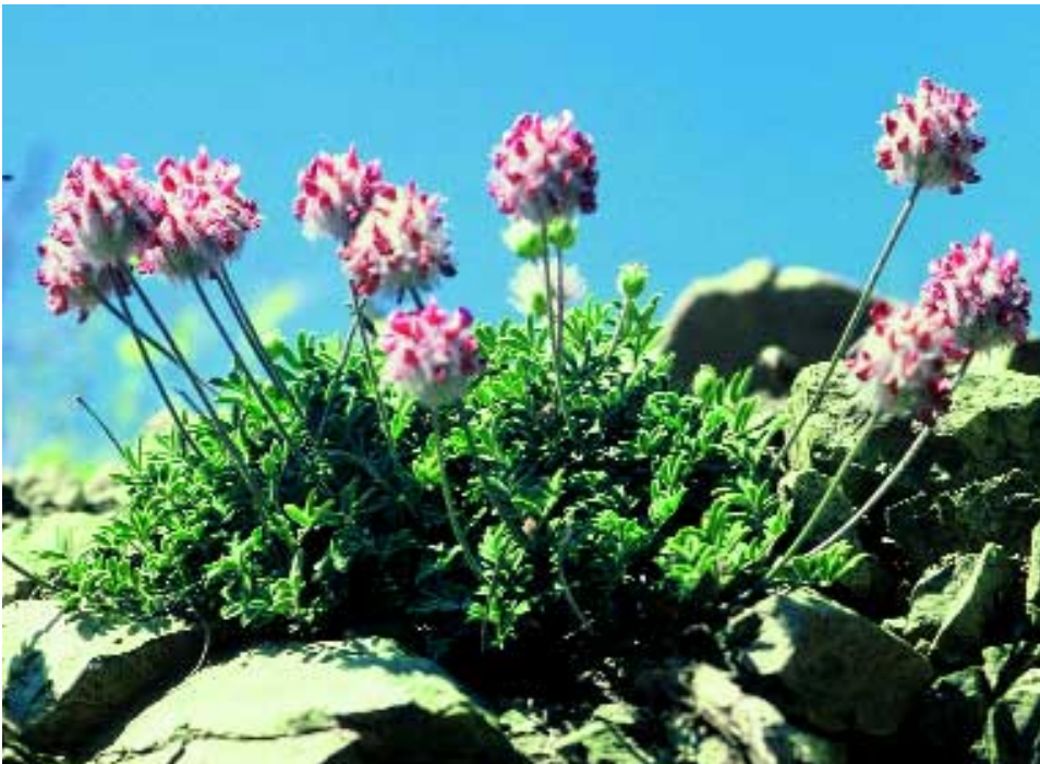
Abb. 8: Ebenus pisidica Hub.-Mor. & Reese