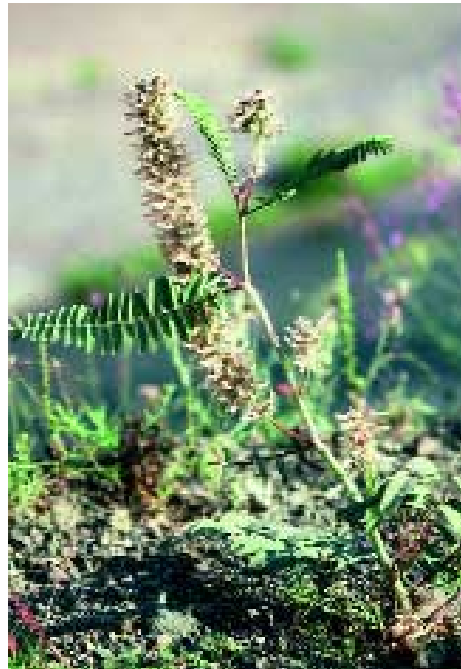
Abb. 17: Astragalus trichocalyx Trautv.