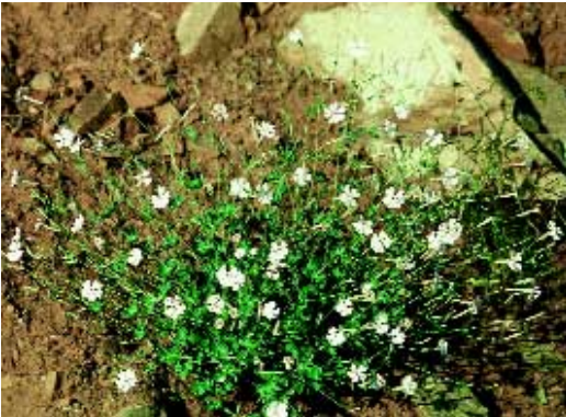
Abb. 5: Silene cariensis Boiss.