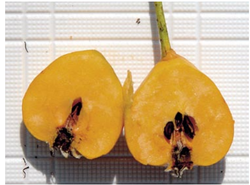
Fig. 5: Coupe du fruit

jaune-orangé, douce et sucrée, peu parfumée, à odeur douceâtre et à consistance de pomme farineuse (parfois à saveur de coing), pépins non fertiles. Fleur: avril à mai; fruit: mi-août à octobre.