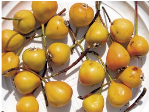
Fig. 4: Les «poires de Bollwiller», fruits du Sorbopyrus auricularis