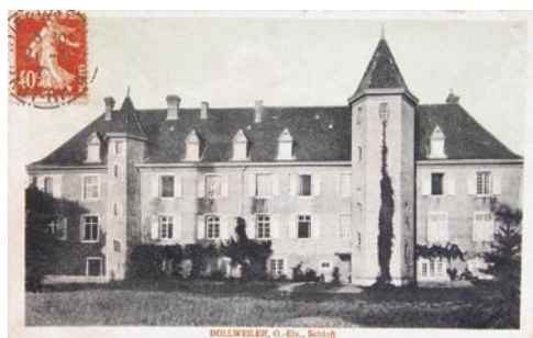
Fig. 7: Le Château Rosen de Bollwiller au début du 20 ème siècle