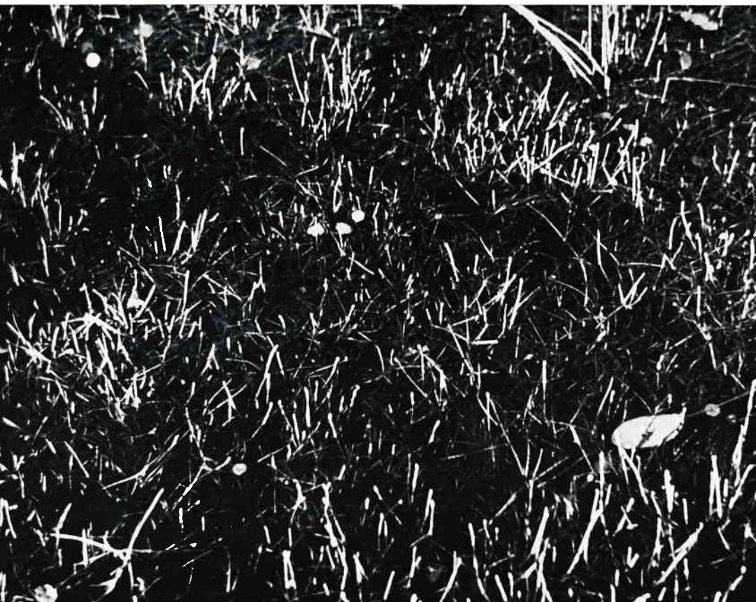
Abb. 4: Das Eleocharitetum fluitantis Allorge 22.