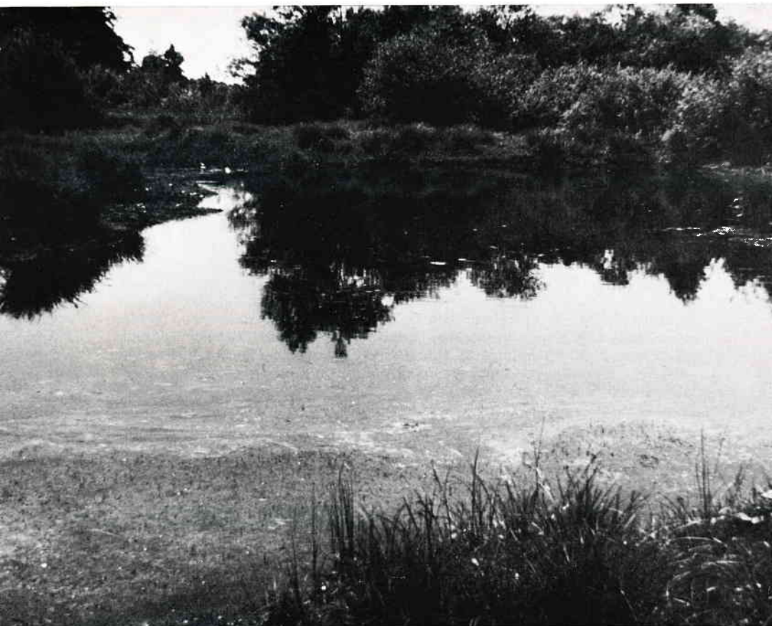
Abb. 2: Der Langenbergteich am 12. 6. 1976. Im Vordergrund links ist die Flut-simsen-Gesellschaft bereits zu erkennen.