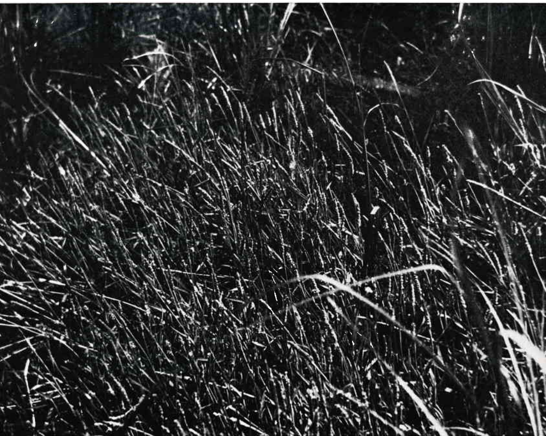
Abb. 5: Das Alopecuretum aequalis Burrichter 60.