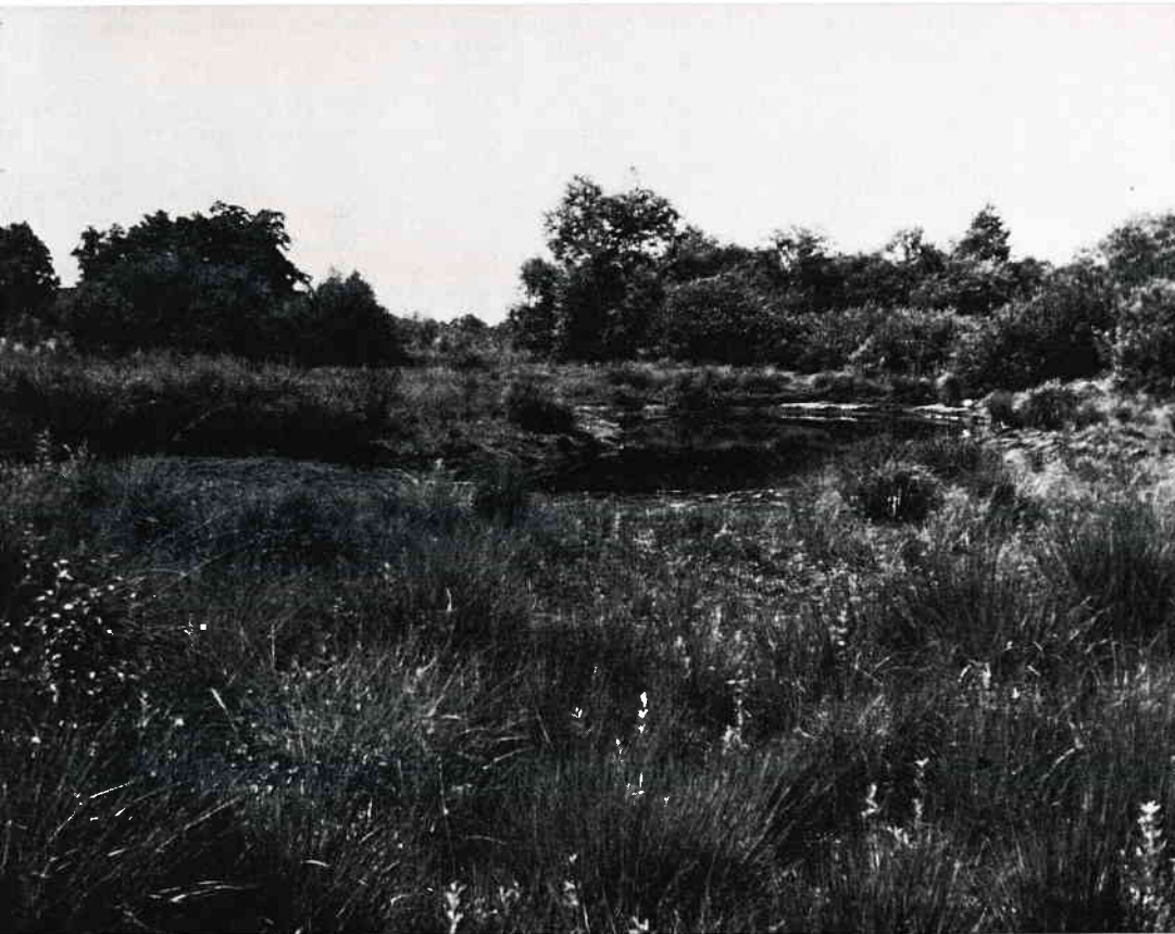
Abb. 3: Der Langenbergteich im August 1976. Etwa \frac{1}{4} der Wasserfläche ist trockengefallen.