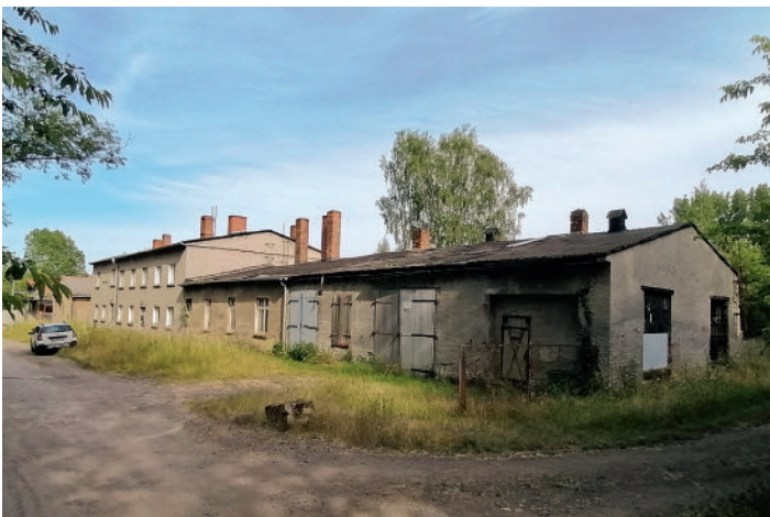
Abb. 2: Das ehemalige Zechenhaus „Am Dreieck“. The former colliery house „Am Dreieck“.

Gehlhaars Garten reichte bis an die Böschung der Schädemulde heran. Hier fanden sich inmitten von Obstgehölzen, Gemüse- und Blumenbeeten eine Gartenlaube, eine Tischlerwerkstatt sowie Vogelvoliere, Hühnerstall und Bienenstöcke. Meist hingen Spannnetze zwischen den Apfelbäumen, in denen sich von der Nachtigall ( Luscinia megarynchos ) bis zum Eisvogel ( Alcedo atthis ) Kleinvögel in einer bemerkenswerten Artenzahl fingen. Auf dem freien Platz in der Mitte des Gartens stand eine Kleinvogelreue, meist mit einem Girlitz ( Serinus serinus ) als Lockvogel in einem kleinen Käfig darinnen. Im Starkasten neben der Werkstattür brüteten mitunter Wendehälse ( Jynx torquilla ) und im Habichtskorb auf dem Dach des Bienenhauses wurden zahlreiche Mäusebussarde ( Buteo buteo ), Habichte ( Accipiter gentilis ), Turmfalken ( Falco tinnunculus ) und Sperber ( Accipiter nisus ) gefangen, aber auch Waldkauze ( Strix aluco ) und Waldohreulen ( Asio otus ). Abseits des Dorfes, von Kleingärten umgeben, war hier über die Jahre eine Art ornithologische Station entstanden – die man die „Beringungsstation Luckenau“ hätte nennen können.