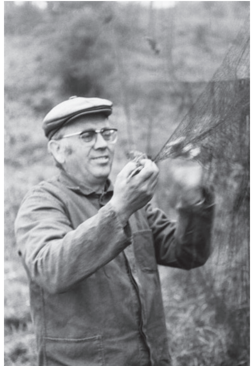
Abb. 1: 1983 beim Fang von Grasmücken. – 1983 catching warblers.

Die Beringung von Vögeln, also die individuelle Markierung mit nummerierten Aluminiumringen, ist nach wie vor die wichtigste Methode der Vogelzugforschung. Wenn man die geographischen Punkte der Beringung und des Wiederfinds eines Vogels auf einer Karte verbindet, kann man Richtung und Entfernung der