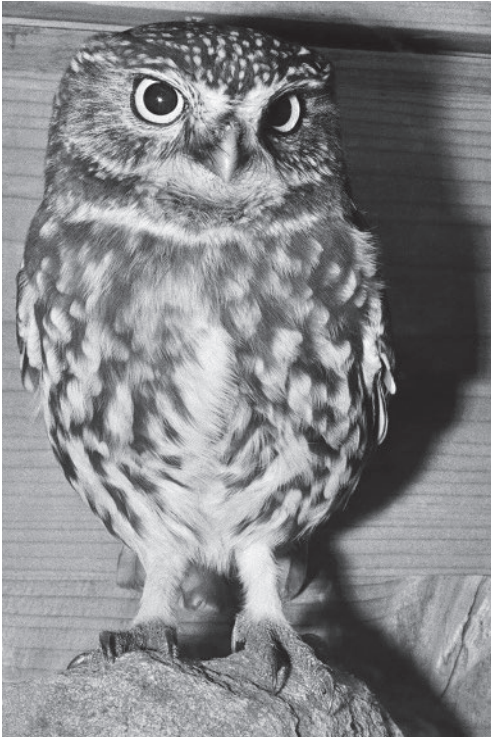
Abb. 6: Unser letzter Steinkauz – im Spätherbst 1984. – Our last Little Owl – in late autumn 1984.