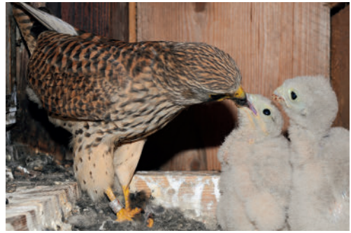
Abb. 7: Das 2019 vom Team Gehlhaar/Köhler in Heuckewalde bei Zeitz beringte Turmfalkenweibchen 2020 beim Füttern seiner Jungen in Blankenstein bei Dresden. – The female Common Kestrel, ringed 2019 from the team Gehlhaar/Köhler in Heuckewalde near Zeitz, feeding its young in Blankenstein near Dresden in 2020.

Nun, 38 Jahre später, lebe ich mit meiner Familie in der Nähe von Dresden. Auch hier habe ich im benachbarten Kirchturm einen Nistkasten für Turmfalken angebracht. Als dieser im Frühjahr 2020 mit Schleiereulen besetzt war, baute ich im Giebel unseres Wohnhauses noch einen Kasten für die Turmfalken ein, der auch sofort angenommen wurde. Als ich beim