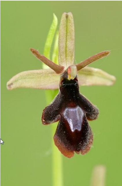
Abb. 8: Ophrys x royanensis , Department Hautes-Alpes Frankreich, Fotos: Olivier Tourillon, 2008