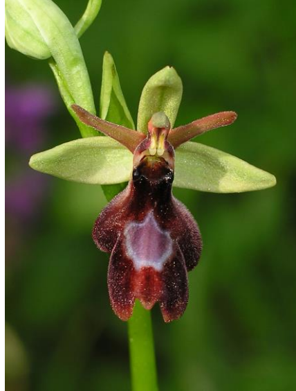
Abb. 7: Ophrys x royanensis , nördlich Drügendorf, 06.06.13