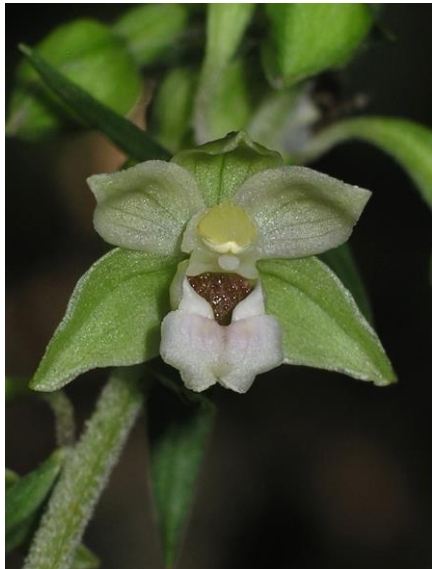
Abb. 5: Epipactis moratoria , Pinzberg, Ebermannstadt, 24.07.15