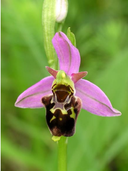
Abb. 6: Ophrys x albertiana , nördlich Drügendorf, 30.05.14