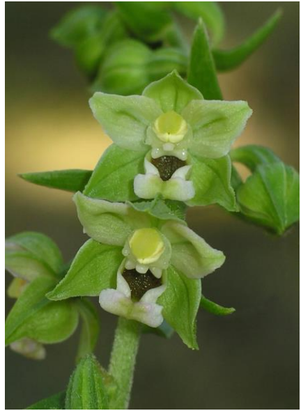
Abb. 3: Epipactis moratoria , Ebermannstadt, 03.08.15