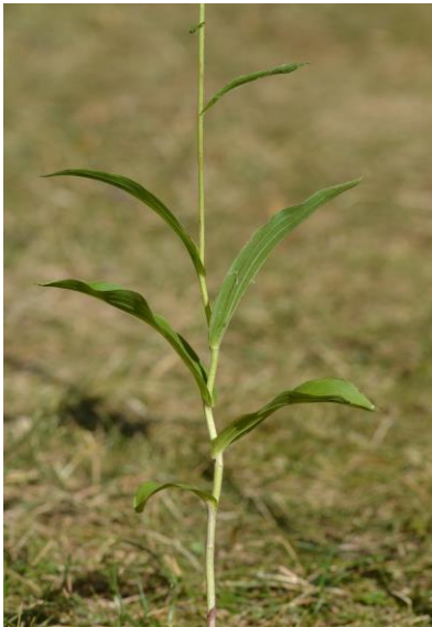
Abb.4: Epipactis moratoria , Ebermannstadt, 03.08.15