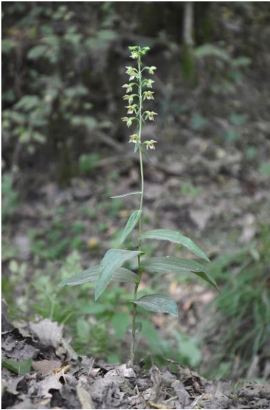
Abb. 2: Epipactis moratoria , Pinzberg, 02.07.15