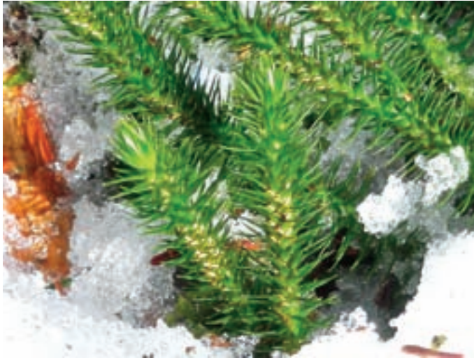
Huperzia selago im Reichholzrieder Moos, 9.3.2013.