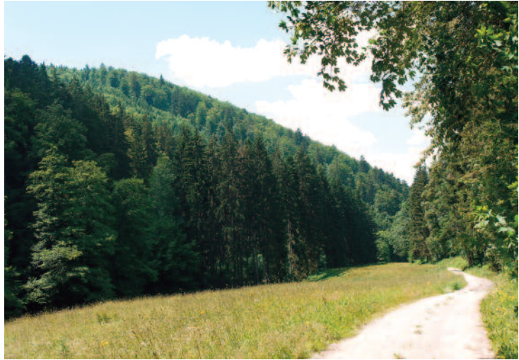
Abb. 2: Blick vom Ilmtal auf den Nordhang des NSG.

überall sehr tiefgründig zu lehmigen, sauer reagierenden Skelettböden mit geringem Wasserspeichervermögen verwittert, die in die basenarme Braunerde einzustufen sind. Sie weisen eine Mull- oder Moderauflage auf. In den lokal vorhandenen Fichtenforsten sind dagegen Rohhumusdecken verbreitet. Nur in der Bachaue hat sich ein junger Schwemmboden vom Typ Vega entwickelt.