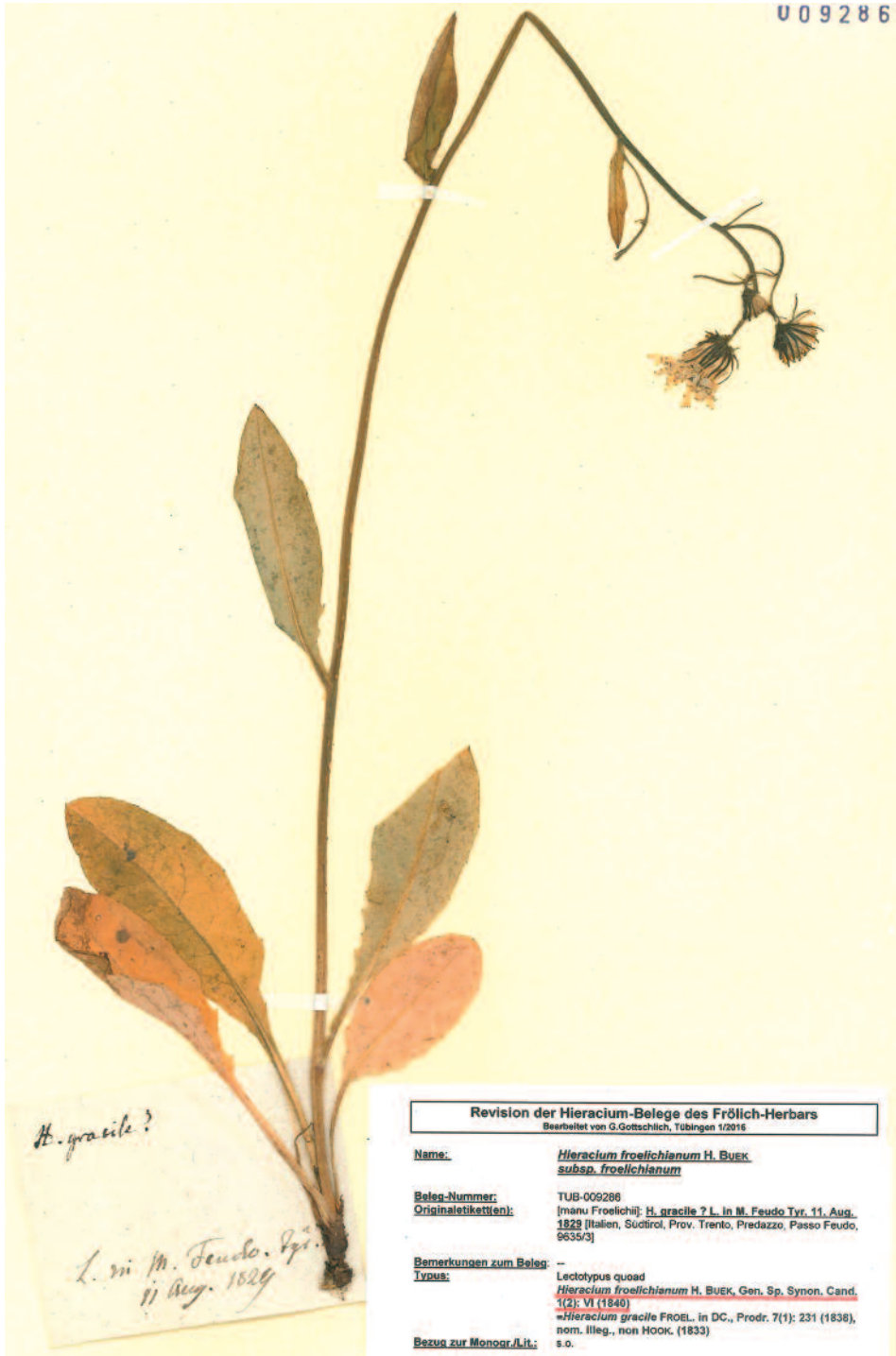
Abb. 1: Hieracium froelichianum subsp. froelichianum , Lectotypus (TUB)