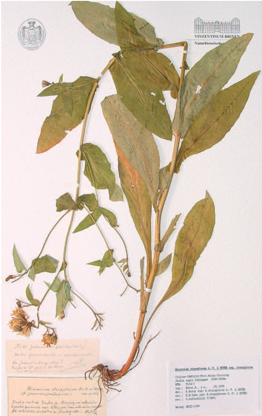
Abb. 4: Hieracium entleutneri , Holotypus (BOZ)